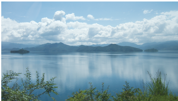
孕育了南诏国和大理国的洱海