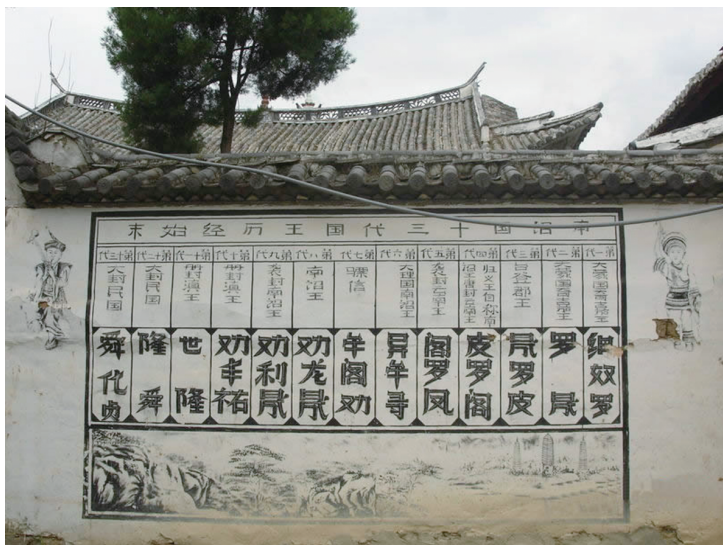
土墙上的南诏十三代王名榜