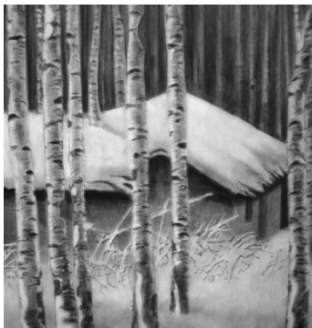
从桦树墩中可以提取桦汁

桦汁可从树墩中得到。人们发现,10~2月间伐下树干的树墩,春天会分泌丰富的汁。只要用一个半圆形金属槽,插入树皮,挂上一个罐,几小时内汁就会流满。在采汁季节,每个树墩可采100~1000公升汁,这比生长中的树上采的汁要多。汁要通过蒸发法来加以浓缩,据计算,1万公顷桦林一年可得30万吨桦汁,合含糖量60%的糖浆约5000吨。