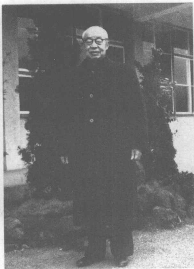
1963年3月攝於臺灣中央研究院