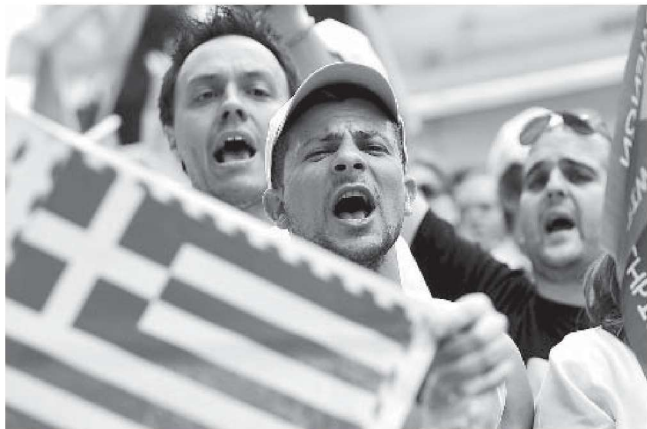
2011年5月30日，希腊邮政银行的雇员在宪法广场议会大楼前集会，反对政府为应对债务危机而采取的紧缩措施。

债务危机爆发后，国际舆论开始指责希腊，认为希腊开始进欧元区时，就在政府账目上做了手脚，拿出了一份符合马斯特里赫特条约标准的账单。希腊进入欧元区后，享受了统一货币的好处，特别是希腊在债务市