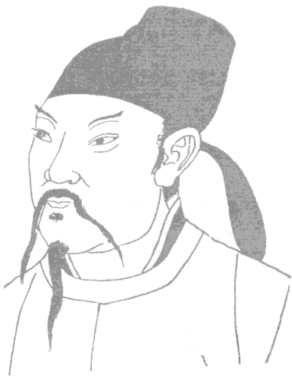
李 白 像