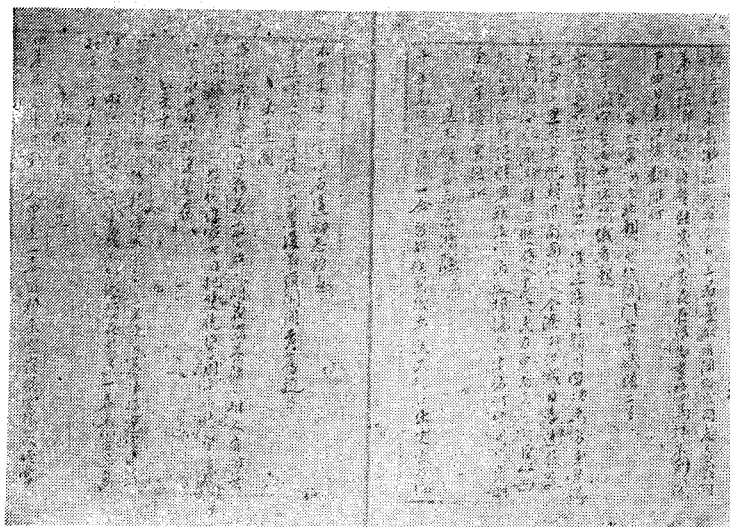
五、《甫田集》文嘉鈔本書影