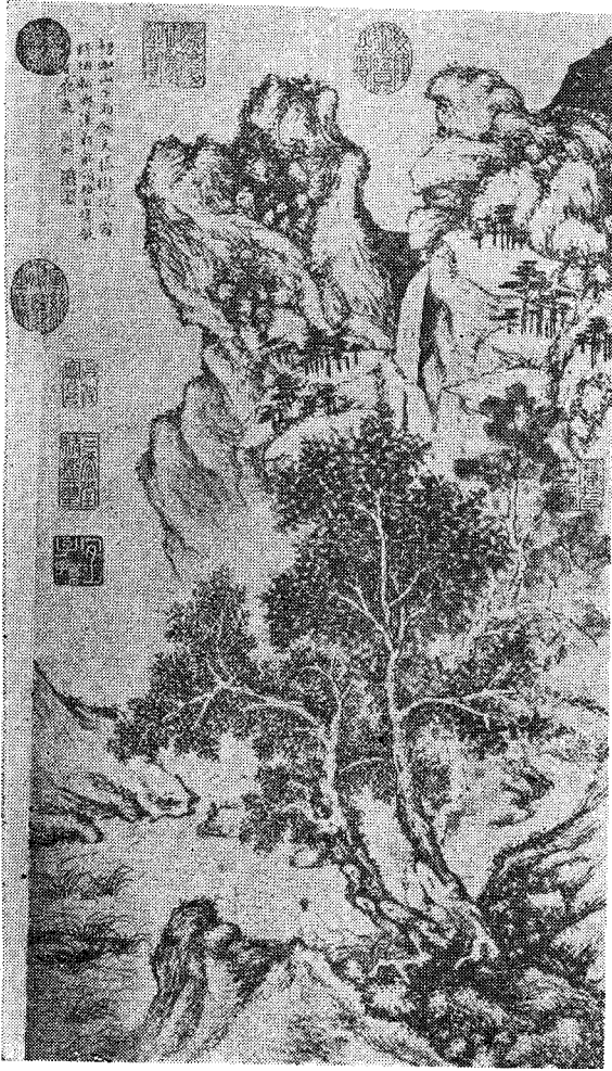
二、文徵明繪《好雨聽泉圖》