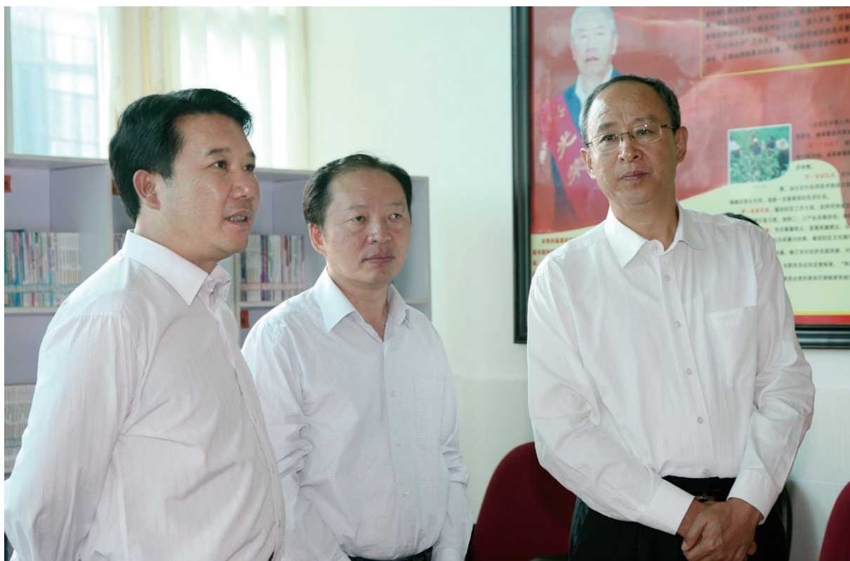
8月23日 省委常委、省委组织部部长刘维佳（右一）在州委书记刘明（中）、县委书记徐会良（左一）的陪同下到祥城镇城西社区调研基层党建工作。