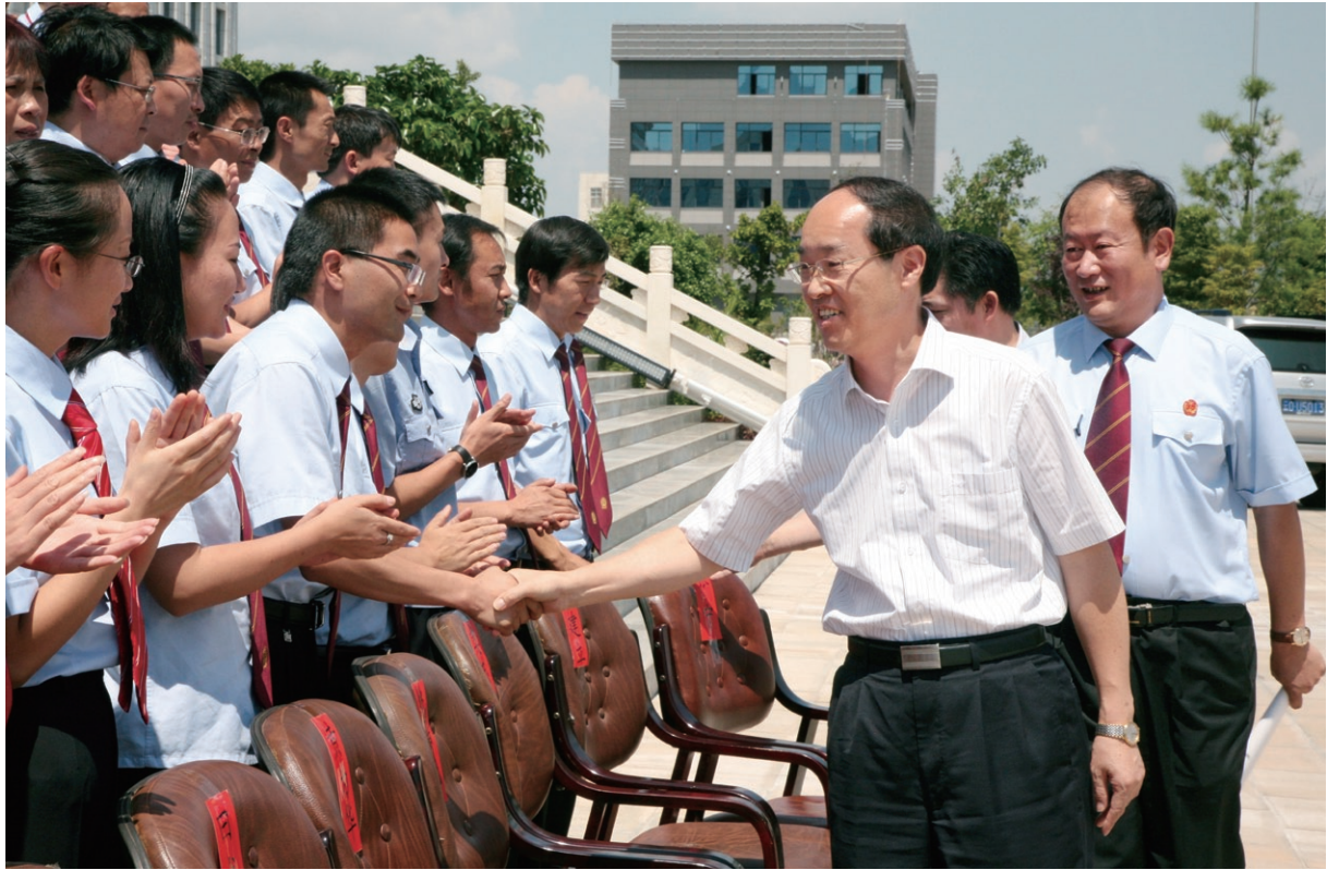
7月19日 最高人民法院副院长万鄂湘（右二）到祥云视察工作并看望祥云县法院全体干警。