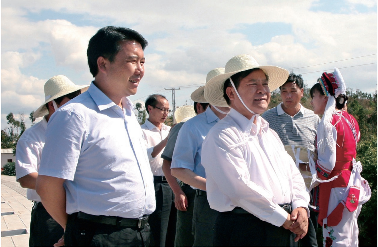
6月17日 省委副书记李纪恒（前排右一）在县委书记徐会良（前排左一）等领导的陪同下到祥云县财富工业园区调研。