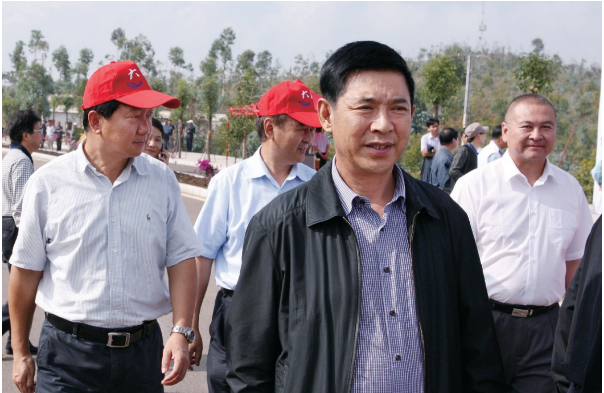
9月5日 州政协主席袁爱光（右二）到祥云财富工业园区调研。