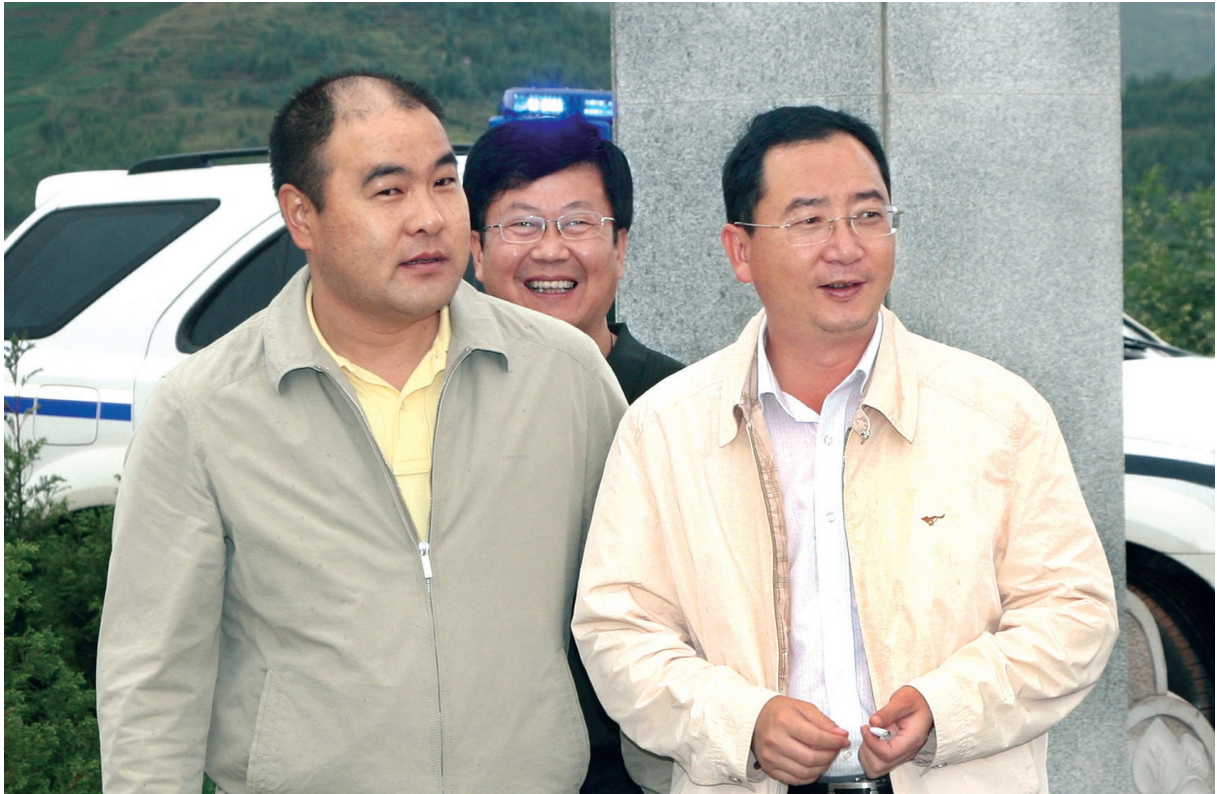
7月13日 省委常委、政法委书记杜涛（右一）到祥云调研政法综治维稳工作。