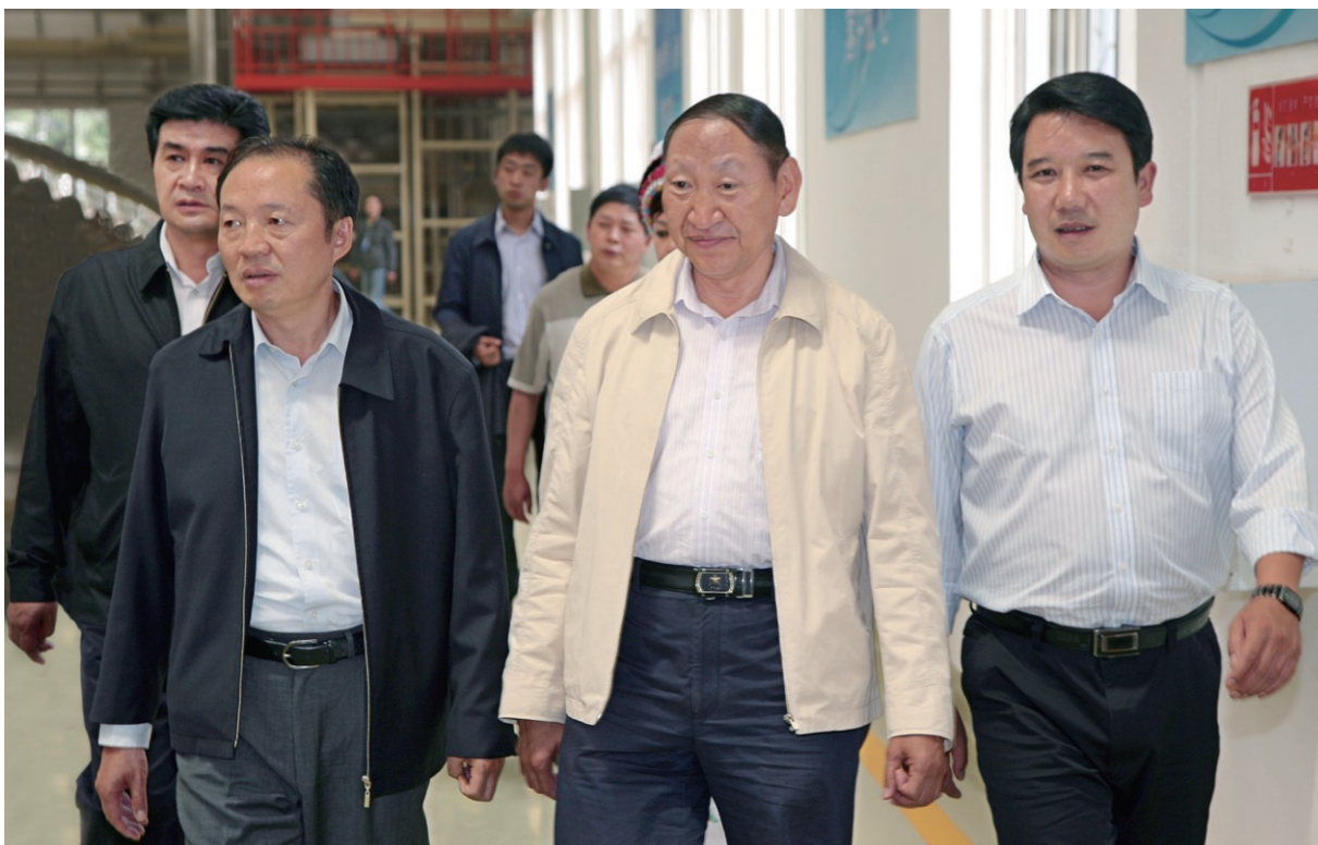
5月17日 省委常委、常务副省长罗正富（右二）在州委书记刘明（左二），州委副书记、州长何金平（左一），县委书记徐会良（右一）等领导的陪同下到大理州烟叶复烤厂调研。