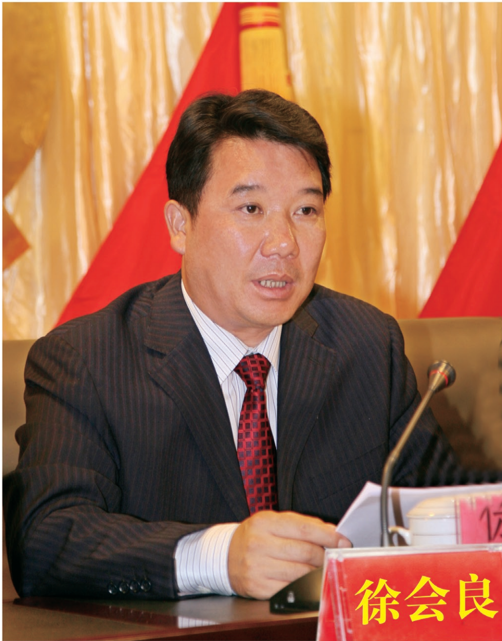
中共祥云县委书记 徐会良

执政感言： 凡是有利于推动经济又好又快发展、有利于促进社会和谐稳定、有利于提高人民群众生活水平的事情，我们都可以放手试、勇敢闯、大胆做，在全县上下大力营造支持改革、鼓励创新、善待挫折、宽容失败的良好氛围。进一步树立“看不到差距就是最大的差距、看不到危机就是最大的危机”的意识，坚决摒弃一切因循守旧、小进则满的思想观念，转变一切安于现状、无所作为的精神状态，革除一切羁绊手脚、阻碍发展的条条框框，想前人未想过或想不到的事，做别人未做过或不敢做的事，积极探索科学发展途径、争创科学发展优势、破解科学发展难题、加快科学发展步伐。