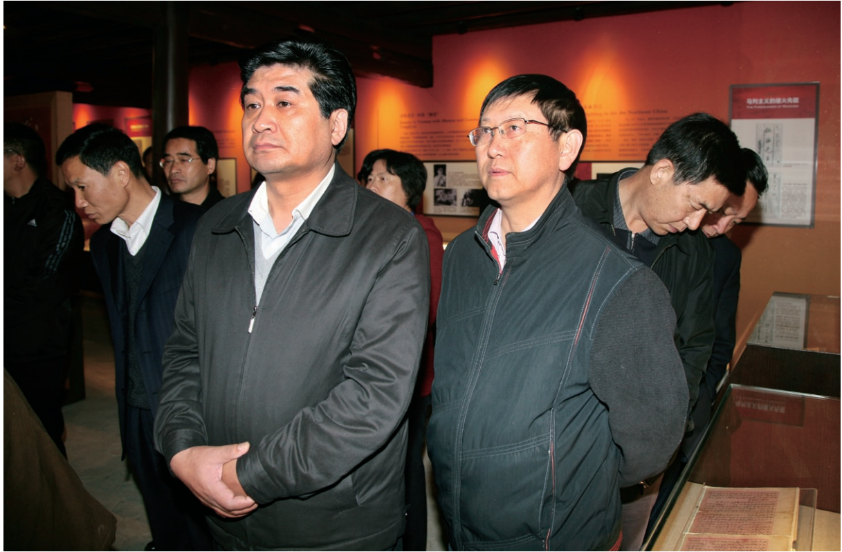
3月30日 州委副书记、州长何金平（右二）在县委原书记杨建华（右一），县委原副书记、原县长赵基（左一）等领导的陪同下，到刘厂镇王复生、王德三烈士故居调研。