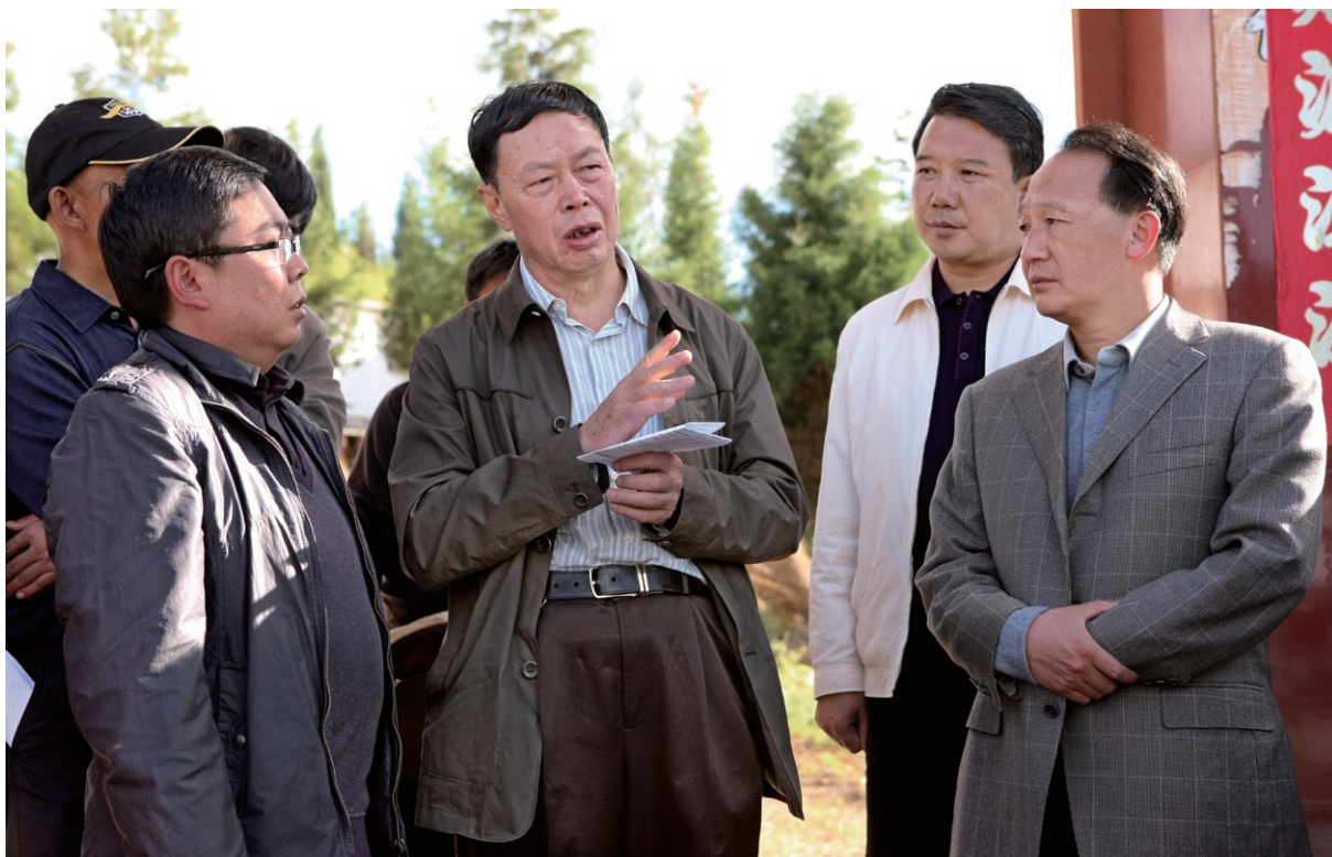
10月24日 省政协副主席王学智（中）一行在副州长段玠（右一），县委书记徐会良（右二）等领导的陪同下调研祥云县水资源情况暨抗旱保民生工作。