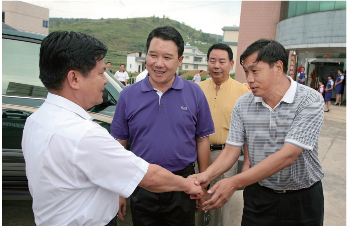
8月7日 省委副书记李纪恒（左一）在县委书记徐会良（中），县委副书记、县长王正林（右一）等领导的陪同下调研祥云县扶贫工作。