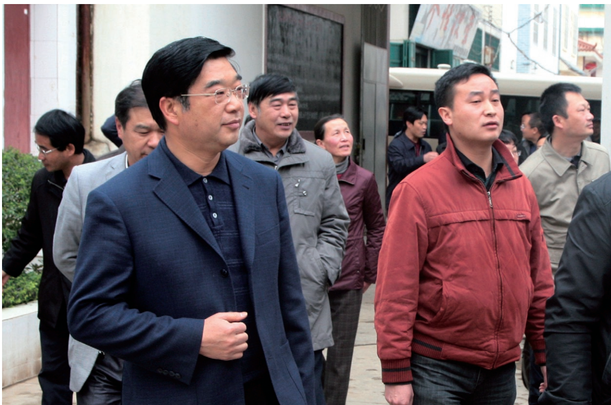
11月17日 州委常委、州纪委书记梁志敏（左一）到下庄镇调研。