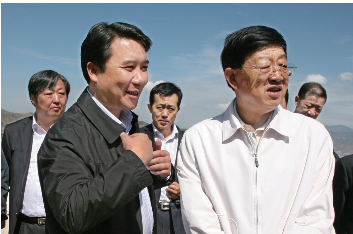
5月17日 省委书记、省人大常委会主任白恩培（右一）在县委书记徐会良（前排左一）等领导的陪同下调研中国烟草云南祥云大型水源工程建设情况。