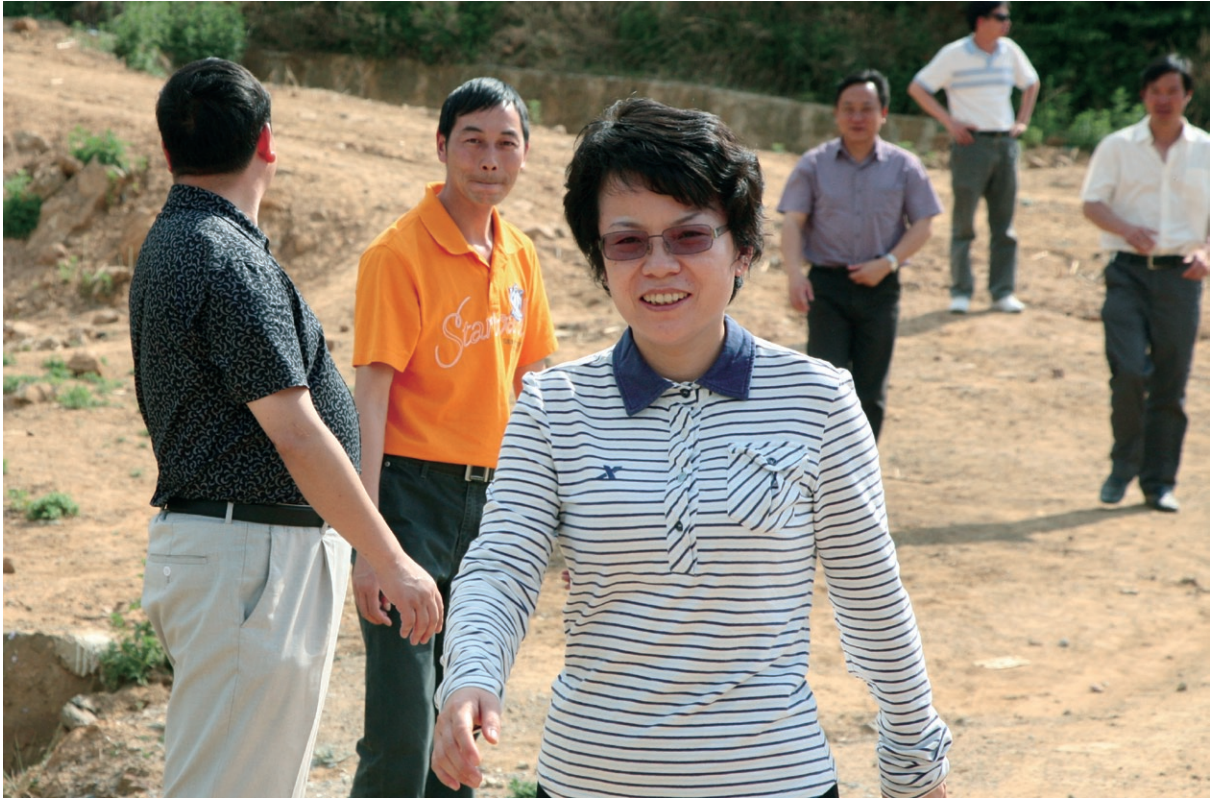
8月23日 省委常委、组织部部长叶翠萍（右一）深入到米甸镇调研基层党建工作。