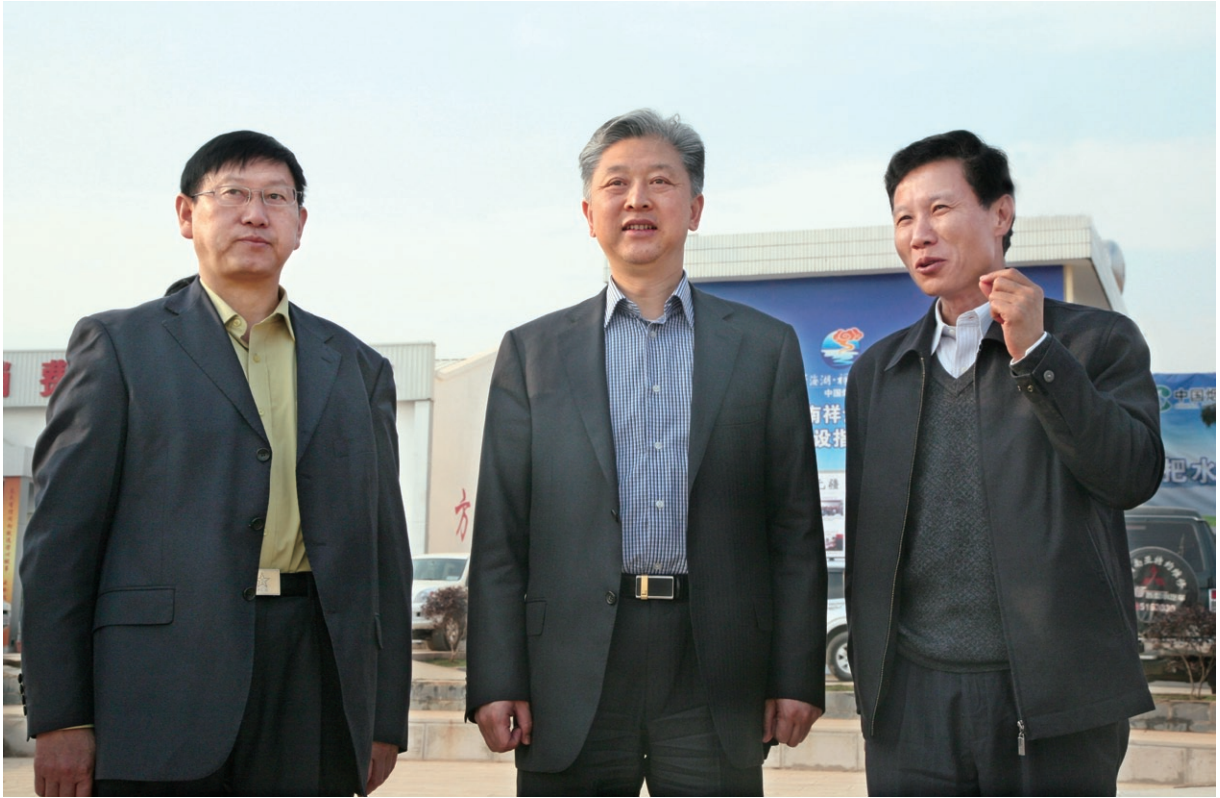
3月25日 省政协副主席顾伯平（中）在县委原书记杨建华（左一），县委原副书记、原县长赵基（右一）的陪同下调研中国烟草云南祥云大型水源工程建设。