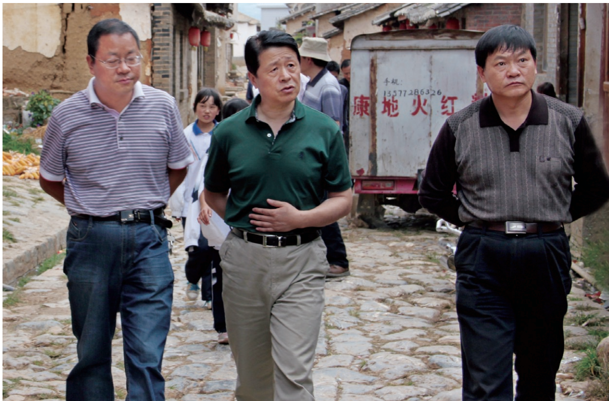
10月13日 省人大常委会副主任杨保健（中），在县人大主任普新中（右一），县委常委、常务副县长程永嘉（左一）等领导的陪同下视察《中华人民共和国文物保护法》实施情况。