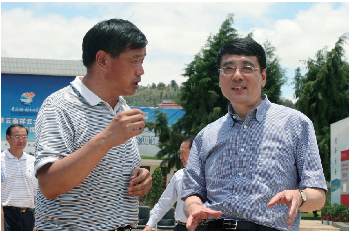
6月29日 国家烟草专卖局副局长李克民（右一）在县委副书记、县长王正林（左一）的陪同下视察中国烟草云南祥云大型水源工程建设。