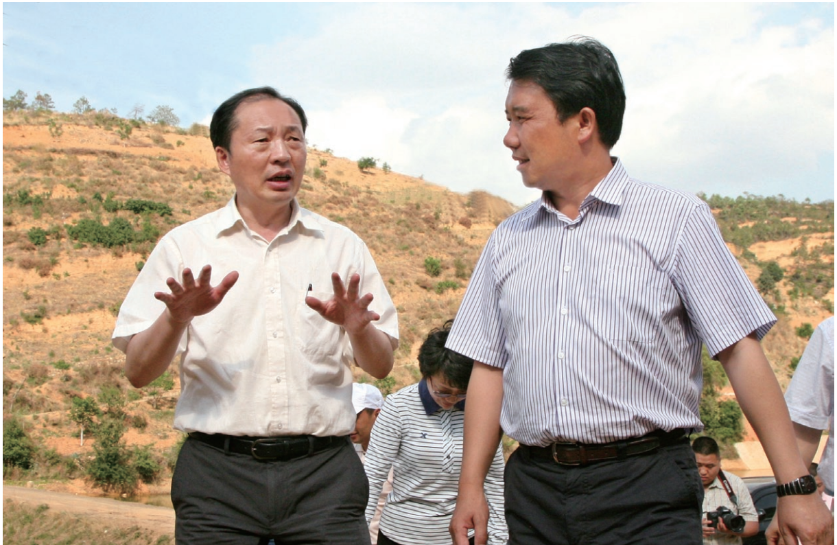
5月15日 州委书记刘明（左一）在县委书记徐会良（右一）等领导的陪同下深入到祥云县米甸镇调研。