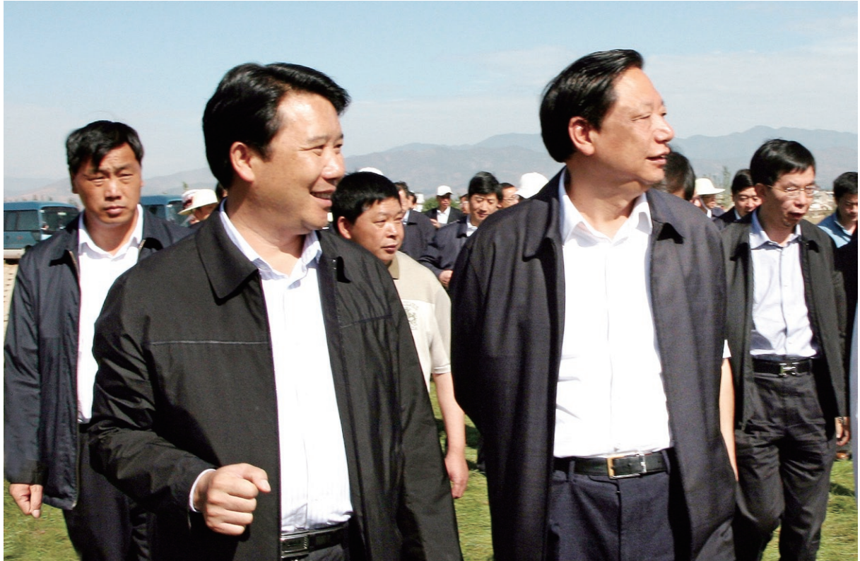
5月17日 国家烟草专卖局局长姜成康（右二）在县委书记徐会良（左二），县委副书记、县长王正林（左一）等领导的陪同下视察中国烟草云南祥云大型水源工程建设。