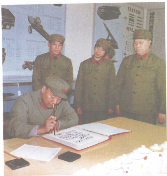
中心。作者（右1）签字留念。 河南省军区建设民兵训练