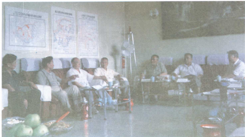
抗美援朝老师长、成都军区副司令员赵文进（左3），在65军主持研究抗美援朝经验教训，作者（左2）。右起：王维汉、杨秉余、孟令春、王守忠、邓雨浓。