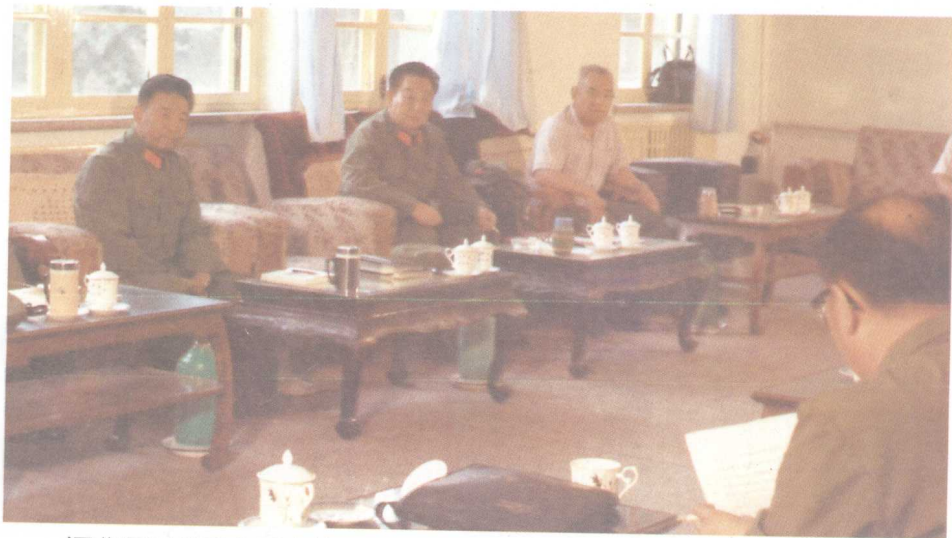
河北军区常委定下决策，打好建设民兵训练基地这一仗（1983年）。