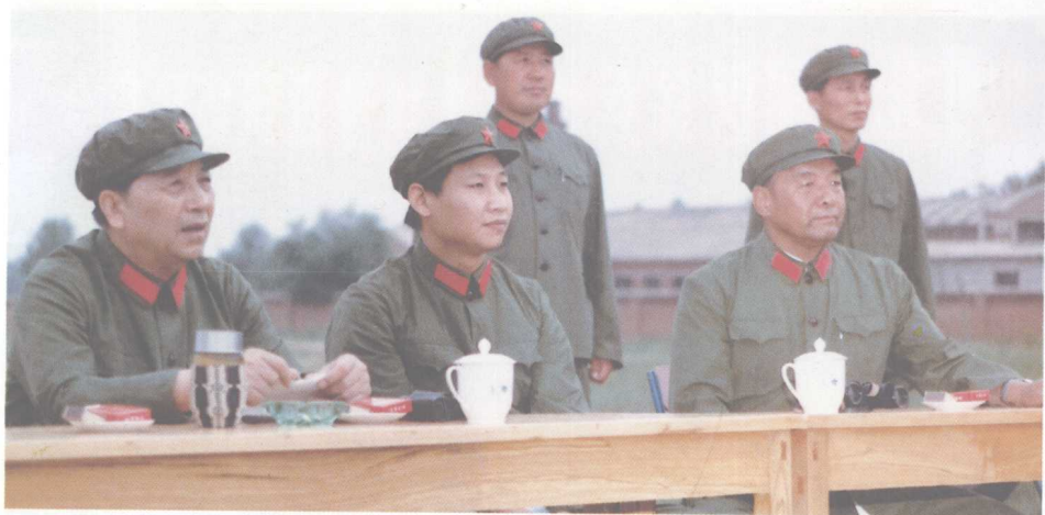
北京军区司令员秦基伟（左1）检查正定基地说，县建民兵训练基地是利国利民利军的大好事。中为正定县委书记兼武装部第一政委习近平（现福建代省长），右1为作者。后立者为县武装部部长、政委。