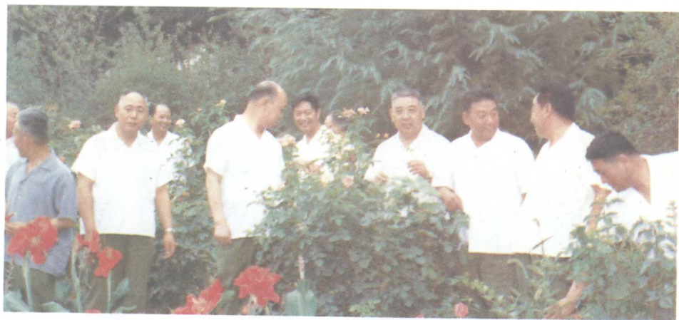
河北军区领导班子：1983 年。右起：副司令员李锡恩，政委费国柱，司令员张振川，副司令员刘长兴，后勤部长李纯胜，参谋长萧玉舟，主任吴富衡，副政委傅英杰，副司令员杨泽民。