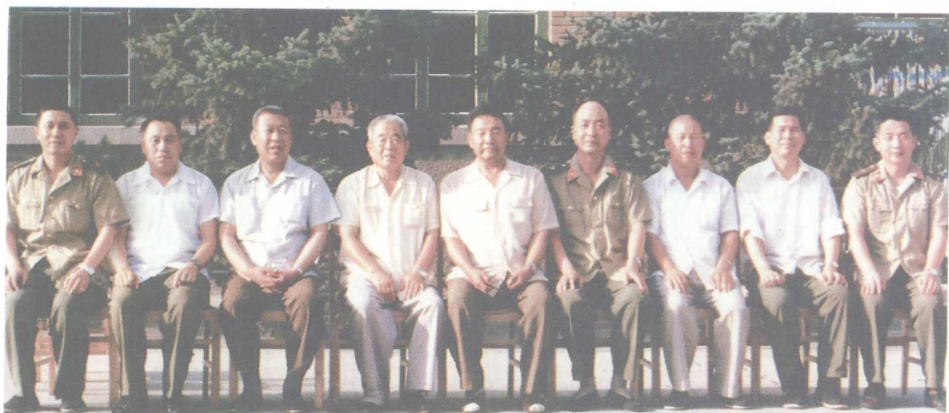
原 65 军的老战友在张家口军部相会留影。左起：田书根，现沈阳军区政治部主任；臧文清，现北京军区副司令员；孙致厚；刘克宽；张振川；曹和庆，现军委二炮副政委；刘长治；杨惠川，现北京军区副政委；陈玉田，现河北军区司令员。