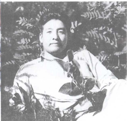
战斗间隙小休息在抗美援朝战场（1952年）