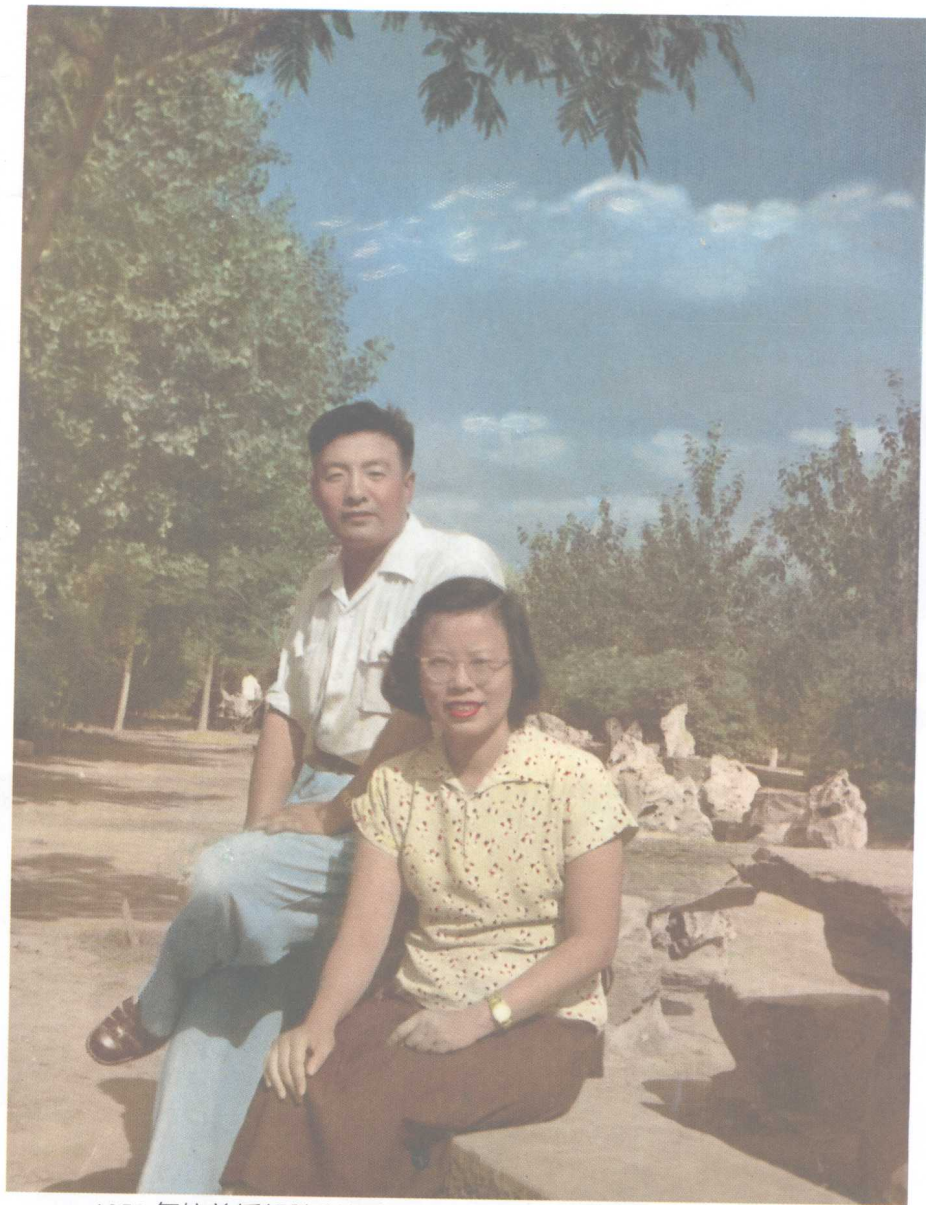
1953年抗美援朝胜利归来，1954年结伴侣，1956年摄于北京。