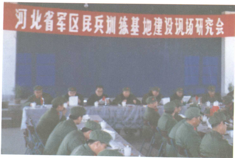
基地建设现场研究会（1984年）