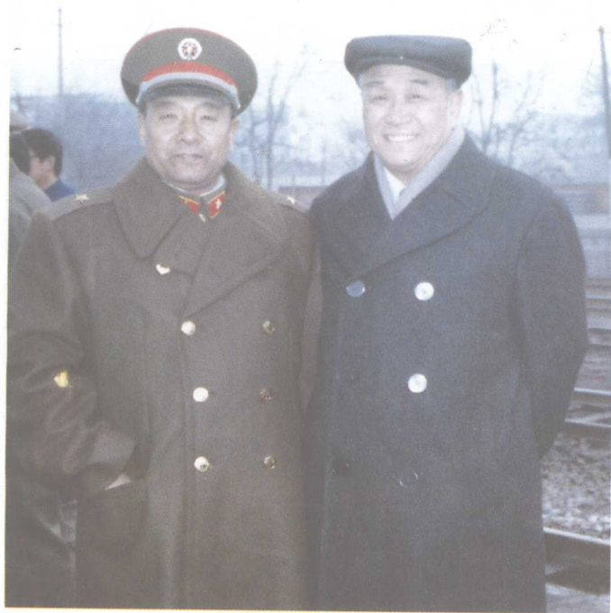
省长张曙光（右）举双手赞成建设民兵训练基地。