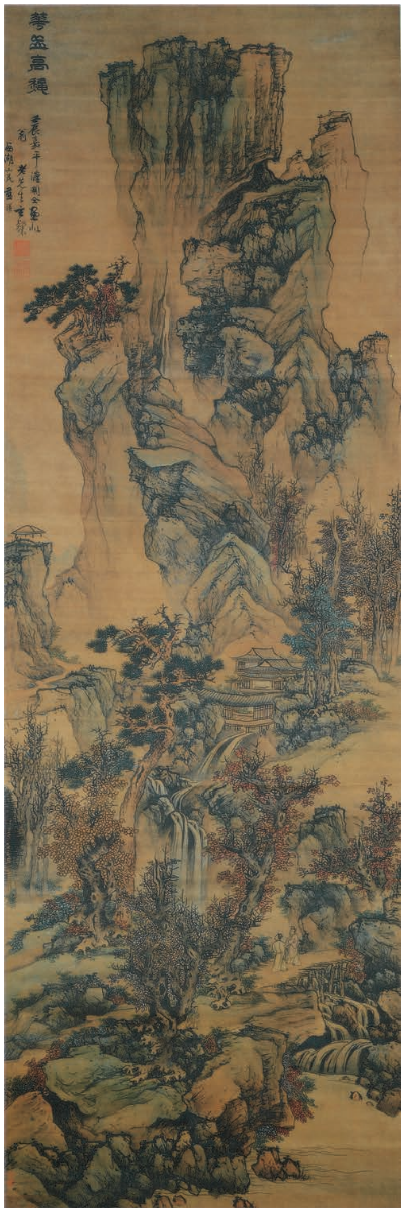
蓝瑛 华岳高秋图轴 明