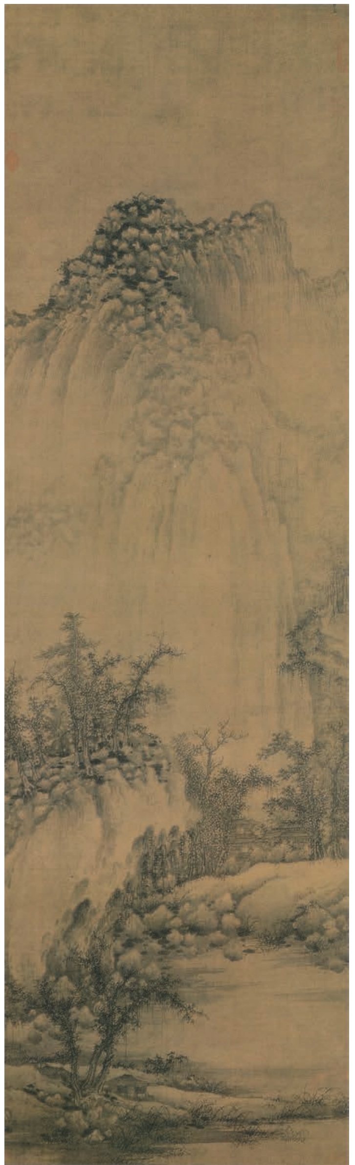
巨然 溪山兰若图轴 五代