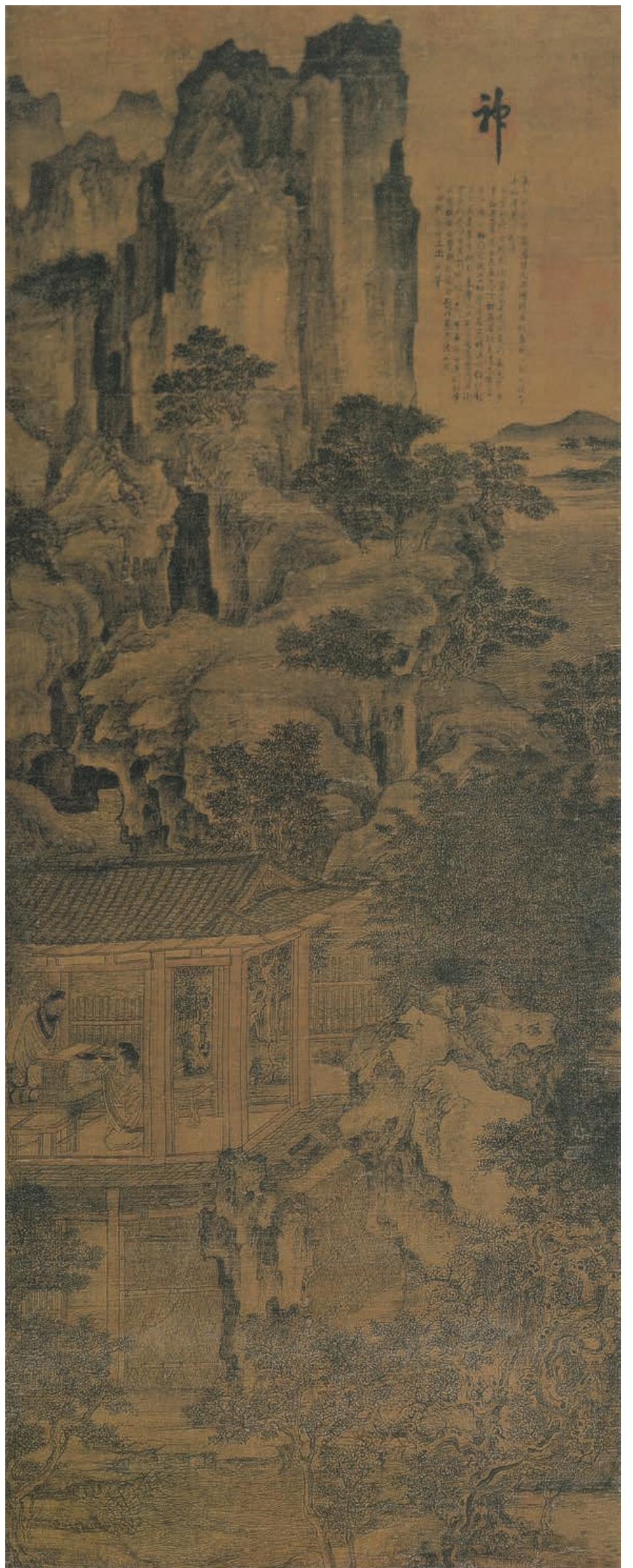
卫贤 高士图轴 五代