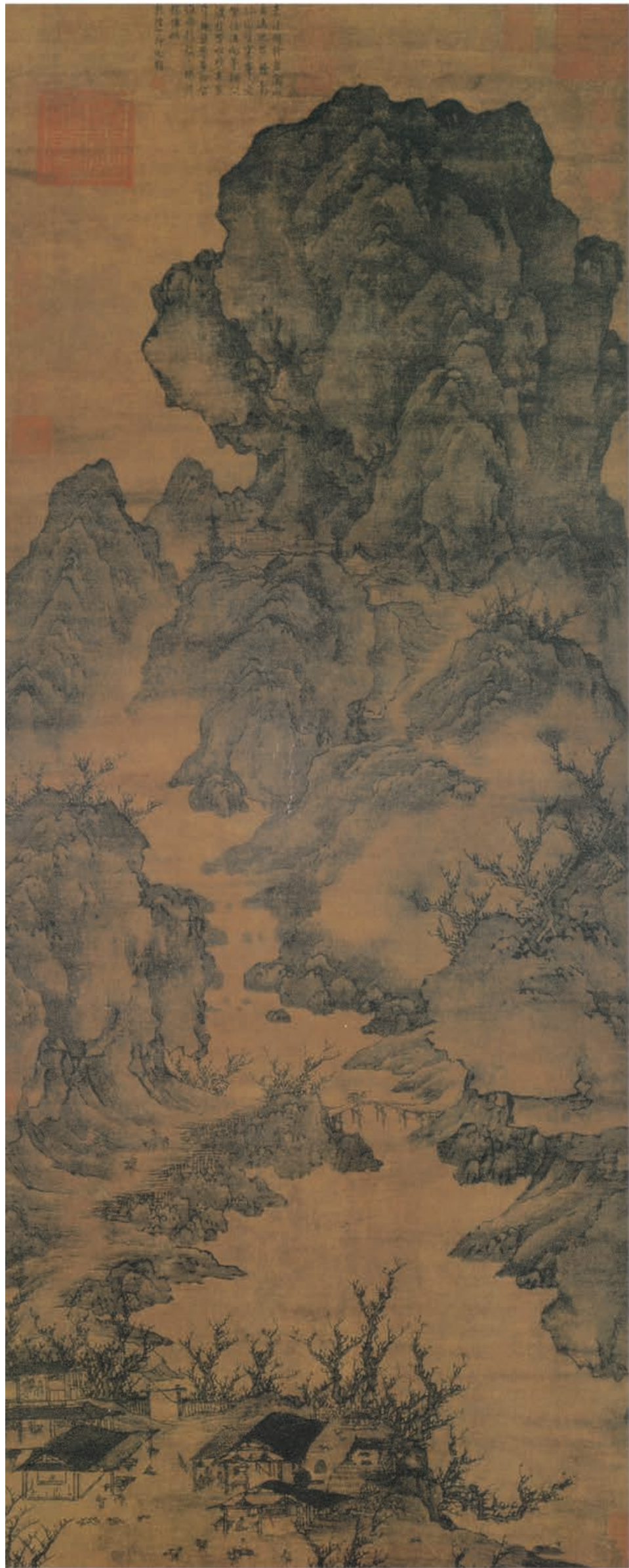
关仝 关山行旅图轴 五代