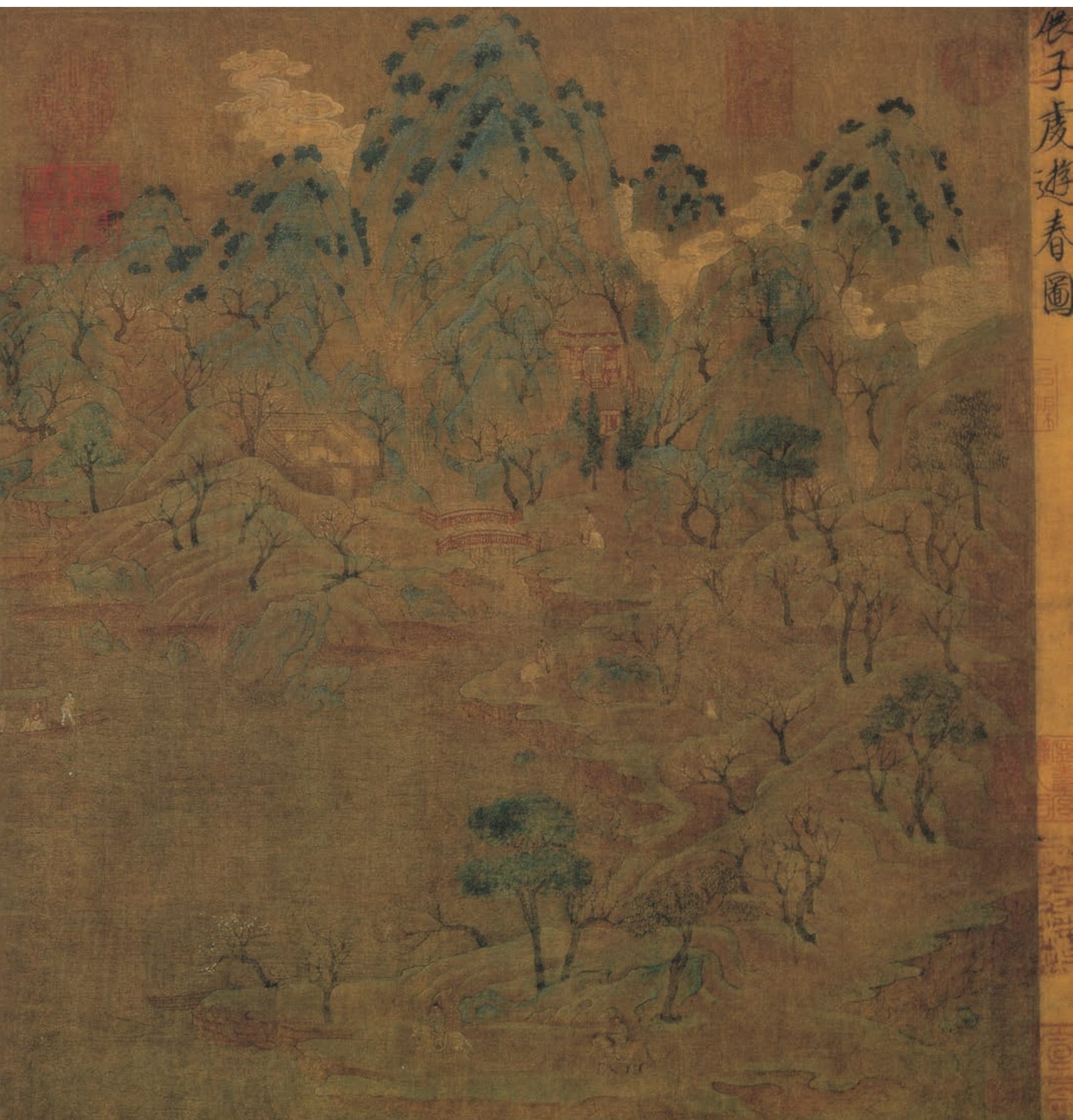
展子虔 游春图卷 隋