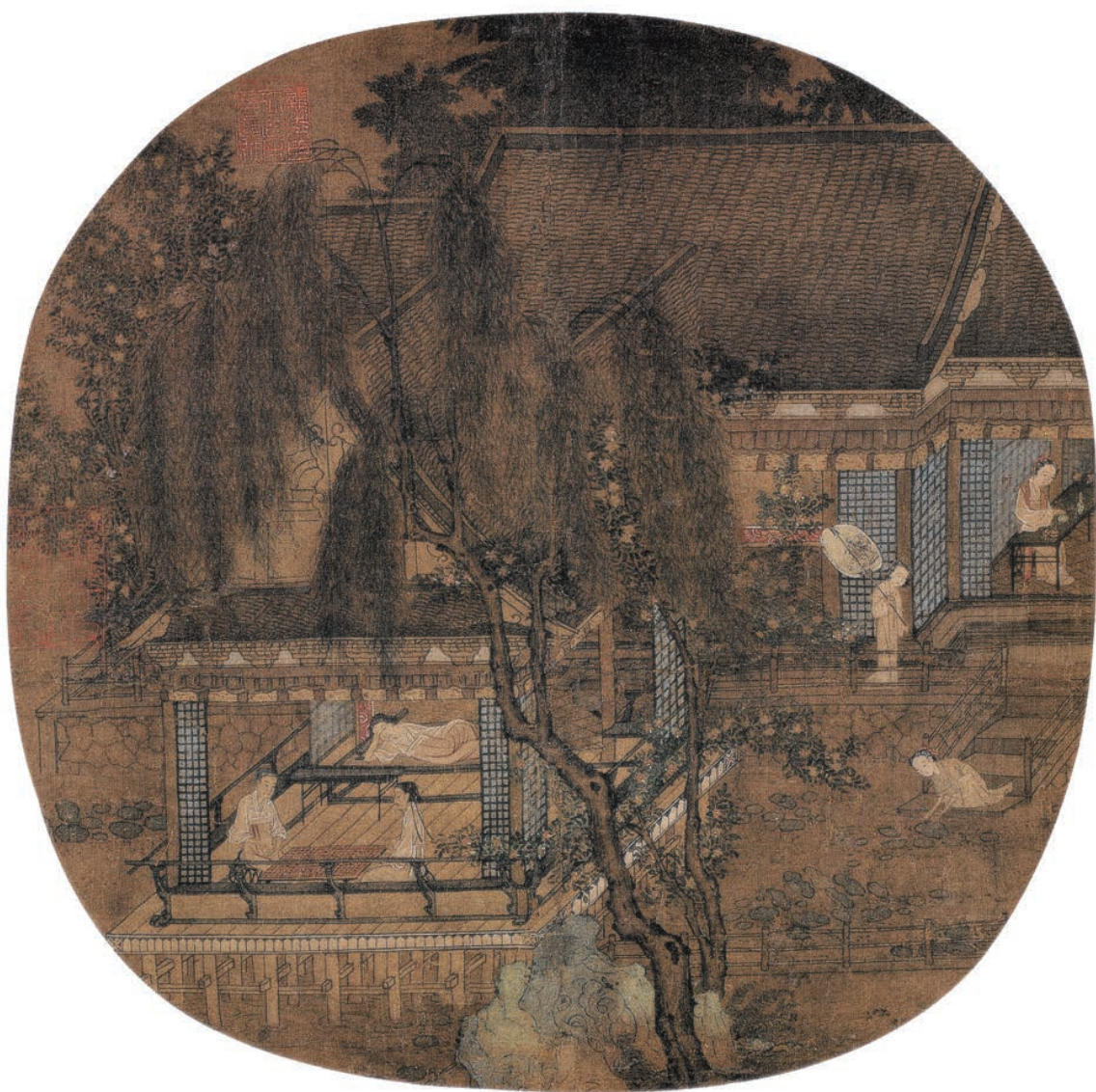
无款 荷亭对弈图页 南宋