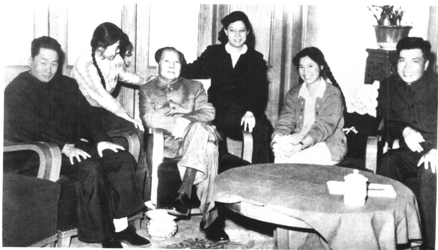
1962年春，毛泽东同毛岸青、张少林、刘松林、邵华、杨茂之（从左至右）在中南海住地。