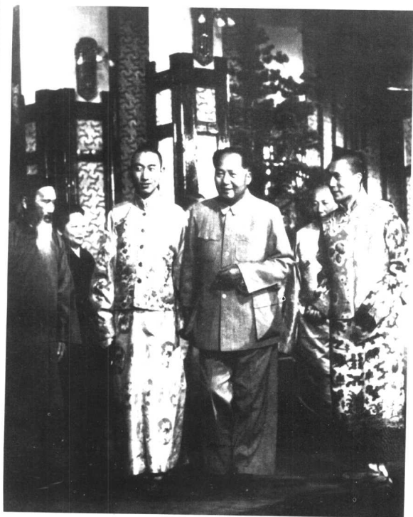
1954年9月21日，毛泽东在中南海接见出席第一届全国人民代表大会第一次会议的西藏自治区代表达赖喇嘛丹增嘉措（右）和班禅额尔德尼确吉坚赞。