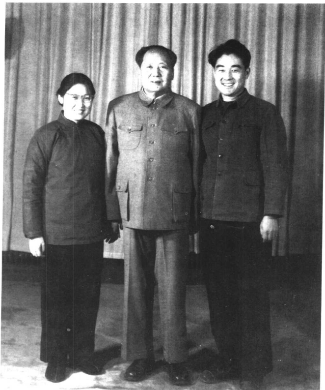
1963年12月26日，毛泽东同李敏、女婿孔令华在中南海住地合影。