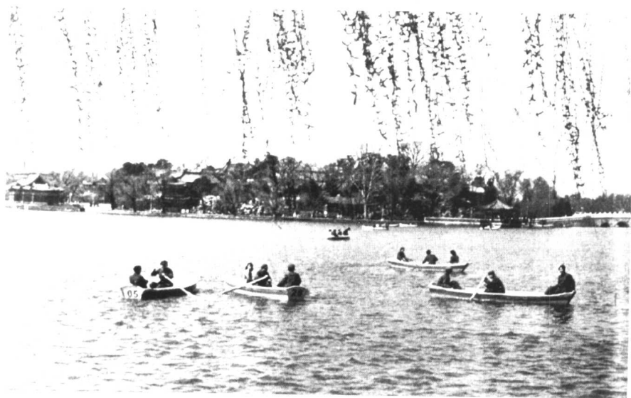
中南海碧波荡轻舟。