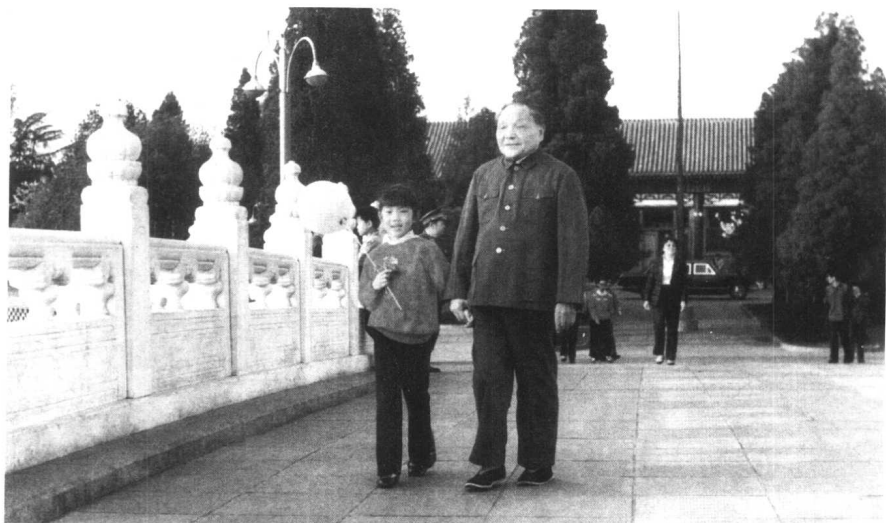
邓小平乐观开朗。粉碎“四人帮”之后，他肩负重任，更加注意锻炼身体了。这是他1986年在中南海散步。