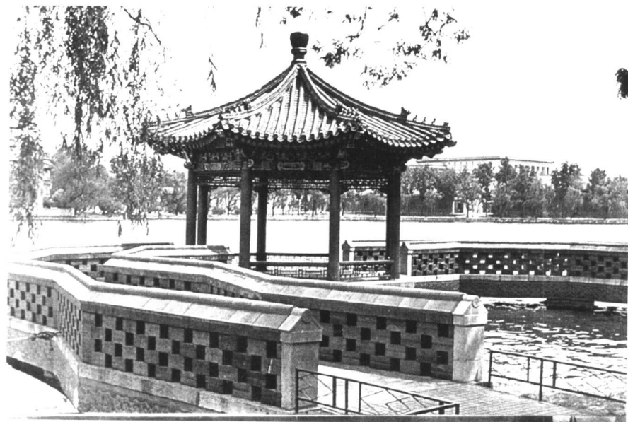
瀛台物鱼亭是一座小巧的水中亭，两边通过五曲石桥与瀛台相连。