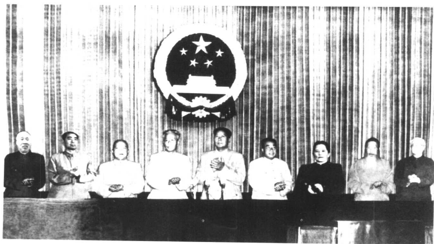
左起：董必武、周恩来、李济深、刘少奇、毛泽东、朱德、宋庆龄、张澜、林伯渠在第一次全国人民代表大会主席台上。