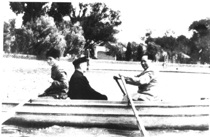
50年代初，毛泽东和民主人士程潜在中南海泛舟。