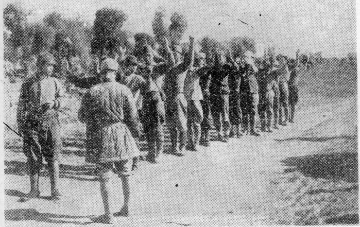
日军举手投降 1945年