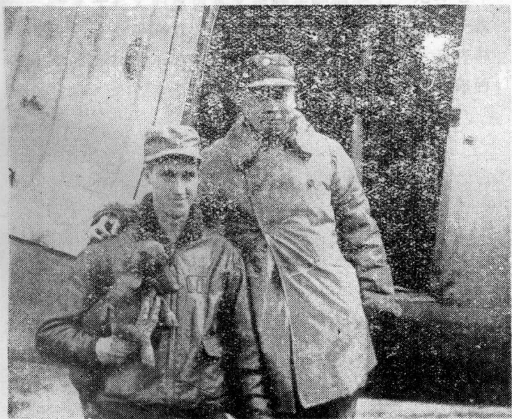
陈毅由济南返回临沂，同美国空军驾驶员合影。1946年