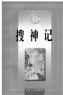
吉林人民出版社 出版的《搜神记》

《搜神记》是一部古代的民间传说,是部古代神话,也是古代民间传说的总汇,而有一部分是后来民间传说