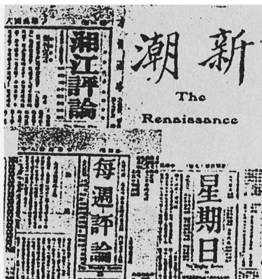
■ 朱德阅读过的部分进步杂志。