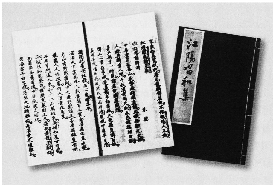
■ 朱德所著《拟杜甫诸将诗》5首。