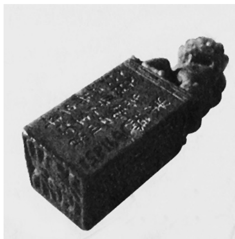
■ 朱德早年的藏书印。