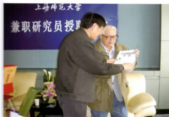
陶城受聘上海师范大学陶行知研究中心兼职研究员