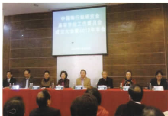
中国陶行知研究会高等学校工作委员会成立大会