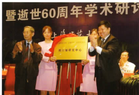
上海师范大学陶行知研究中心揭牌仪式