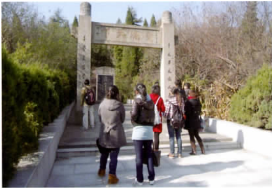
上海师范大学学生拜谒陶行知墓