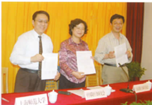
上海师范大学、中国陶行知研究会、上海市陶行知研究协会共建陶行知研究中心签约仪式