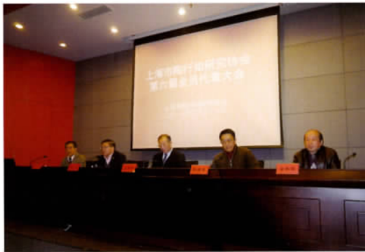
上海市陶行知研究会第六届会员代表大会