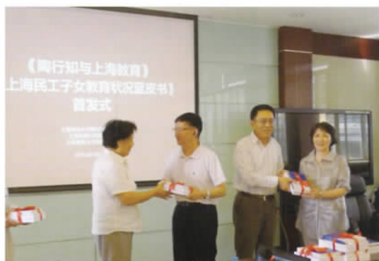
《陶行知与上海教育》《上海民工子女教育状况蓝皮书》首发式