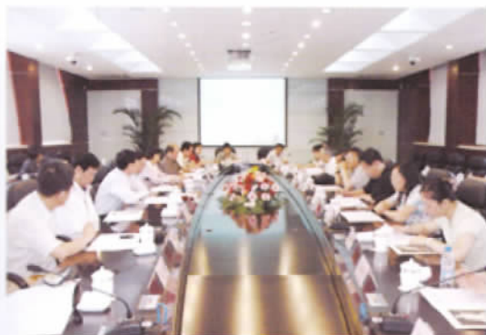
全国高等学校陶行知研究所(中心)第一次联席会议 2007年6月在上海师范大学举行