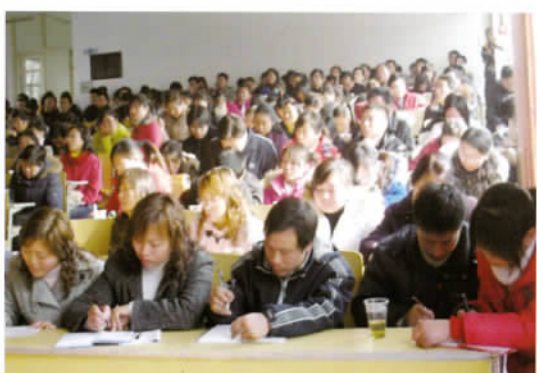
上海师范大学陶行知研究中心举办民工子女学校教师培训班