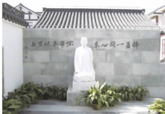
上海市陶行知纪念馆内陶行知塑像