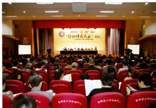
上海市陶行知研究会、江苏省陶行知研究会、浙江省陶行知研究会联合主办，崇明县教育局承办的第二届“长三角”地区“行知伴我成长”论坛开幕