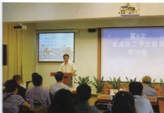
第六次全国民工子女教育研讨会在上海师范大学召开