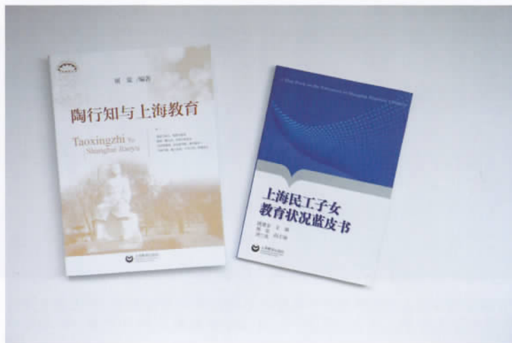
上海师范大学陶行知研究中心研究人员部分编著