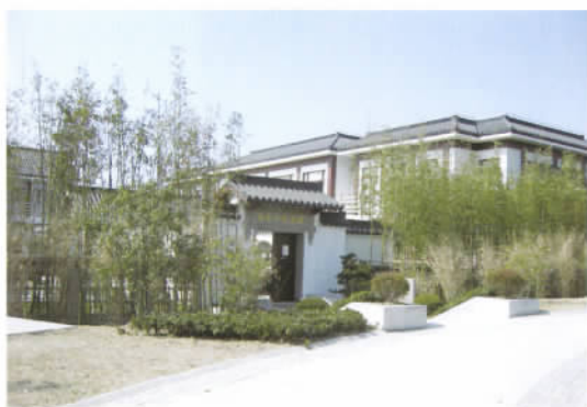
上海市陶行知纪念馆外景