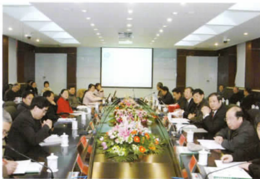
上海师范大学陶行知研究中心成立