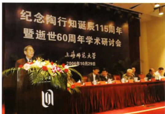
上海师范大学举行纪念陶行知诞辰115周年暨逝世60周年学术研讨会