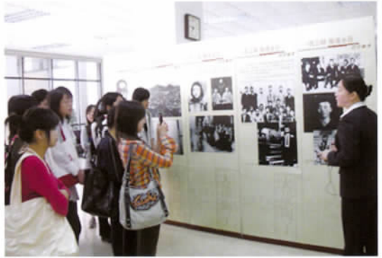
上海师范大学学生参观陶行知事迹巡回展