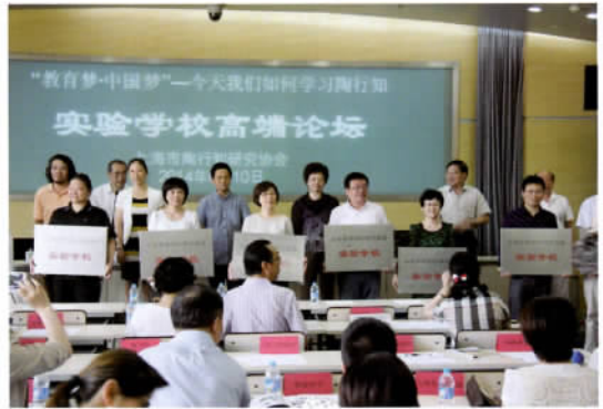
“上海市陶行知研究会实验学校”授牌，“上海市陶行知研究会实验学校联盟”成立