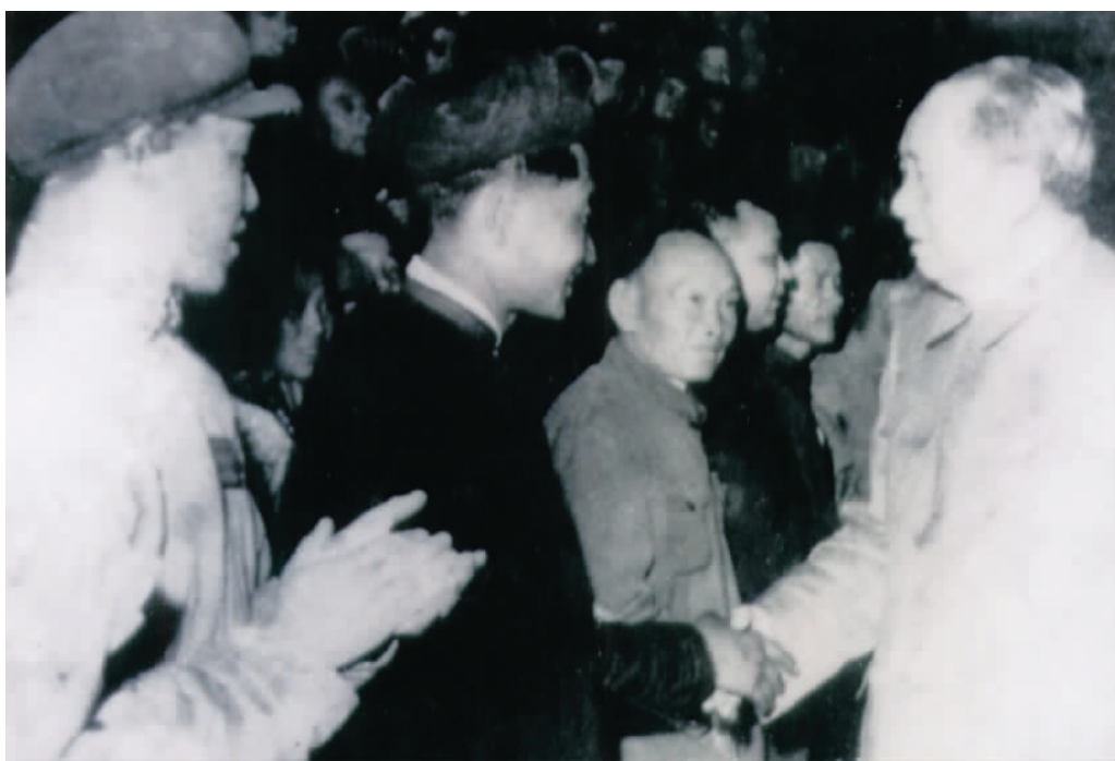
1964年10月1日,毛泽东主席在北京接见少数民族代表团时与 江西省贵溪县樟坪畲族乡首任乡长蓝启明亲切握手