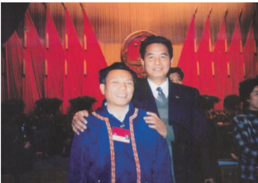
1988年3月第七届全国人民代表大会期间,时任江西省省长吴官正(右)与江西省贵溪市樟坪畲族乡党委书记雷长生在人民大会堂合影