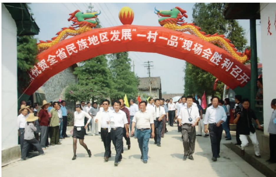
2009年10月,江西省少数民族地区发展“一村一品”现场会与参会人员 参观吉安市青原区东固畲族乡