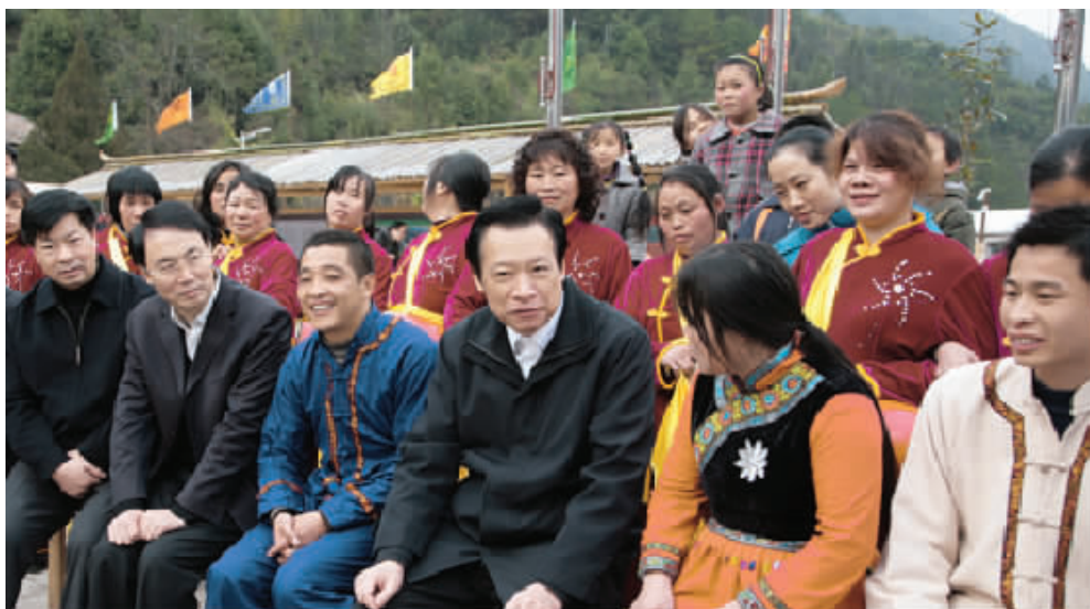
2010年1月,江西省省长吴新雄(前排右三)视察上饶市铅山县 太源畲族乡时与当地畲族群众合影