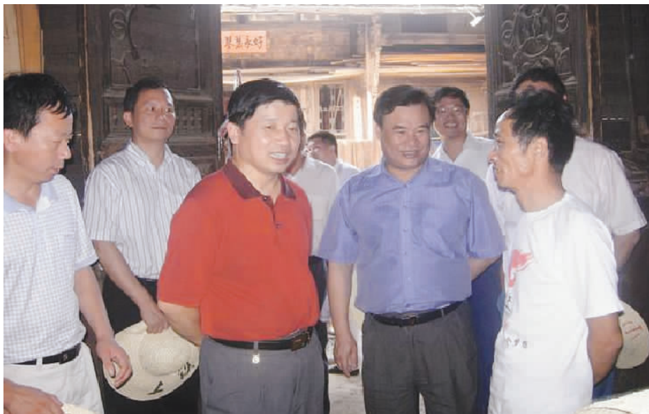
2008年7月,江西省副省长熊盛文(左三)走访上饶市铅山县畲族群众家庭