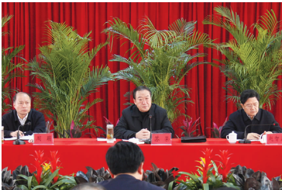
2010年1月,中共江西省委书记苏荣(中)在吉安市青原区东固畲族乡召开座谈会