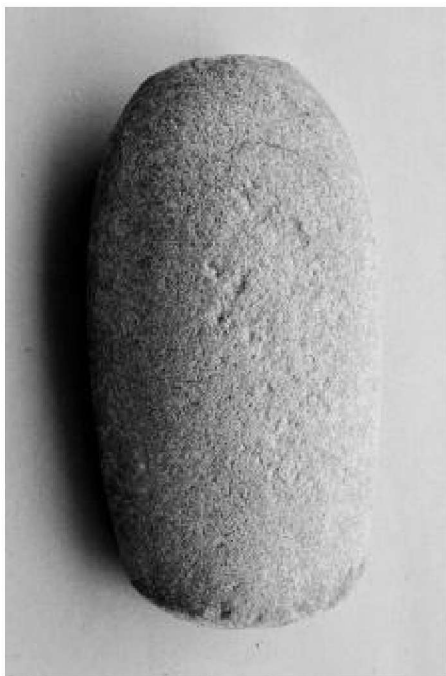
图 3 石杵正面

学界普遍认为,卡约文化是青海高原上齐家文化之后的一种青铜时代史前文化。所处年代据 ^{14}\text{C} 测定,