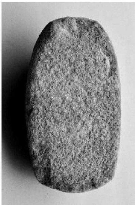
图 4 石杵另一面