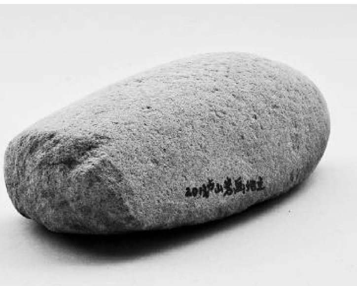
图1 青海卢山岩画地点发现的研磨器(石杵)