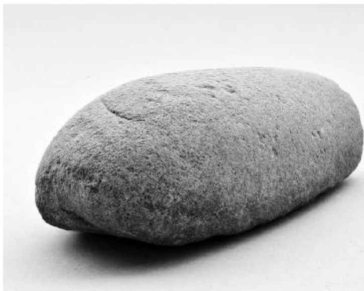
图2 石器另一端(上端、背面)