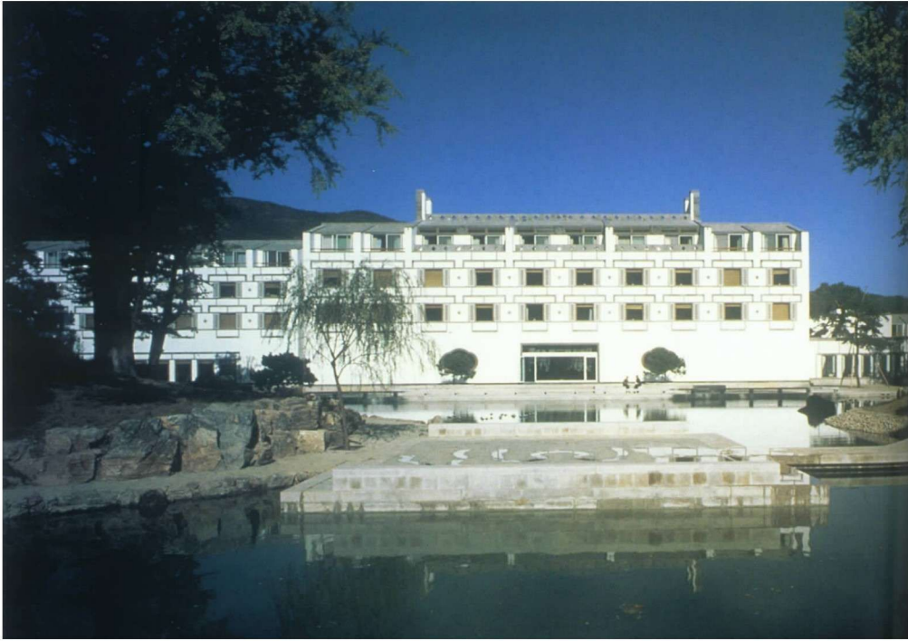
彩图 1 北京香山饭店 (贝聿铭, 1982 年)