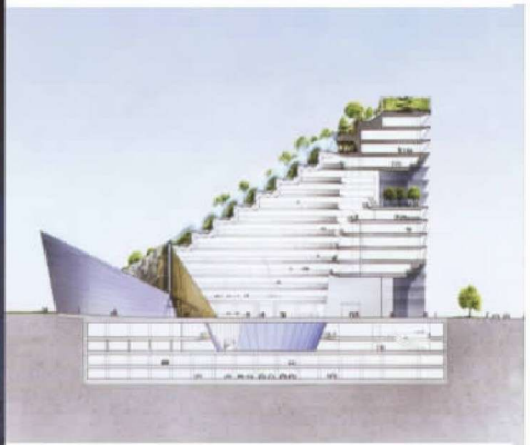
彩图 18 福冈县国际大厦 (E.阿姆伯兹)