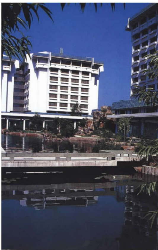
彩图 4 杭州黄龙饭店 (程泰宁, 1986 年)