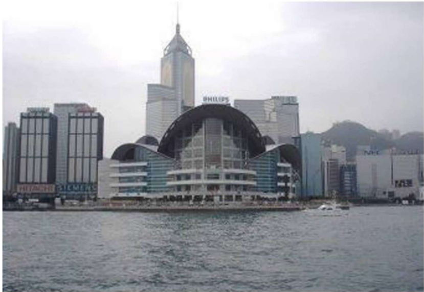
彩图 7 香港国际会展中心 (王欧阳设计事务所, 1987 年)