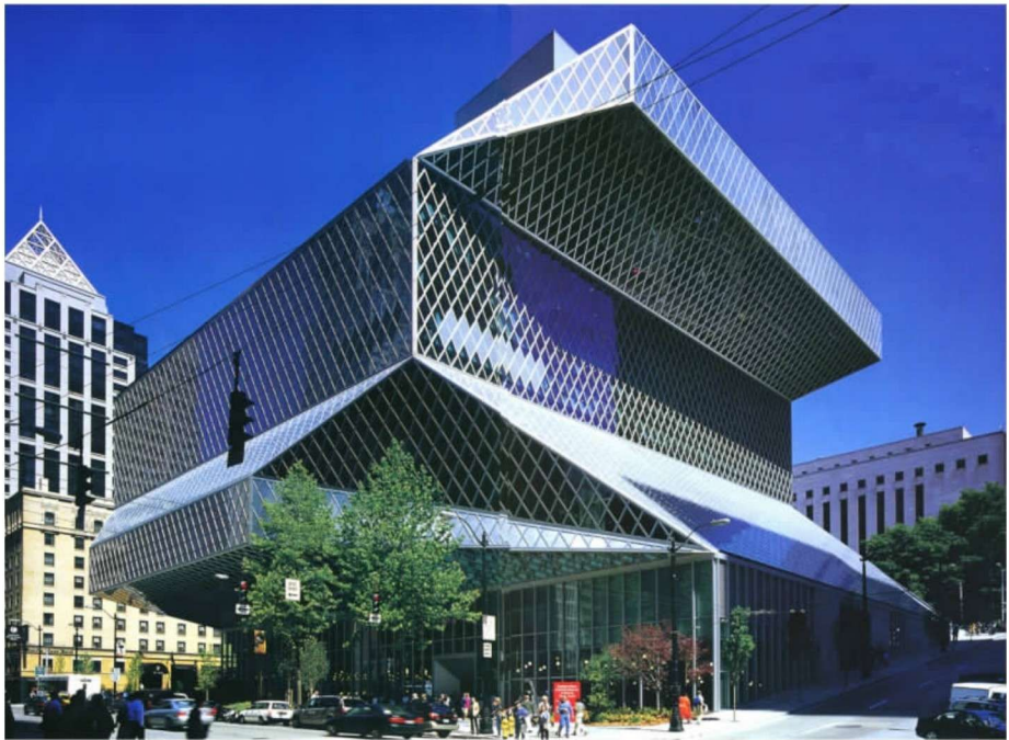
彩图 26 西雅图中心图书馆 (R.库哈斯,2004年)