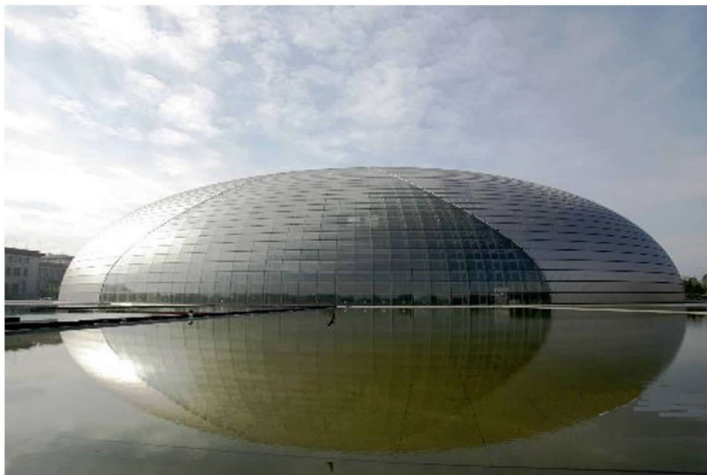
彩图 15 北京国家大剧院 (法国,P.安德鲁,2007年)