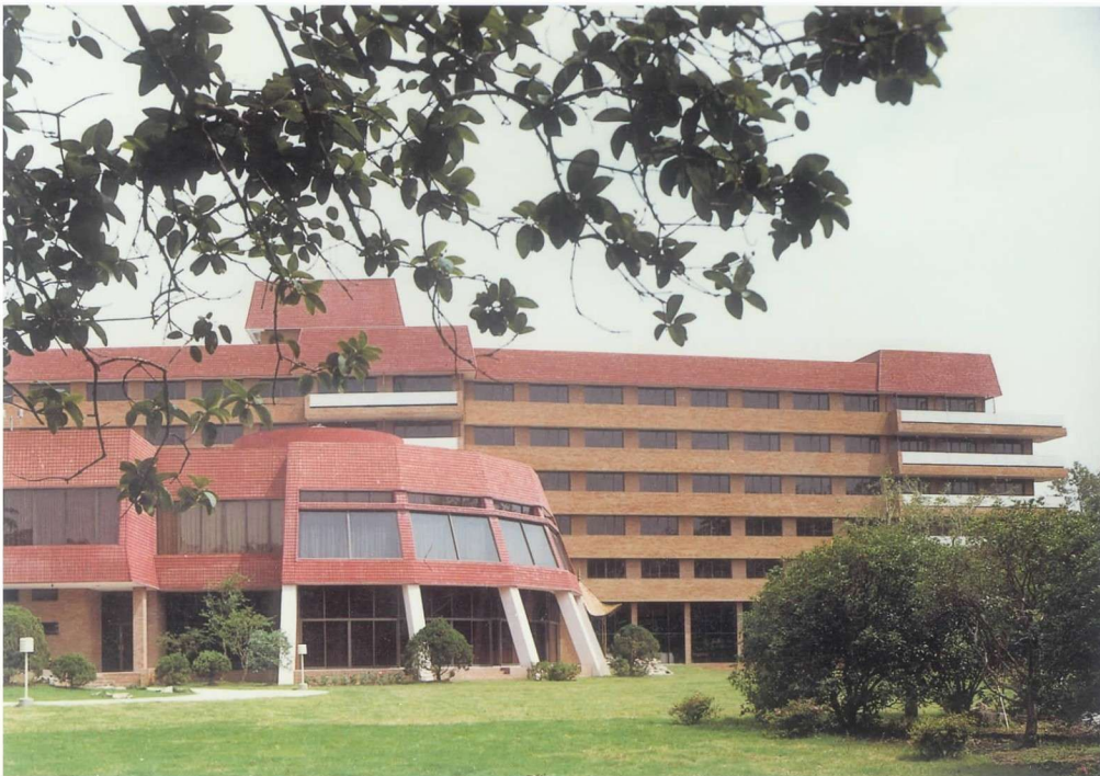
彩图 2 上海龙柏饭店 (张耀曾, 1982 年)