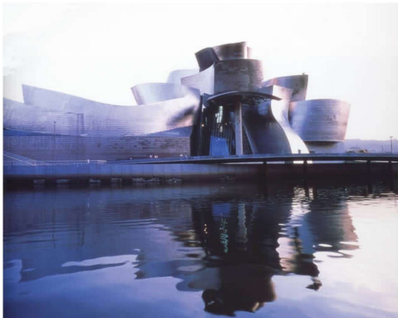
彩图 22 西班牙毕尔巴鄂古根海姆博物馆 (盖里,1997年)