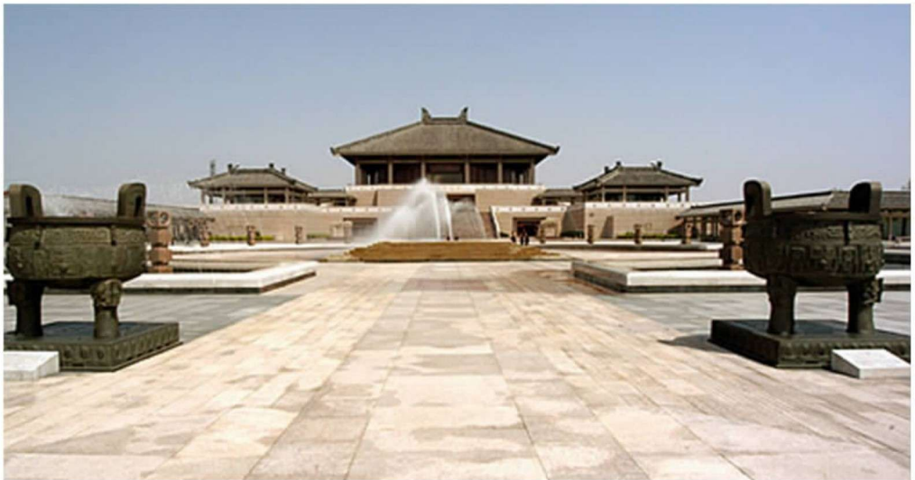
彩图 12 曲阜孔子研究院 (吴良镛,1998年)