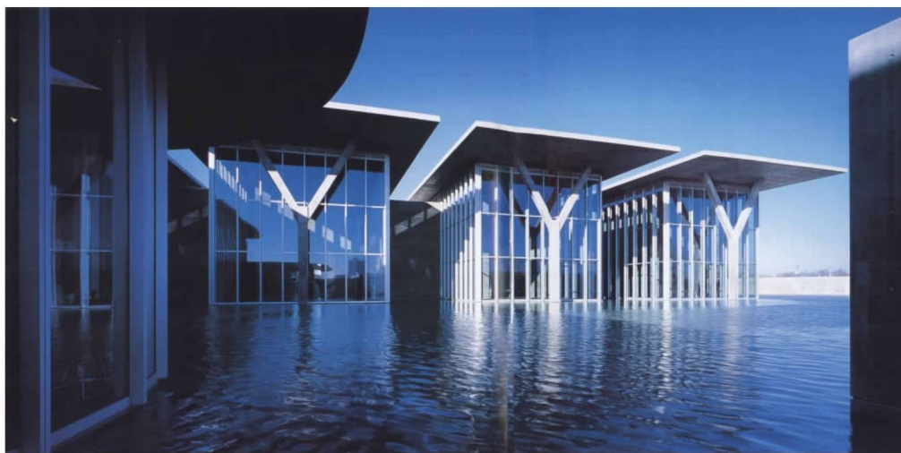
彩图 24 现代艺术博物馆(美) (日本,安藤忠雄)