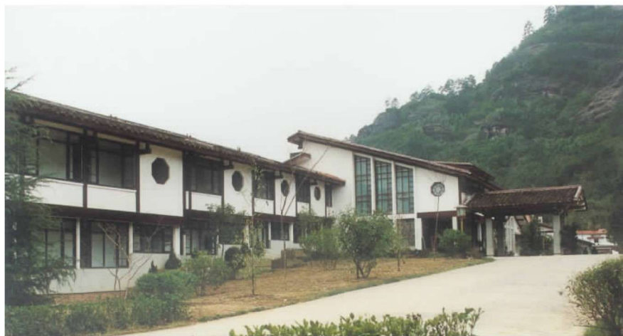
彩图 3 武夷山庄 (齐康, 1983 年)