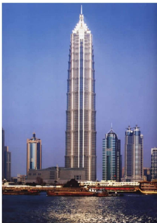
彩图 14 上海金茂大厦 (S.O.M 设计事务所, 1998 年)