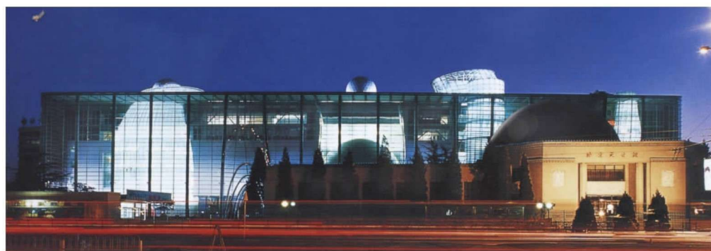
彩图 16 北京天文馆新馆 (王弄极,2004年)