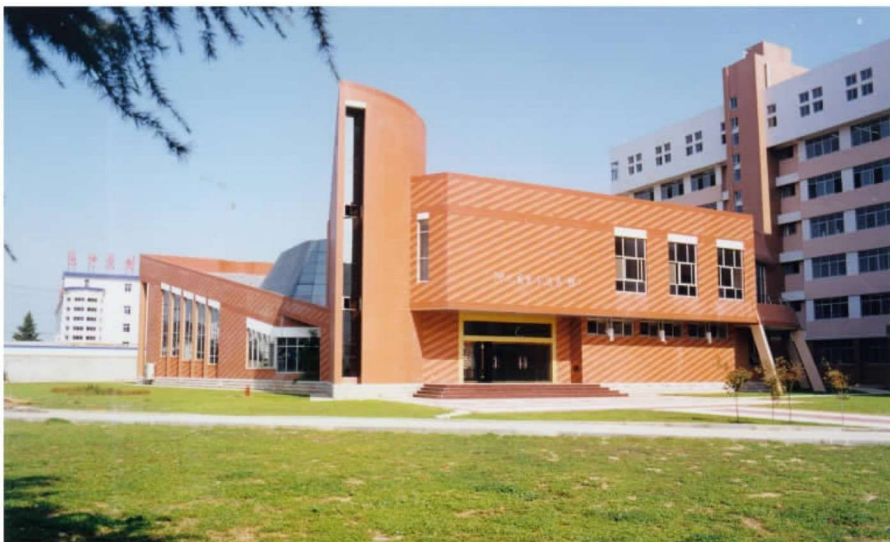
彩图 13 南阳理工学院国际会馆 (顾馥保, 2001 年)