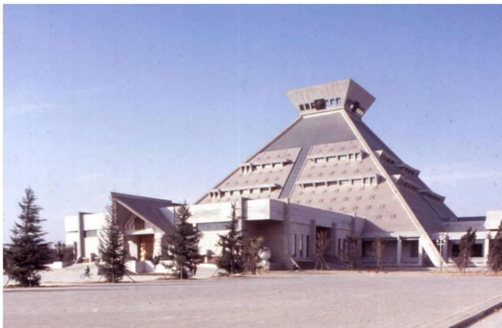
彩图 9 河南博物院 (齐康,1998年)