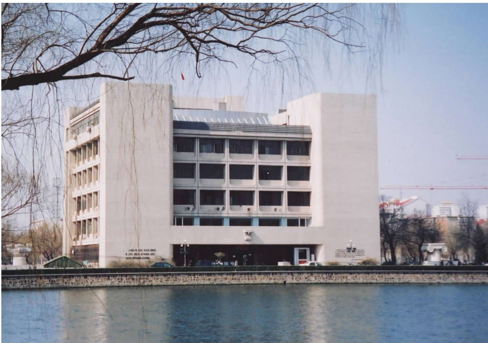
彩图 6 天津大学建筑学院 (彭一刚, 1988 年)