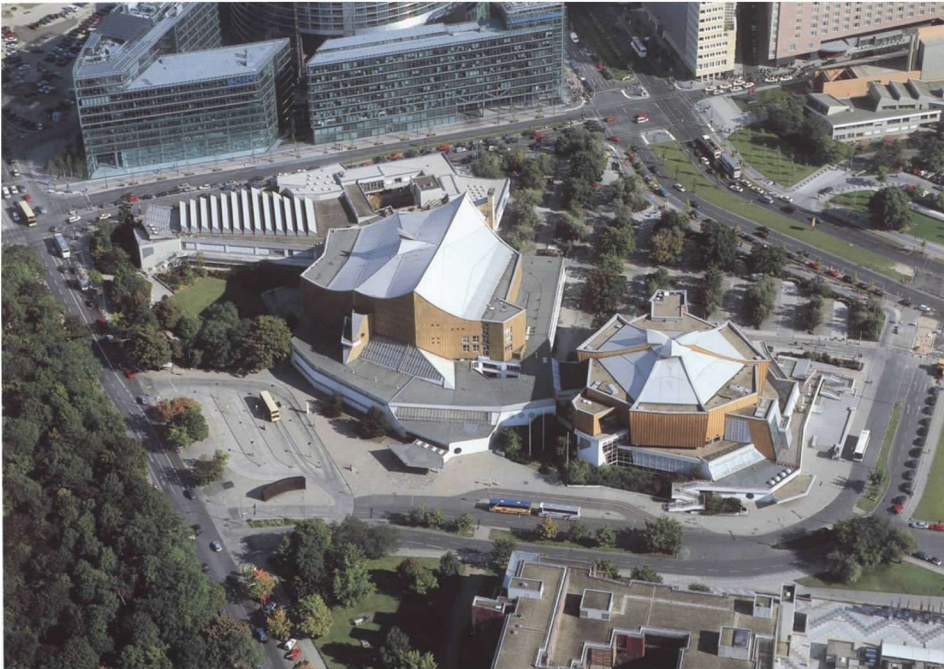
彩图 20 柏林音乐厅 (夏隆,1963年)