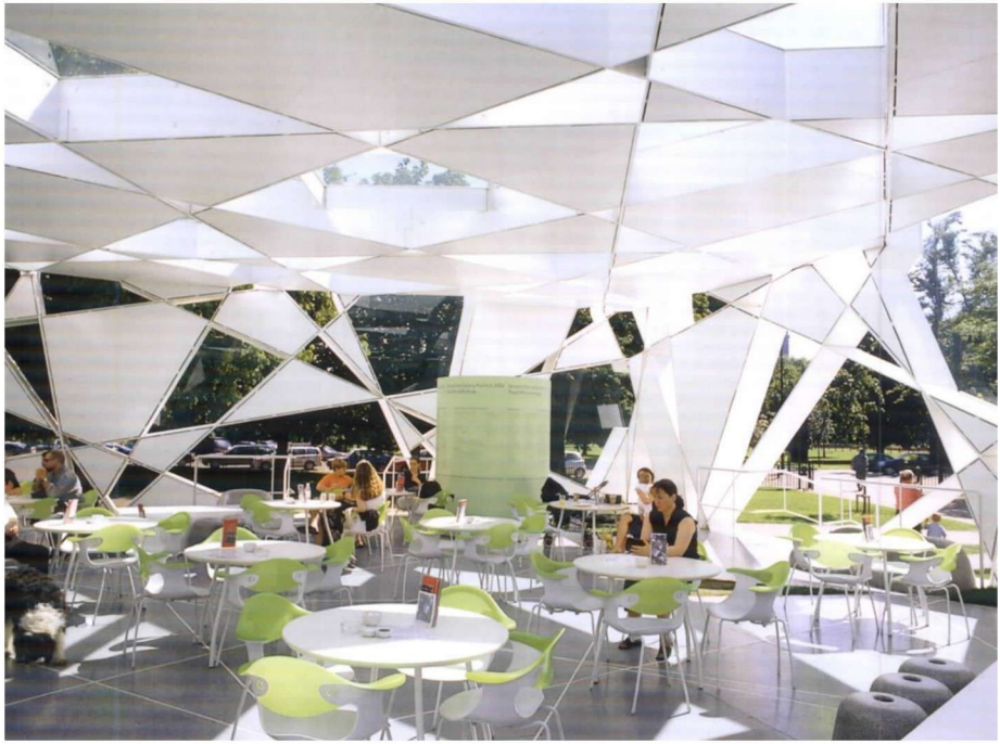
彩图 25 伦敦蛇形画廊内景 (日本,伊东丰雄,2002年)