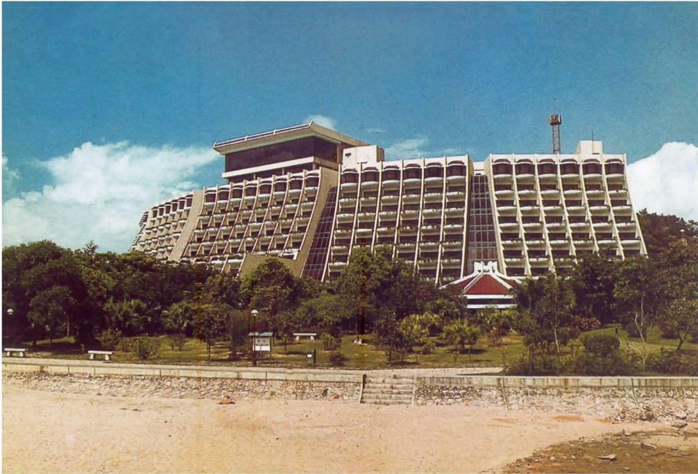
彩图 5 深圳南海酒店 (陈世民, 1986 年)