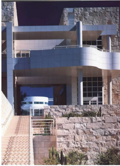
彩图 19 盖蒂中心 (R.迈耶,1998年)