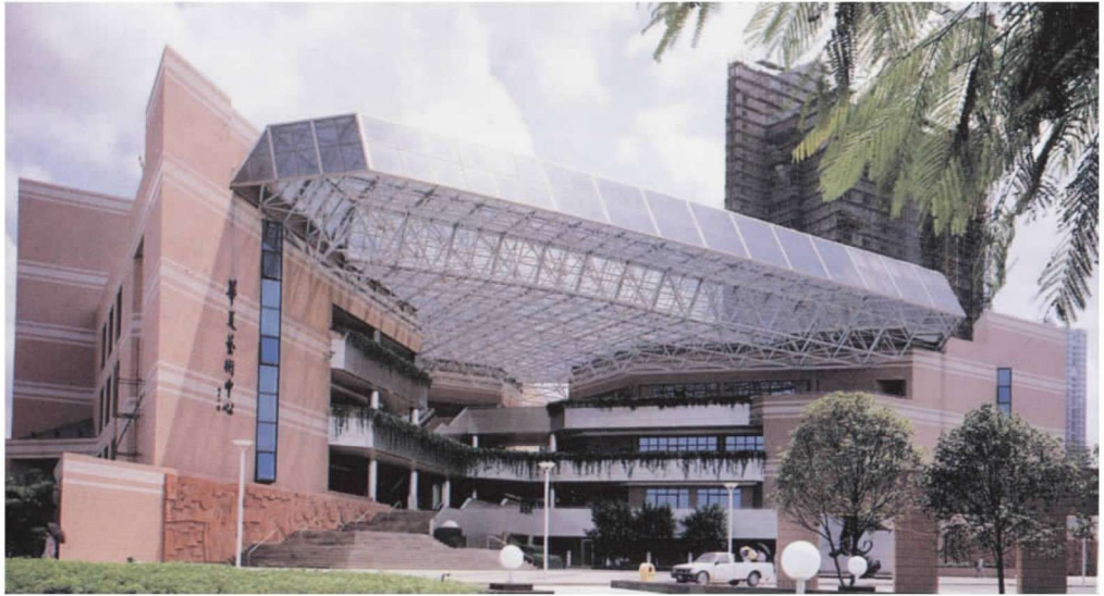
彩图 11 深圳华夏艺术中心 (张孚佩,1990年)