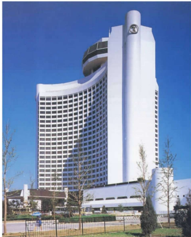
彩图 8 北京国际饭店 (林乐义, 1988 年)