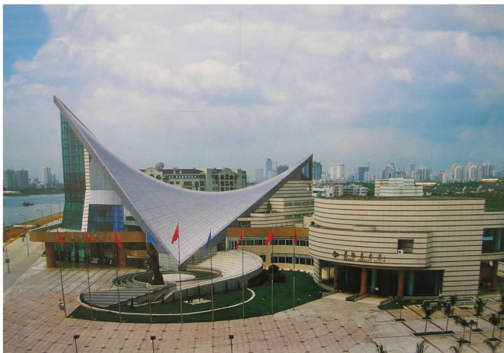
彩图 10 广州星海音乐厅 (林永祥,1995年)