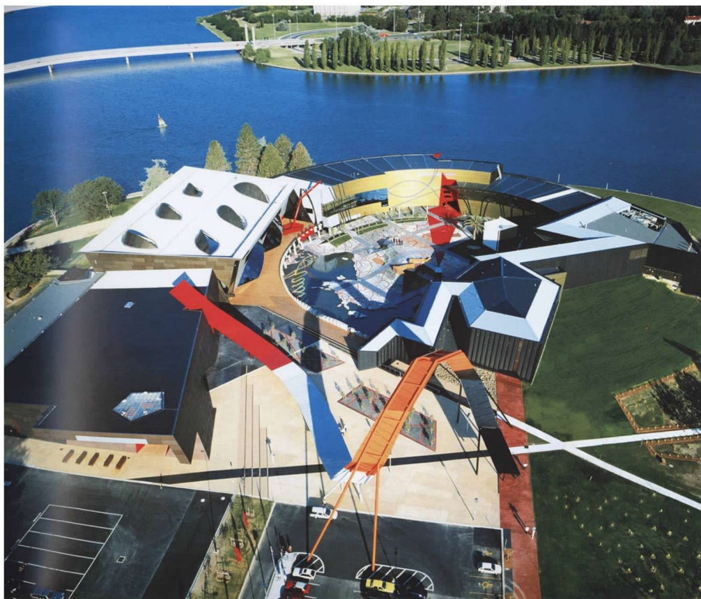
彩图 23 澳大利亚国家博物馆 (阿什顿-拉盖特-麦克道戈尔事务所)