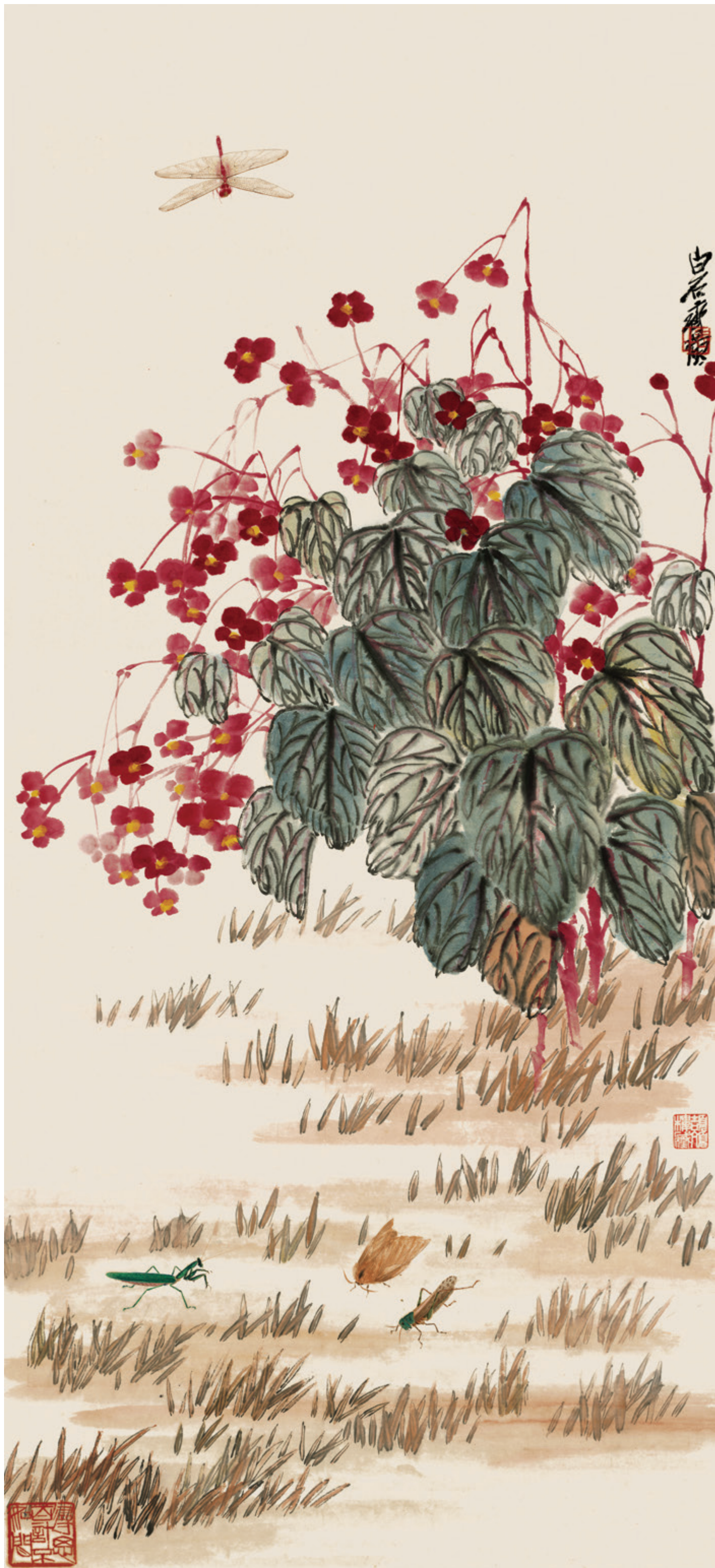
海棠秋声 纸本 设色 51cm x 112cm