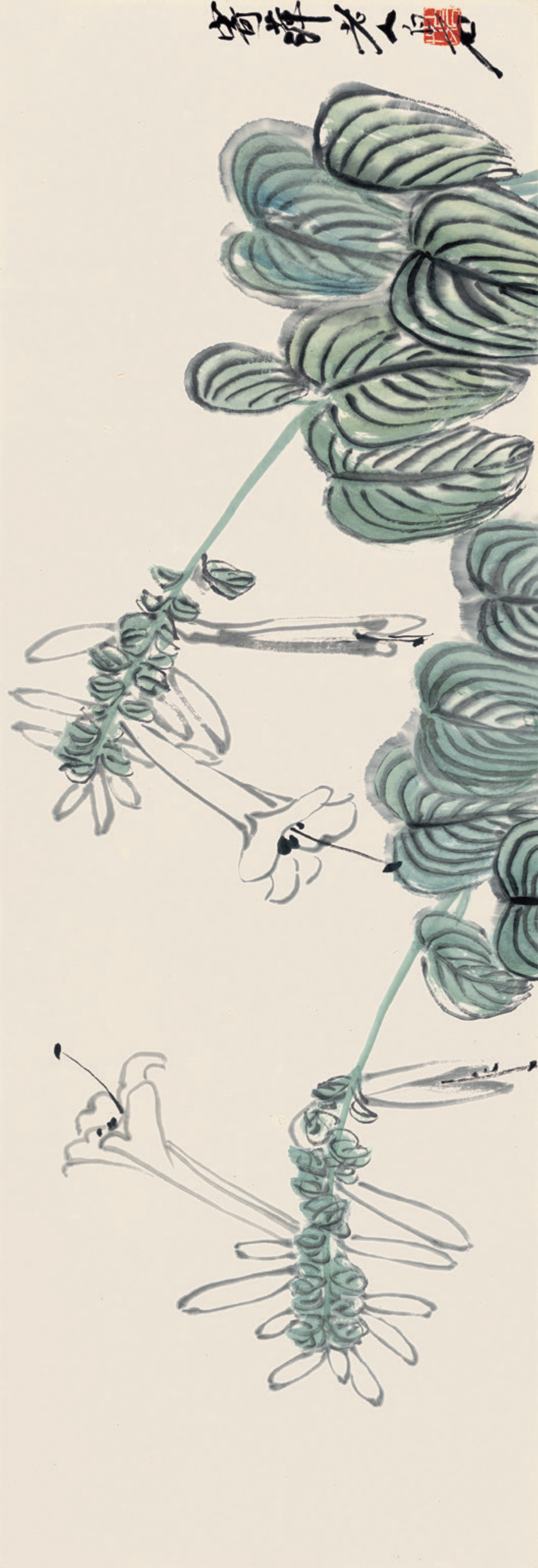
玉簪花 纸本 设色 150cm x 44cm