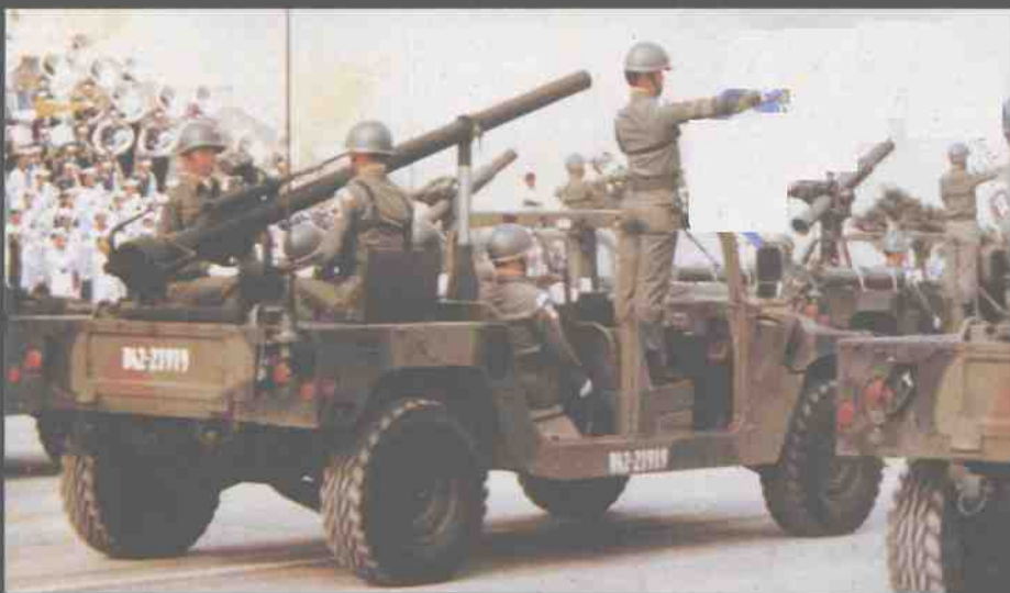
台湾陆军装备106 无后座力炮的吉普车