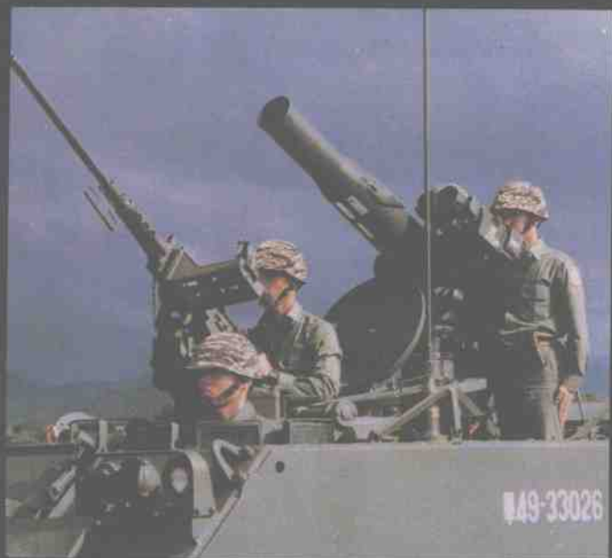
台湾陆军反装甲导弹发射车