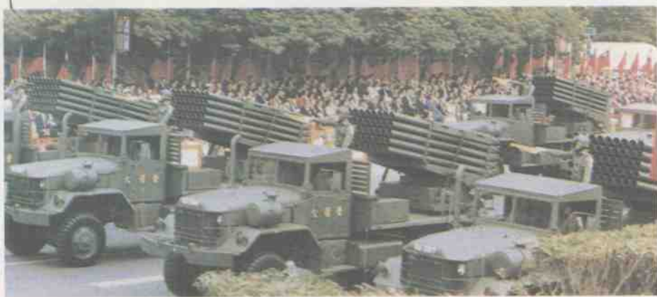
台湾陆军多管火箭炮