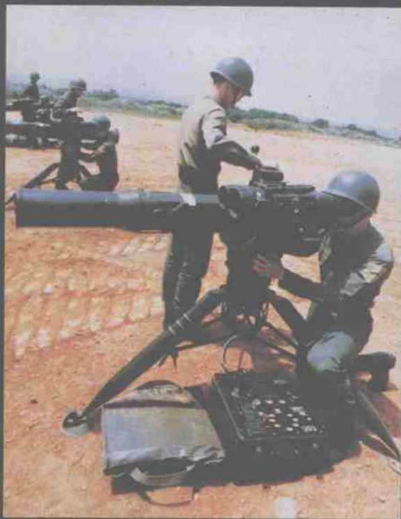
台湾陆军陶式反装甲导弹