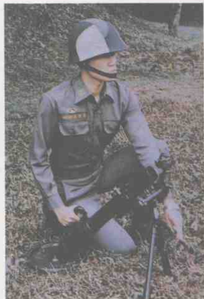
台湾陆军75式60毫米迫击炮