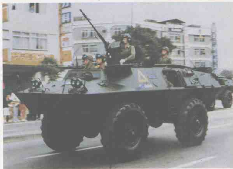
台湾陆军V150 轮式装甲车