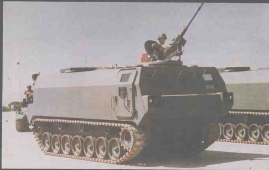
台湾陆军M24 装甲弹药运输车

M24装甲弹药运输车是台湾当局在M21步兵战斗车的基础上，自行研制的车辆。该车弹药室可储放203毫米榴弹炮弹42发，（或更多的155毫米炮弹）和所需的推进药包。