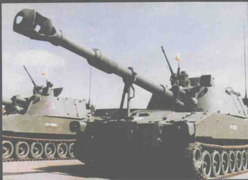
台湾陆军M109式 155毫米自行榴弹炮