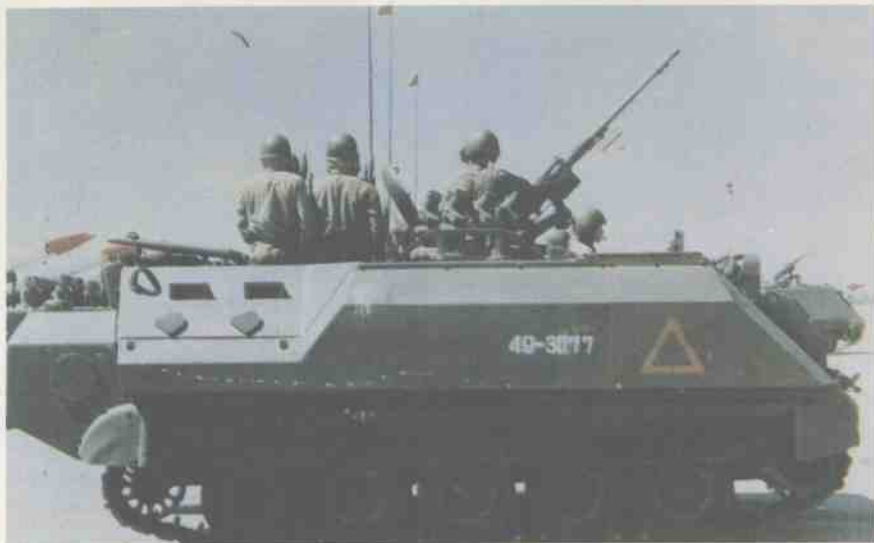
台湾陆军M25陶式 反装甲导弹发射车

M21装甲步兵战斗车为台湾自行研制，基本上是根据美国M113装甲运输车仿造生产的。