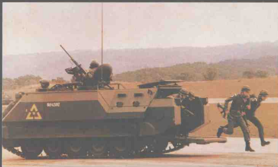
台湾陆军M21 装甲步兵战斗车