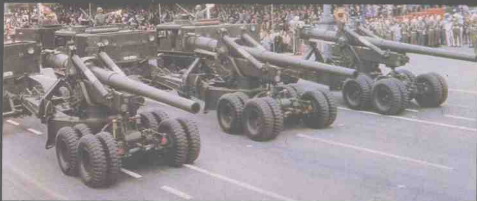
台湾陆军M59式155毫米牵引加农炮