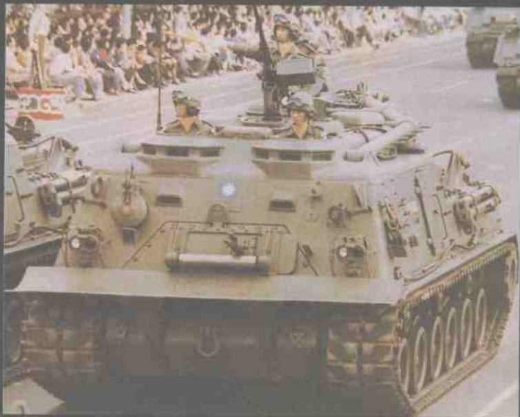
台湾陆军M88装甲抢修车

M24装甲弹药运输车是台湾当局在M21步兵战斗车的基础上，自行研制的车辆。该车弹药室可储放203毫米榴弹炮弹42发，（或更多的155毫米炮弹）和所需的推进药包。