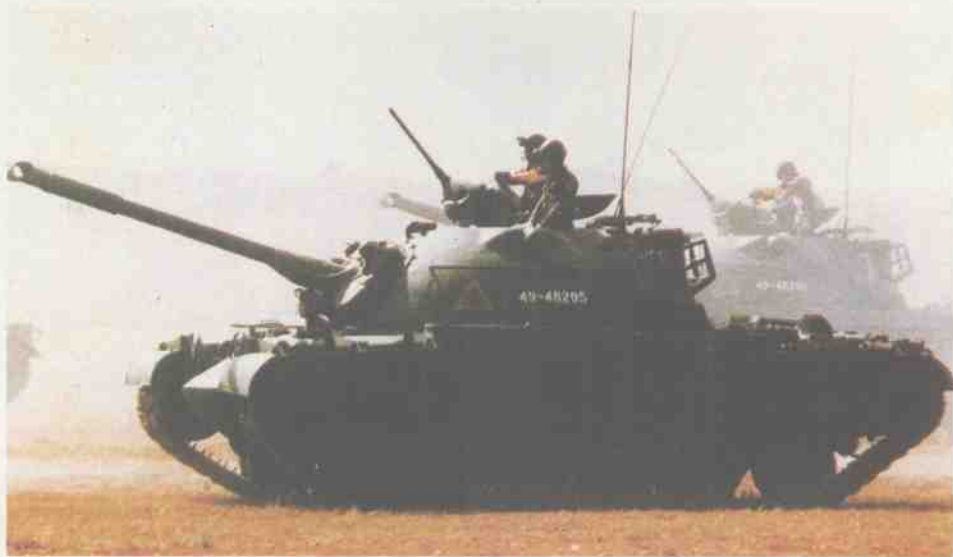
台湾陆军M48A 2 主战坦克