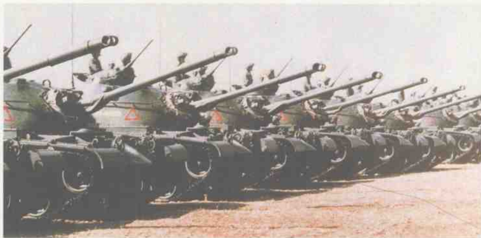
台湾陆军M48A 2 主战坦克