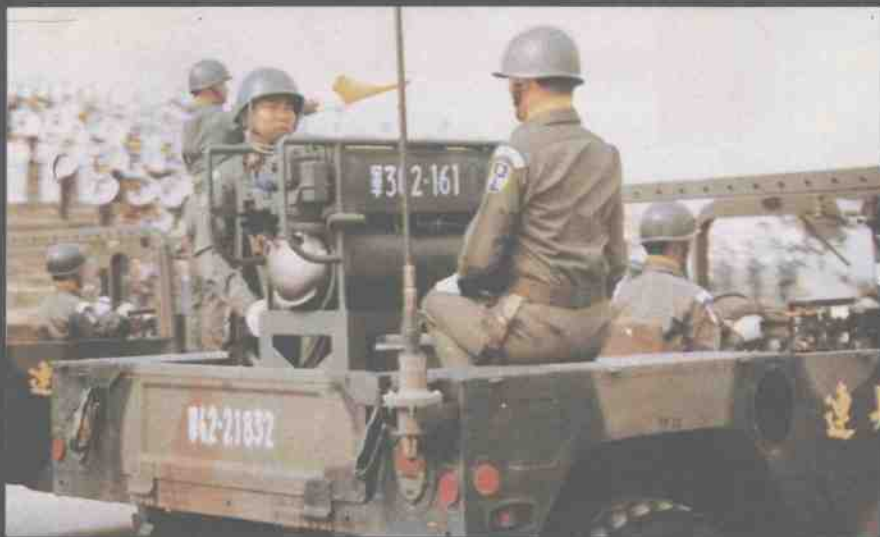
台湾陆军化学连装备 烟雾发射器的吉普车