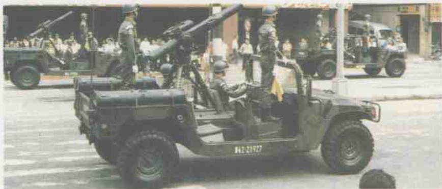
台湾装有陶式反装甲导弹的M98吉普车