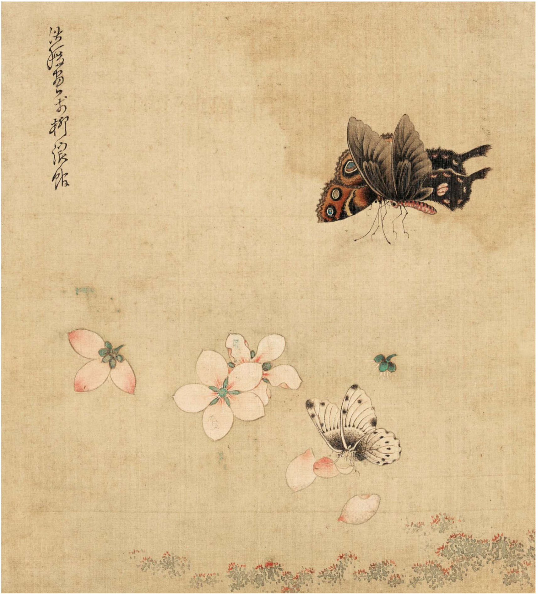
花鸟册 十开选七 之 花蝶图