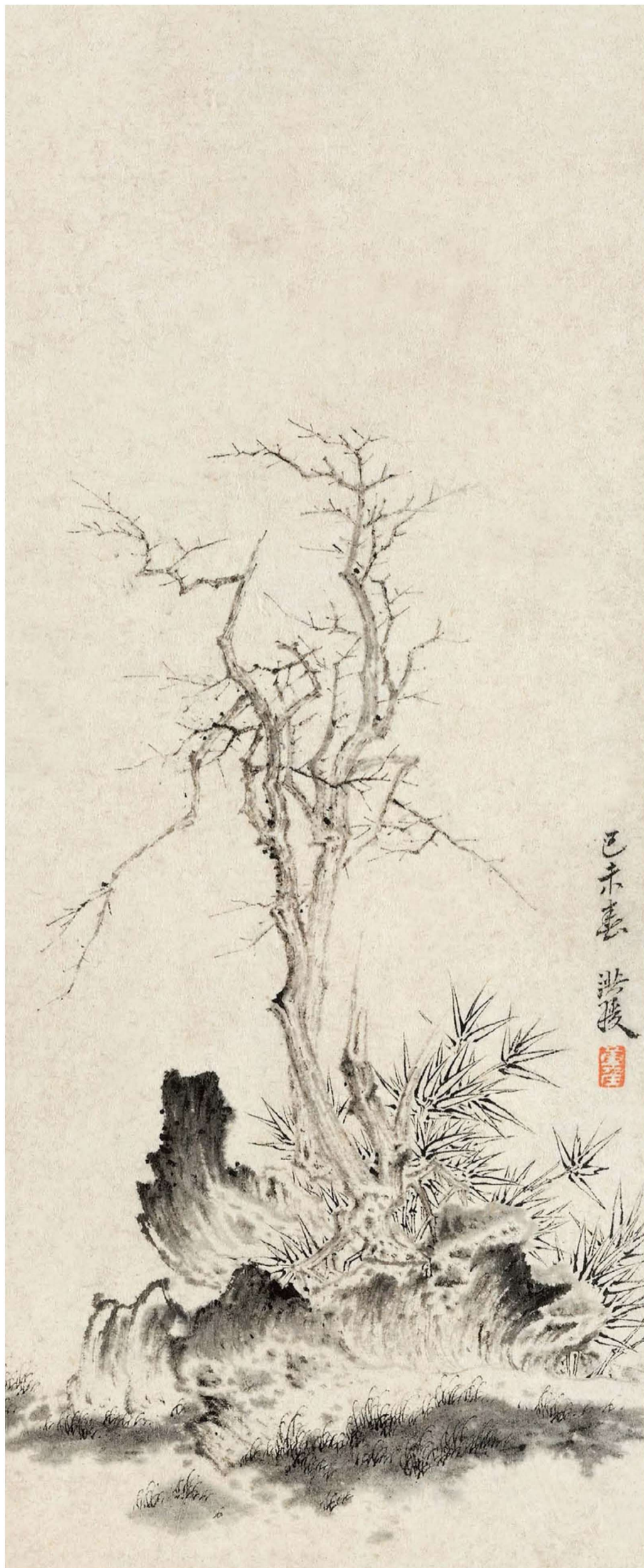
早年画册 十二开选三 纸本 设色/水墨 22.2cm × 9.2cm × 3 1618年—1622年 美国纽约大都会博物馆 藏 之 枯木竹石图 1619年 己未 万历四十七年