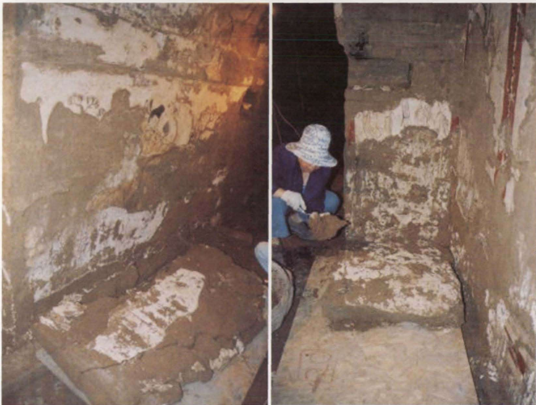
图3 陕西省富平县唐献陵陵园李邕墓壁画：地仗层酥软造成壁画大面积脱落，其损失无法弥补。 Fig. 3 The Tang Liyong tomb mural unearthed from Fuping county, Shaanxi: large areas lost due to disruption of plaster layer

墓室总长约 44.2 米，但绘制在墓道、甬道和墓室的壁画中有三分之二多遭到破坏，大面积脱落，残留壁画不足三分之一；又如 2004 年 3 月至 2004 年 9 月，在陕西富平县北吕村唐献陵陵园区内发掘的李邕墓，该墓南北方向全长 60 米，由长斜坡墓道、4 个过洞、5 个天井、6 个壁龛、前后砖券甬道及双墓室组成，壁画绘制在墓道、过洞、甬道和墓室的壁面上，但残留壁画不足一半（图 3），等等。因此，针对墓葬壁画的结构、所用材质的特性和保存状