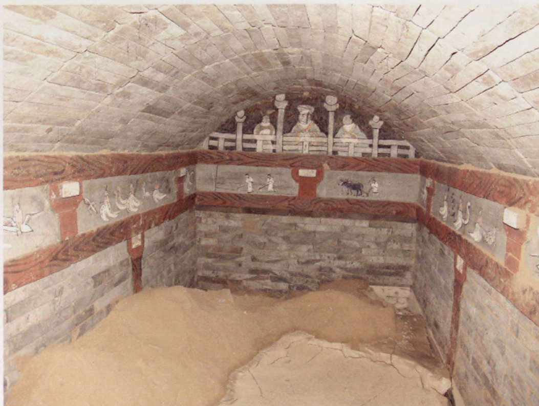
图9 陕西省靖边县杨桥畔发现的东汉壁画墓