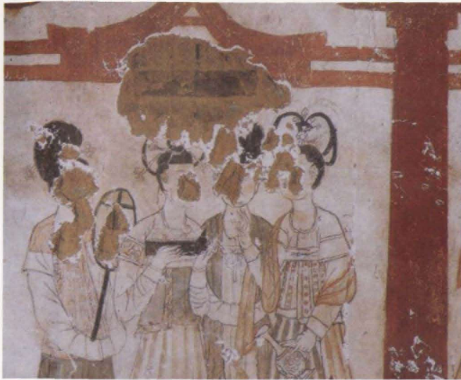
图2 被盗墓贼挖去的侍女面部 [1] Fig. 2 The lady's face was damaged by robbers

墓室总长约 44.2 米，但绘制在墓道、甬道和墓室的壁画中有三分之二多遭到破坏，大面积脱落，残留壁画不足三分之一；又如 2004 年 3 月至 2004 年 9 月，在陕西富平县北吕村唐献陵陵园区内发掘的李邕墓，该墓南北方向全长 60 米，由长斜坡墓道、4 个过洞、5 个天井、6 个壁龛、前后砖券甬道及双墓室组成，壁画绘制在墓道、过洞、甬道和墓室的壁面上，但残留壁画不足一半（图 3），等等。因此，针对墓葬壁画的结构、所用材质的特性和保存状