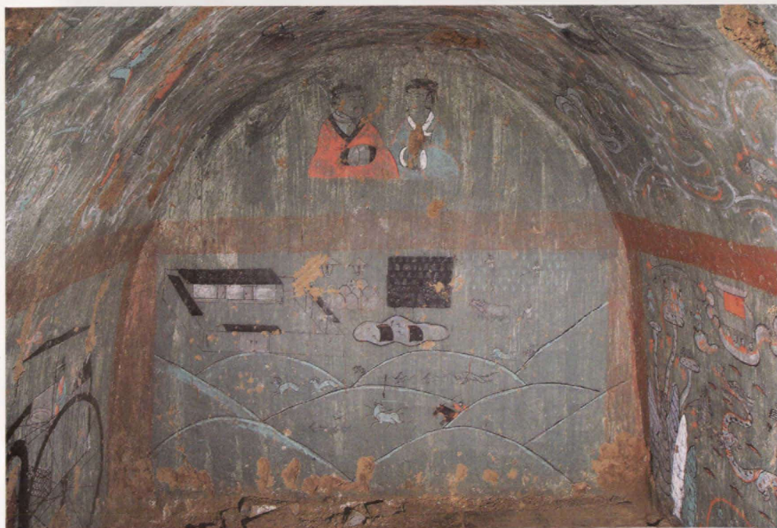
图5 陕西定边郝滩发现的东汉壁画墓

发现的壁画分布在墓室壁面和拱顶顶部（图5），壁龛内未绘制壁画，其壁画的内容包括墓主夫妇并坐图、车马出行图（图6）、庭院图（图7）、农耕图、放牧图、狩猎图、升仙图、西王母宴饮图（图8），还有二十八宿图、仙人游天图等。