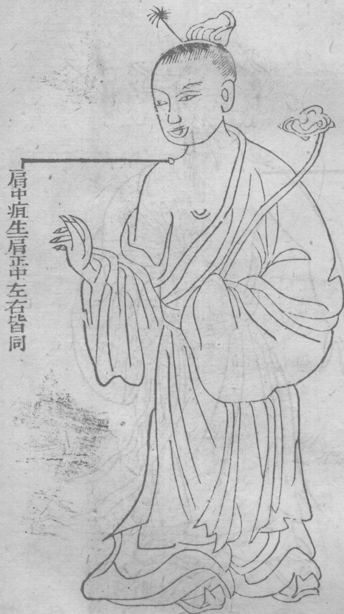
肩中疽生肩正中左右皆同