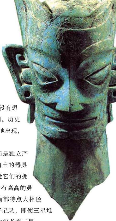
↑三星堆戴冠饰簪人头像

此外，诸如三星堆文明是否有文字，其人面像为什么那么注重眼睛等一系列问题也依旧纠缠着众多专家学者。但是，不论这些谜题是否得到解答，三星堆遗迹已经促使人们开始重新认识巴蜀文化，甚至重新认识中国文化。它证明了长江流域与黄河流域一样同是中华民族的发祥地。