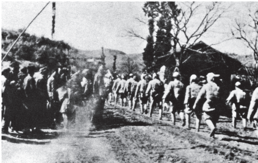
云南人民放鞭炮欢迎解放大军

云南的和平解放，减少了因战争给国家和人民带来的损失，为我军进入云南、解放全省创造了条件，同时，也加重了我们对卢汉及其所属军政人员的统战工作和团结改造工作，增加了工作的复杂性。针对当时的实际情况，中央提出，云南的工作方针是“在省委领导下，团结第一，工作第二”。1950年1月19日，中央批准了西南局关于处理云南问题的方案。主要精神是：云南解决一切问题，均应和卢汉商量处理，经过双方协议，作出