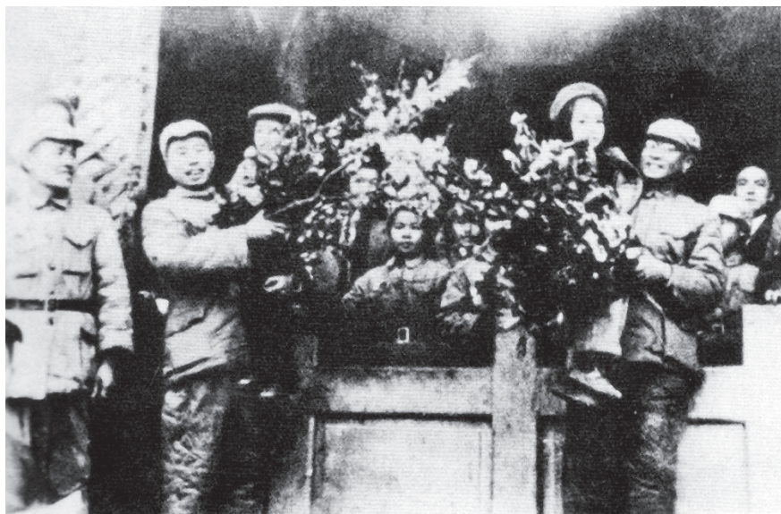
宋任穷（左）和陈赓（右） 在昆明群众欢迎大会上