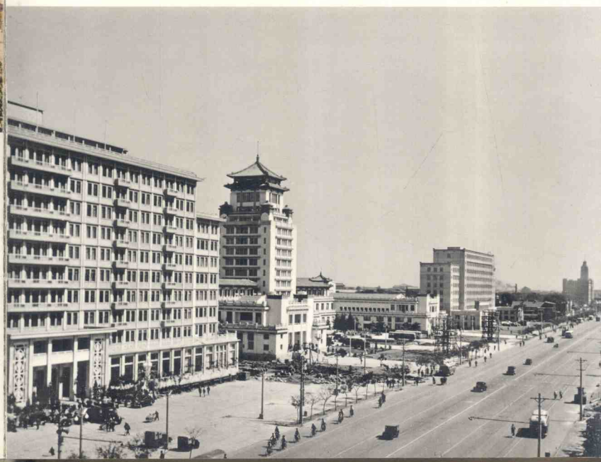
La calle Changan del Oeste