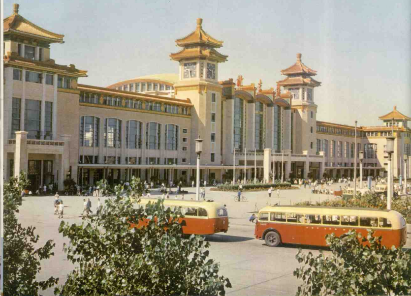
La Estación Central de Trenes