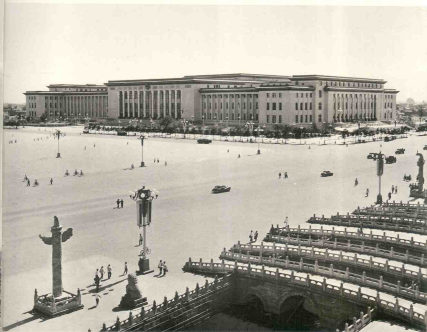
El Gran Palacio del Pueblo