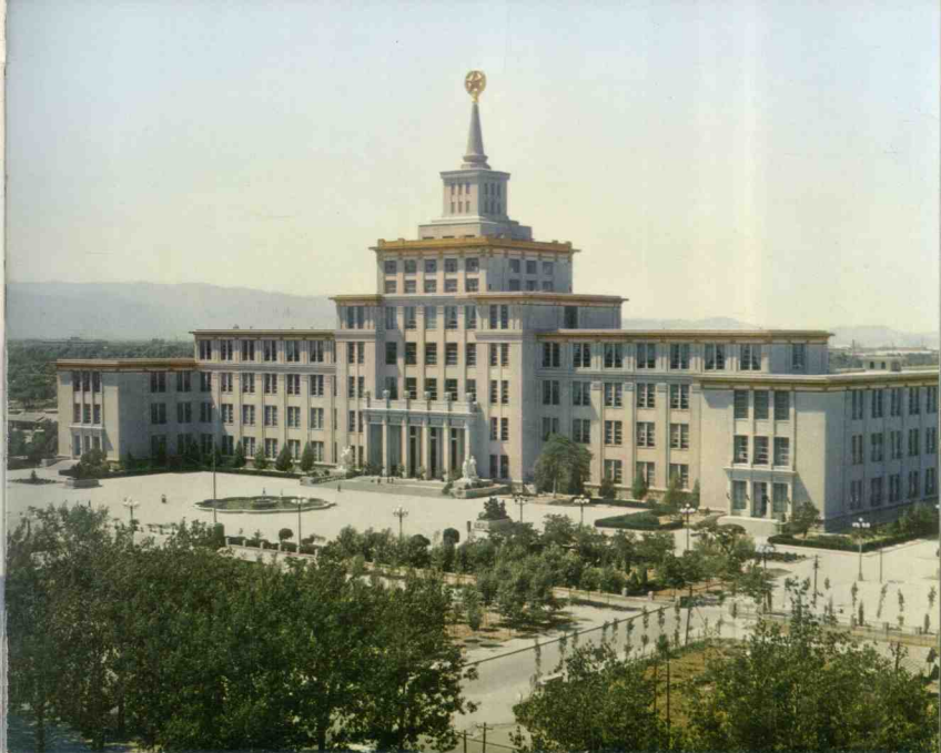
El Museo Militar de la Revolución