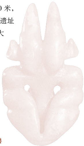
◆红山文化·玉雕神兽

除 了牛河梁的女神庙和积石冢，考古工作者还在喀左县（喀喇沁左翼蒙古族自治县）的东山嘴发现了距今 5000 年的祭坛遗址，这是目前中国发现的最早的宗教遗存。遗址坐落在山梁正中缓平突起的台地上，长约 60 米，宽约 40 米，四周是开阔的平地。遗址的核心部分是一座大型方形台基，东西长 11.8 米，南北宽 9.5 米。在祭坛上部，堆积着黑灰色的碎石片层，下部用黄土堆积，底部为平整坚硬的黄土层和大