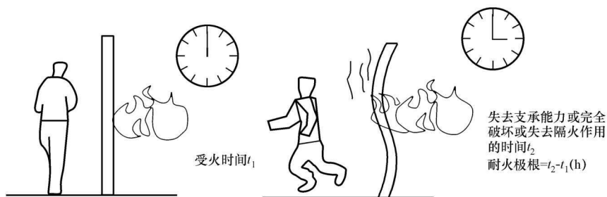
图 1-2 建筑的耐火极限

建筑的耐火等级是由建筑构件的耐火极限确定的。所谓耐火极限，是指任一建筑构件按时间—温度标准曲线进行耐火试验，从受到火的作用时起，到失去支持能力或完整性被破坏或失去隔热作用时为止的这段时间，用小时表示，见图 1-2。