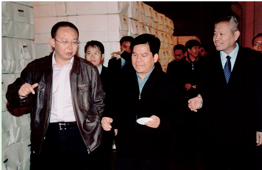
2006年12月4日，时任中共云南省委副书记李纪恒（左2）视察云景林纸股份有限公司