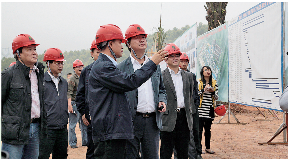
2011年11月17日，中共普洱市委书记沈培平（中2）到景谷视察工作