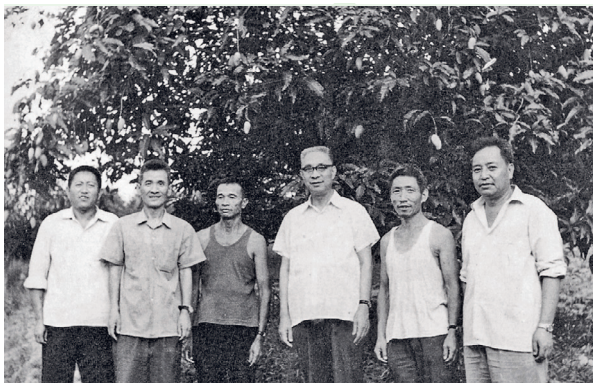
1980年8月，中共云南省省委书记安平生（右3）在中共思茅地委书记张文英（左2）、中共景谷县委书记刘国桢（右1）陪同下视察景谷芒果园