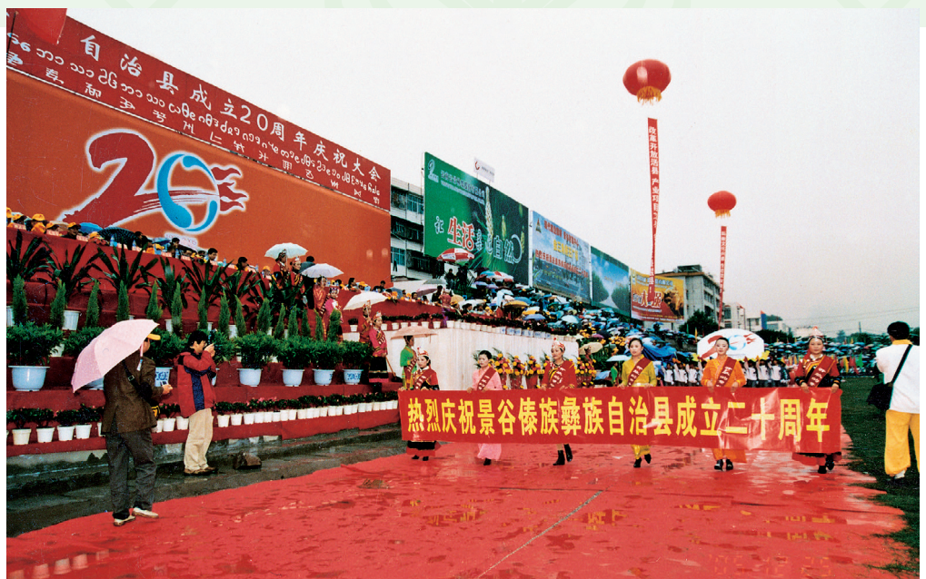
2005年12月25日，景谷傣族彝族自治县成立20周年庆祝大会