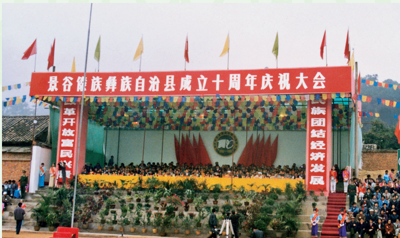
1995年12月25日，景谷傣族彝族自治县成立10周年庆祝大会。