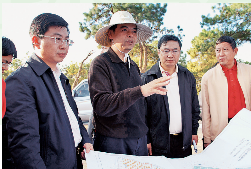
2008年12月9日，中共普洱市委书记高旭升（左2）视察永平现代烟草农业示范区建设项目，中共景谷县委书记李忠民（左1）、县长李富林（右1）陪同视察