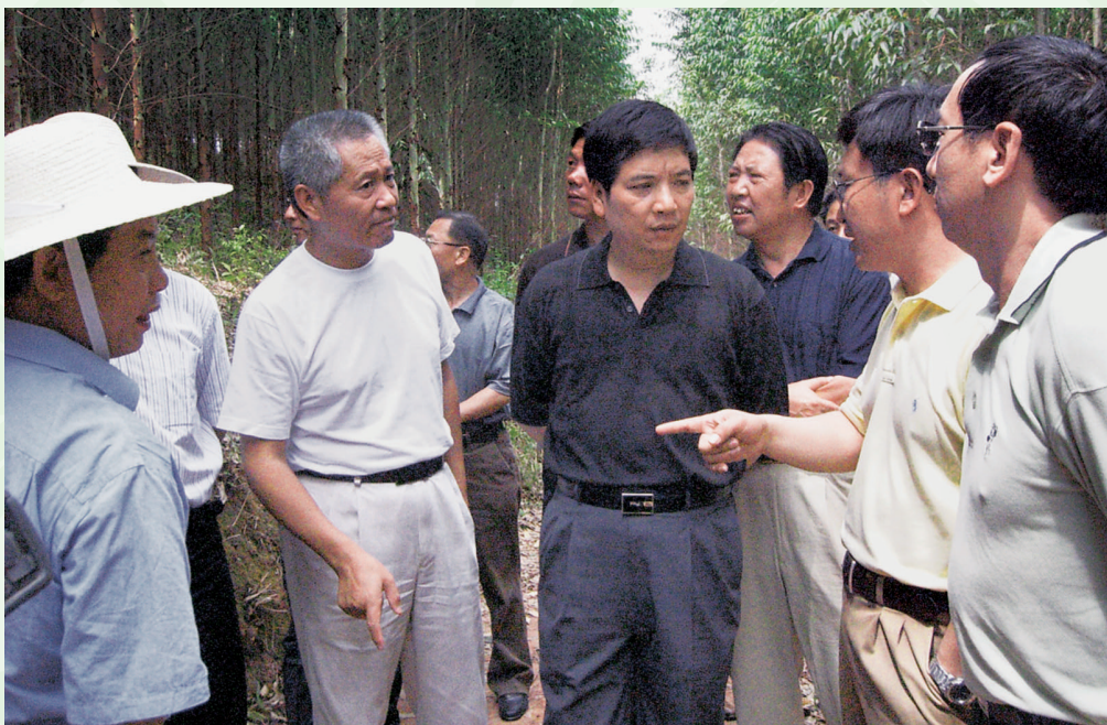
2004年5月12日，时任云南省委副书记、常务副省长秦光荣（右3）视察景谷林业工作