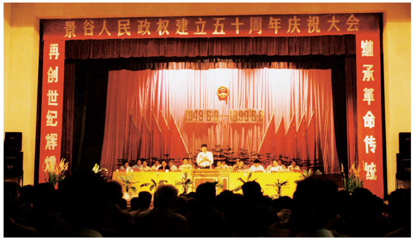
1999年6月6日，景谷傣族彝族自治县建政50周年庆祝大会