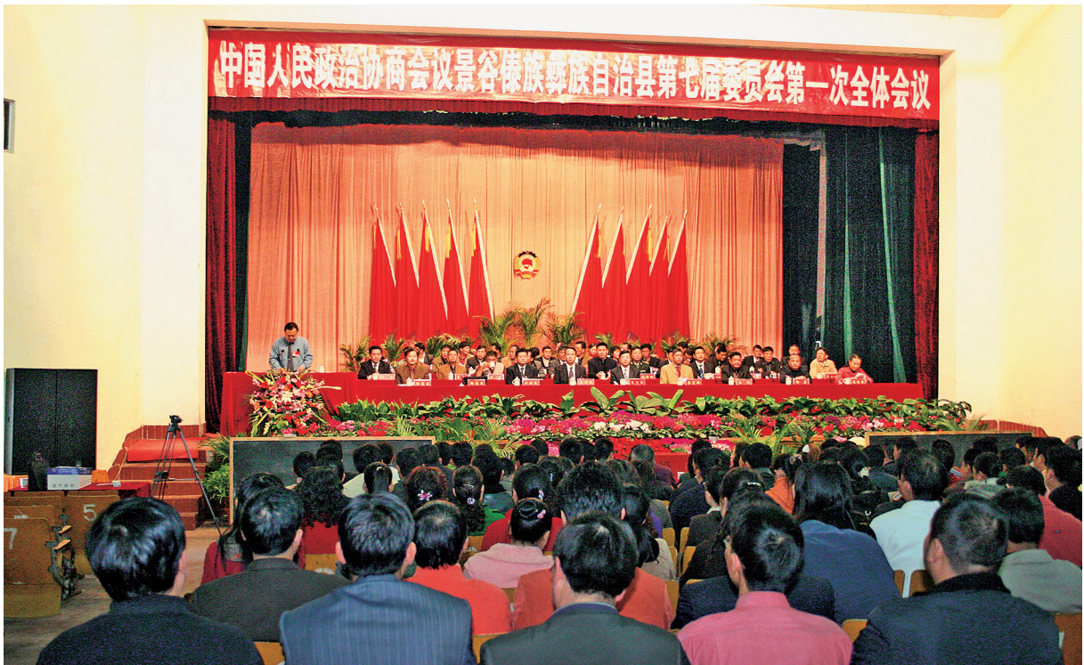
2008年1月10日~13日，中国人民政治协商会议景谷傣族彝族自治县第七届委员会第一次全体会议召开