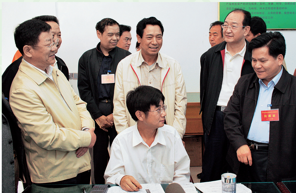
2007年4月14日，国家林业局副局长张建龙（左1）、中共云南省委副书记李纪恒（右1）、云南省副省长孔垂柱（右2）等领导实地考察景谷集体林权制度改革试点工作