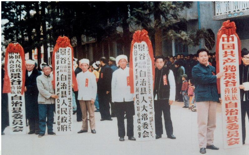
1985年12月25日，景谷傣族彝族自治县成立挂牌仪式