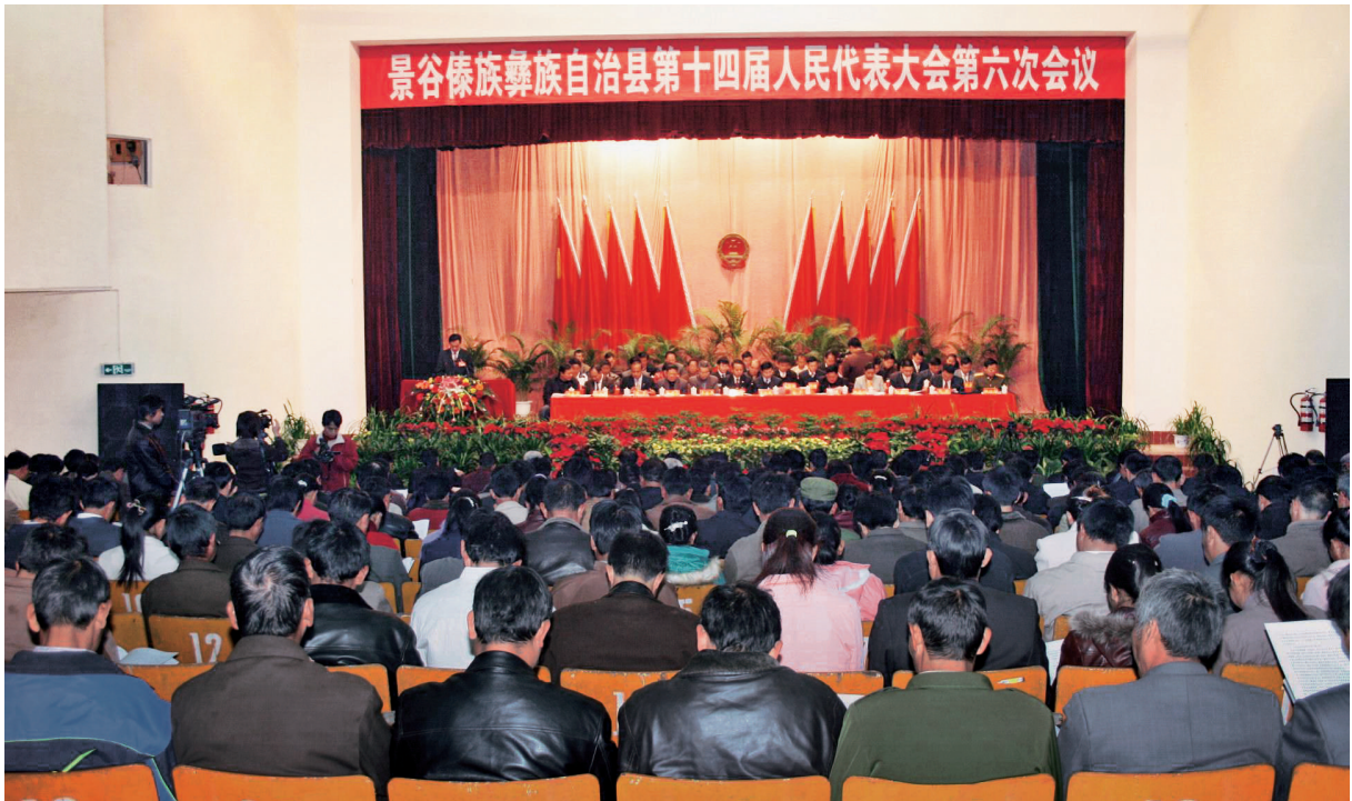
2007年1月23日，景谷傣族彝族自治县第十四届人民代表大会第六次会议