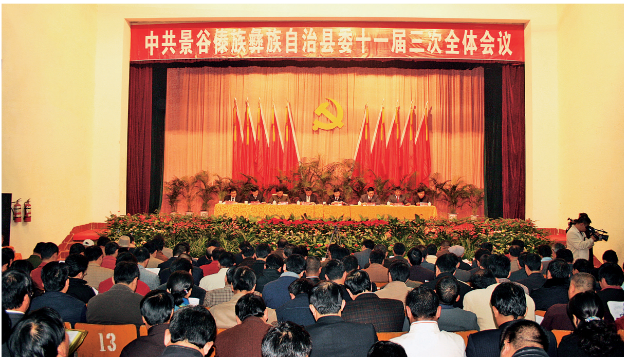
2007年12月27日，中共景谷傣族彝族自治县县委十一届三次全体会议召开