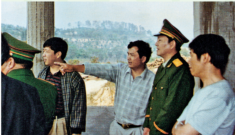
2000年4月10日，国家林业局武警森林指挥部主任何旺林（右2）在思茅行署专员王志东（右4）、中共景谷傣族彝族自治县委书记罗维祥（右3）陪同下视察护林防火工作