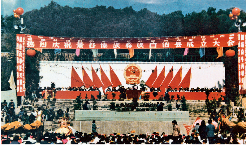
1985年12月25日，景谷傣族彝族自治县成立大会