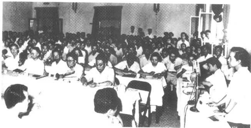
1957年6月8日，中共中央发出《关于组织力量反击右派分子的进攻的指示》，在全国范围内开展反右派的斗争。