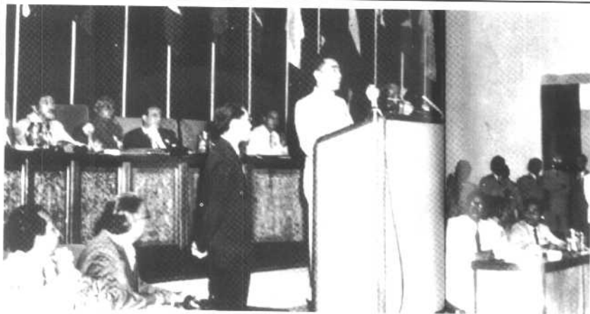
1955年4月18日至24日，周恩来率领中国代表团出席在印尼万隆举行的亚非会议。图为周恩来在大会上发言。