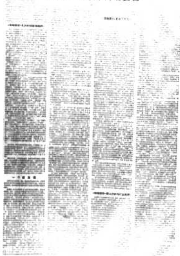
评新编历史剧《海瑞罢官》

1965年11月10日，上海《文汇报》发表了《评新编历史剧〈海瑞罢官〉》。这篇文章的发表，以及随之而来的批判运动，直接成为“文化大革命”的序幕。