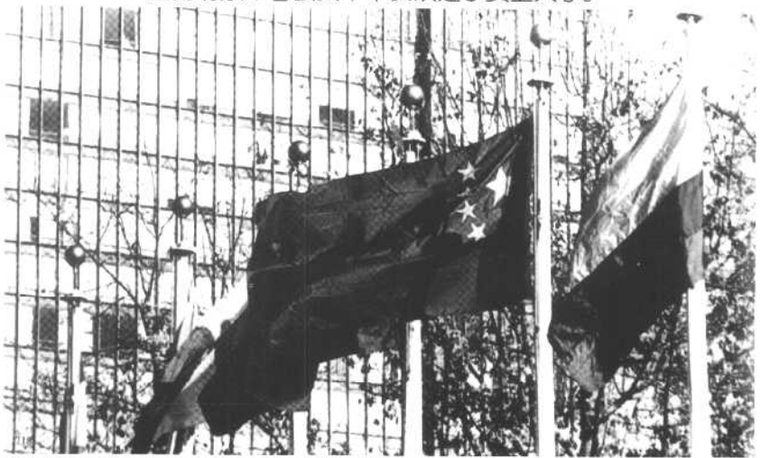
1971年10月25日，第26届联合国大会通过决议，恢复中华人民共和国在联合国的一切合法权利。图为五星红旗在纽约联合国总部升起。