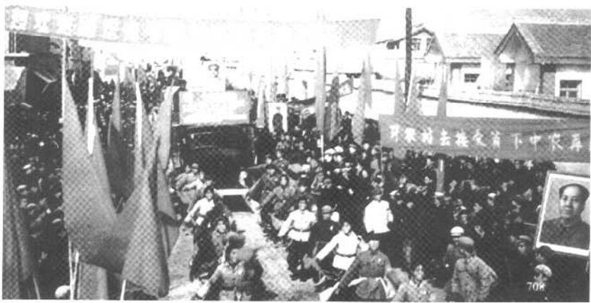
1968年12月22日，新华社传达了毛泽东“知识青年到农村去，接受贫下中农的再教育，很有必要”的号召，全国掀起了知识青年上山下乡运动。