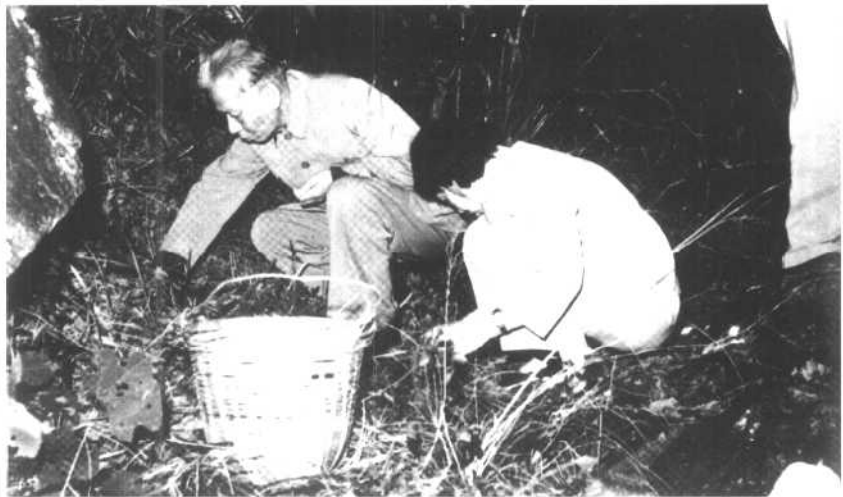
1961年底，刘少奇在广州从化温泉治疗期间，研究解决经济困难中的代食品问题。