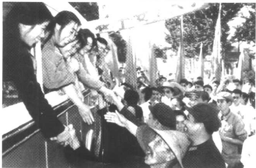
图为北京平谷县贫下中农欢送子女上大学。