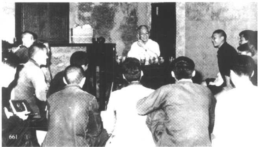
1961年4月1日至5月15日，刘少奇到湖南长沙市、宁乡县调查。图为刘少奇召开座谈会。