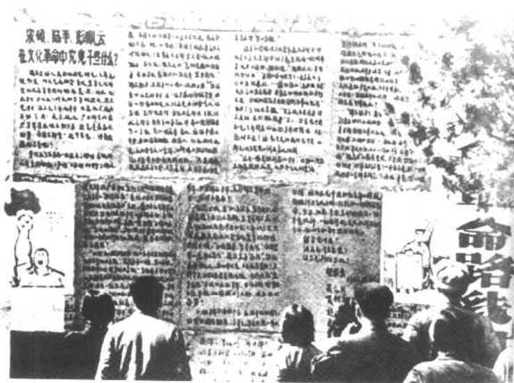
1966年5月25日，北京大学哲学系聂元梓等人贴出大字报，攻击中共北京市委和北京大学党委。