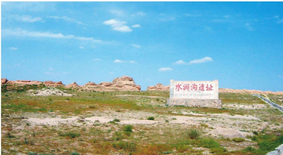
↑ 宁夏水洞沟旧石器时代遗址

自古以来，宁夏就是内接中原、西通西域、北连大漠，各民族南来北往、频繁交流的地区。春秋战国时期，宁夏是羌、戎和匈奴等民族集居地之一。周赧王