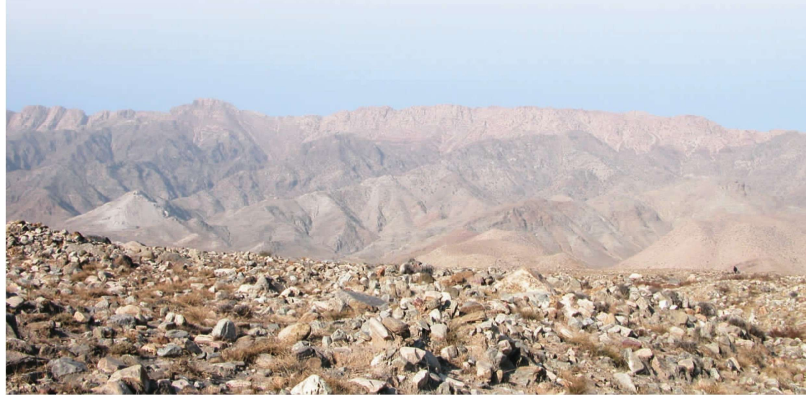
↓ 麦汝井岩画点周边环境