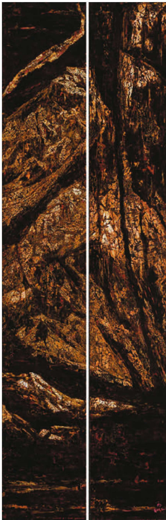
无欲 II (漆画) 肖飞 郭劼