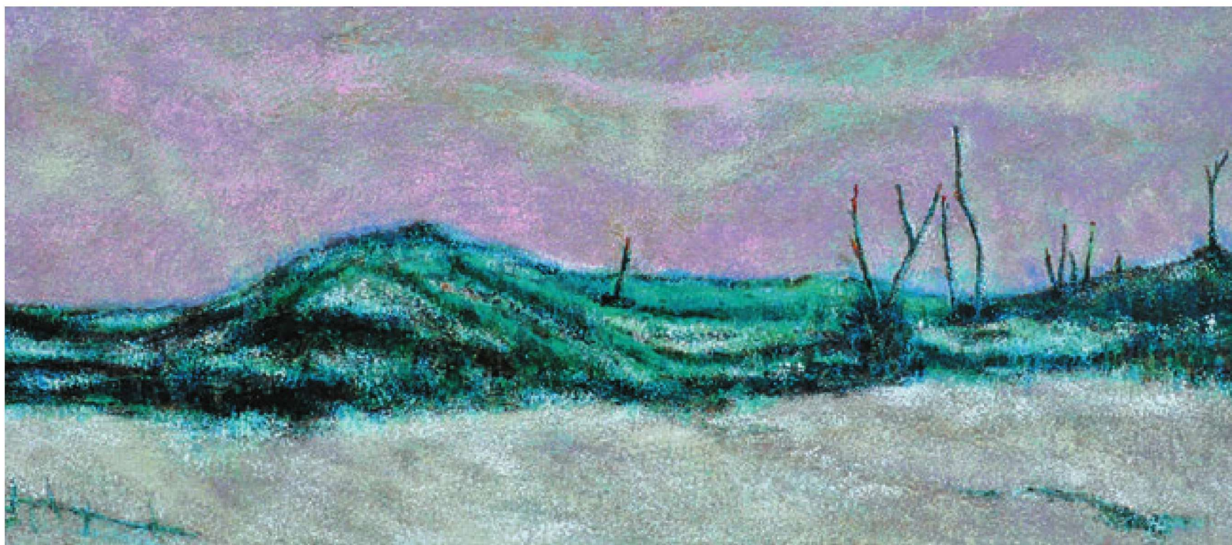
蹉跎岁月（漆画） 李午兴