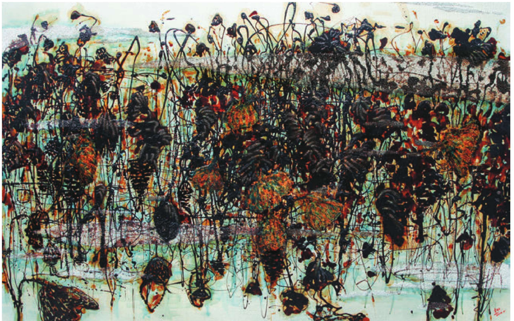
归去来兮（漆画） 120cm × 190cm 支林