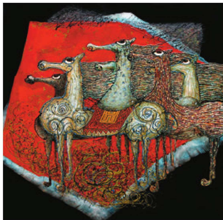
绅士（漆画） 190cm×190cm 支林