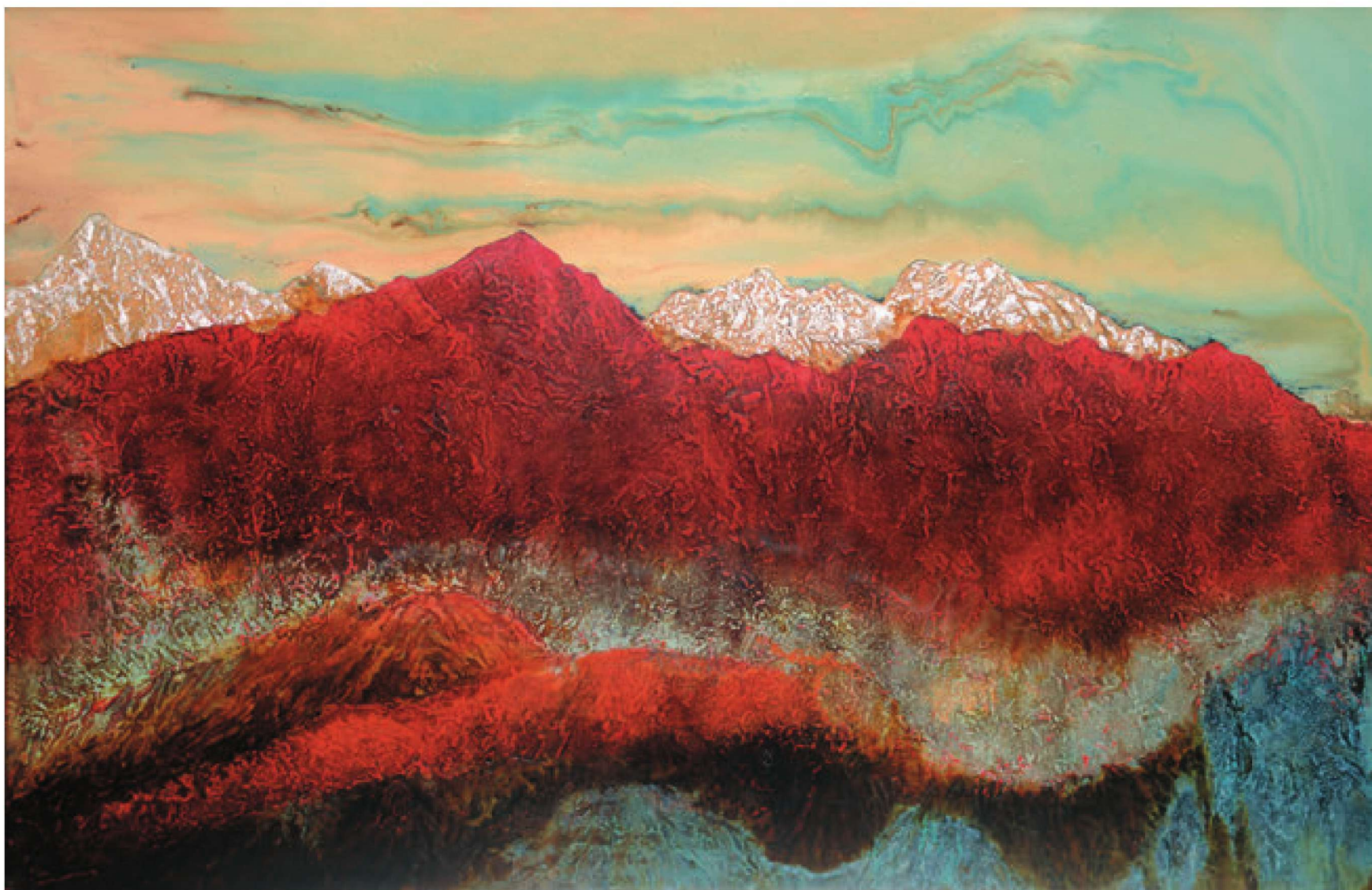
红色圣山（漆画） 120cm×80cm 2012 寇焱