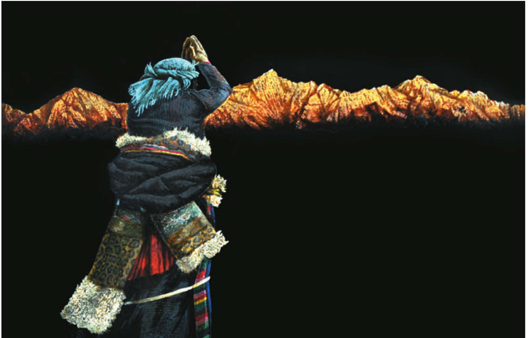
金色圣山（漆画） 120cm × 80cm 2009 寇焱