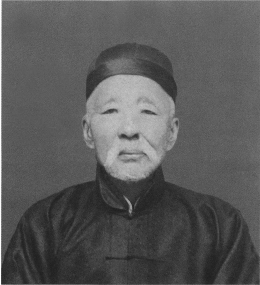
行唐尚节之秉和先生（公元 1870 - 1950 年） 晚清时期大易学家尚秉和先生所著《焦氏易林注》《焦氏易詁》《周易尚氏学》《易说评议》《周易古筮考》等书，使失传两千多年的先秦易学复明于世，其功甚伟！