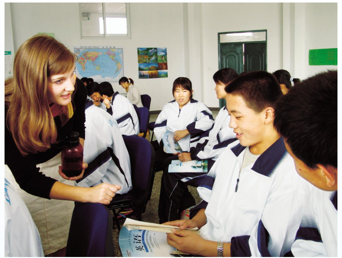
▲ 在中学英语课堂外籍教师与学生互动交流