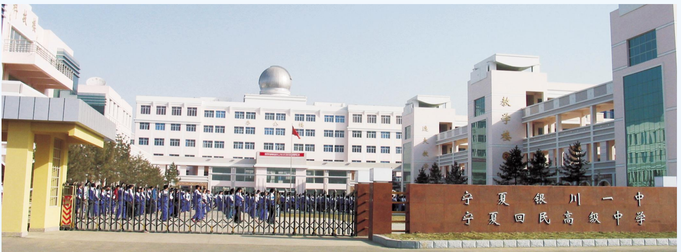
▲2002年11月,银川一中新校址落成