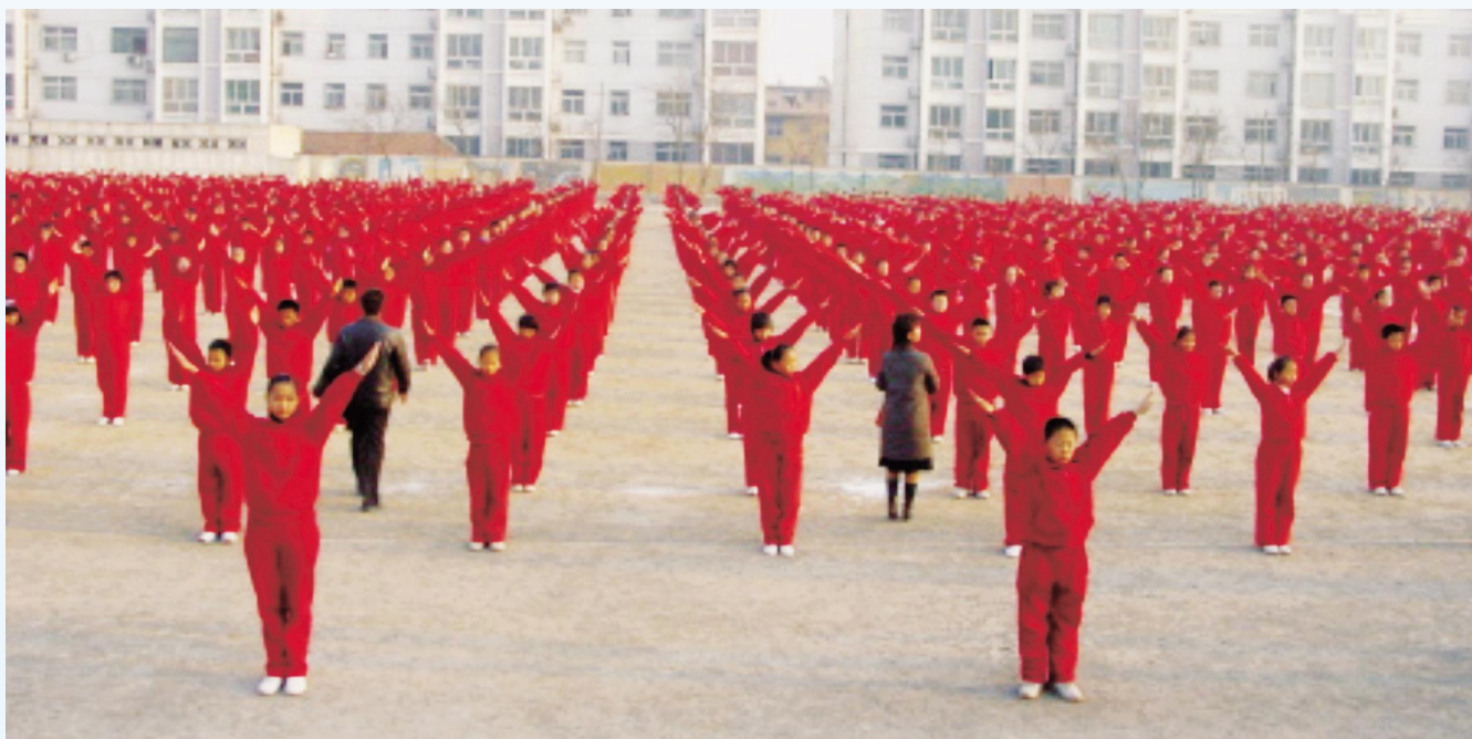
▲整齐有序的课间活动