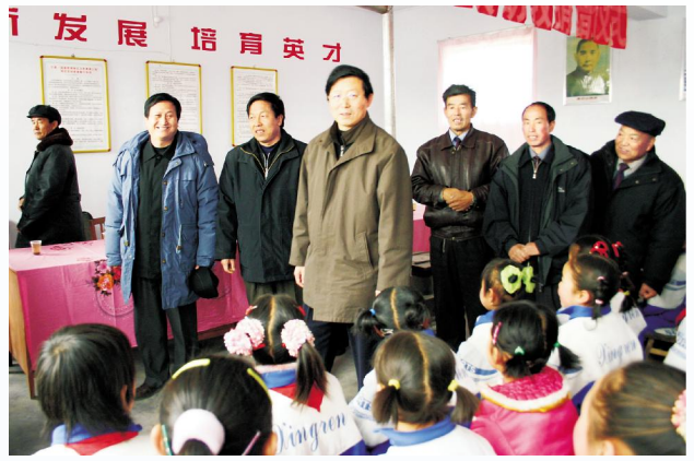
▲2004年1月,时任教育厅厅长蔡国英(前一)、副厅长安纯仁(后左一)在海原县兴隆镇学校检查指导工作