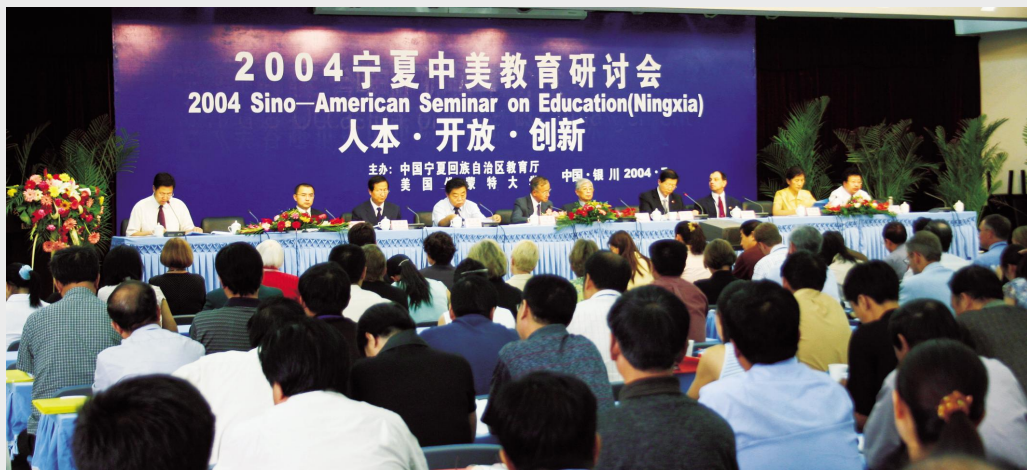
▲2004年7月,第二届中美教育研讨会在银川举办