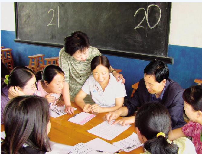
▲师生共同交流探讨