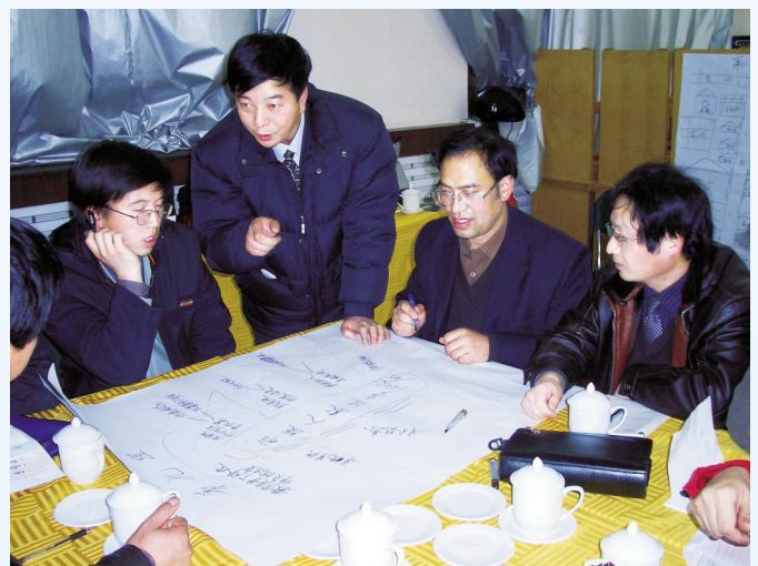
▲专家引领,校长参与式培训