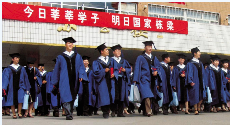
▶ 充满朝气的大学毕业生