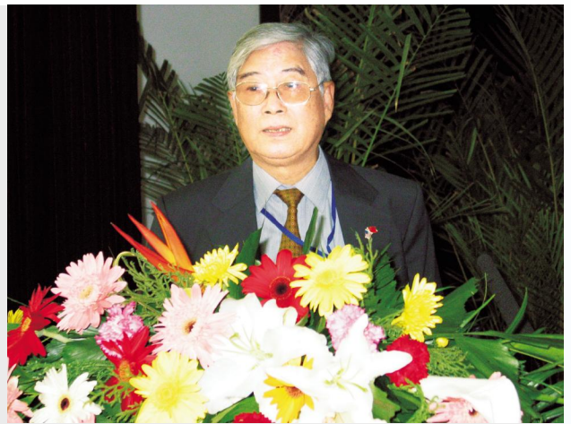
▲中国教育学会会长顾明远在中美教育研讨会上作报告