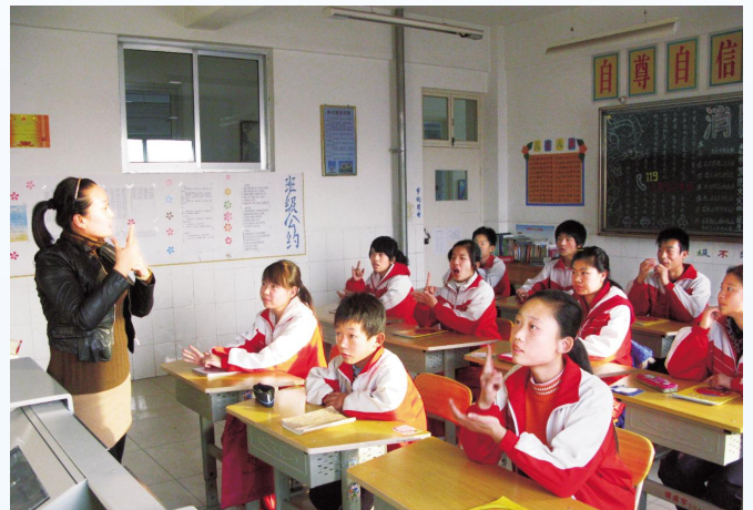
▲ 特殊教育学校的聋生在上手语课