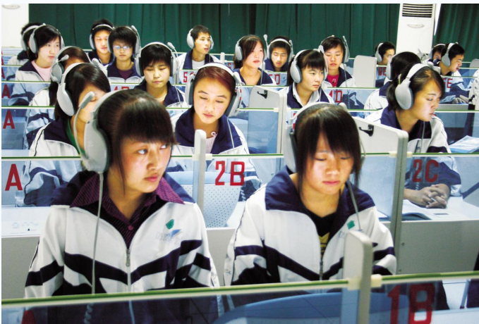
▲ 学生在现代化的教室上语音课