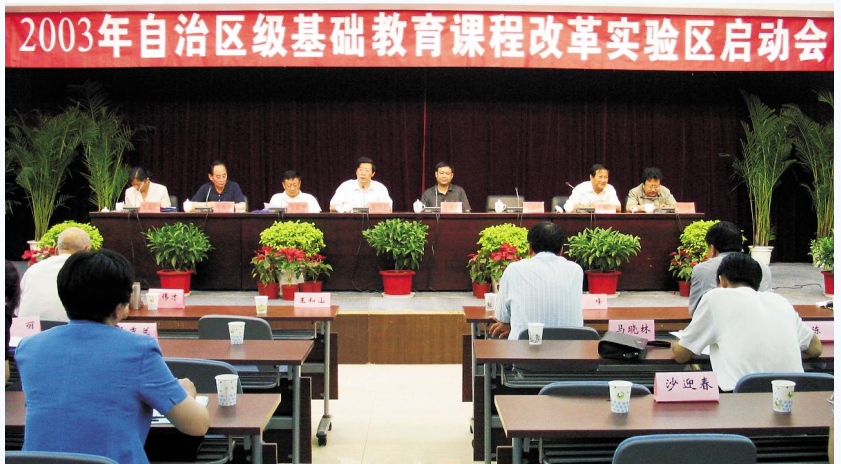
▶ 2003年7月,自治区级基础教育课程改革实验区启动会在银川召开