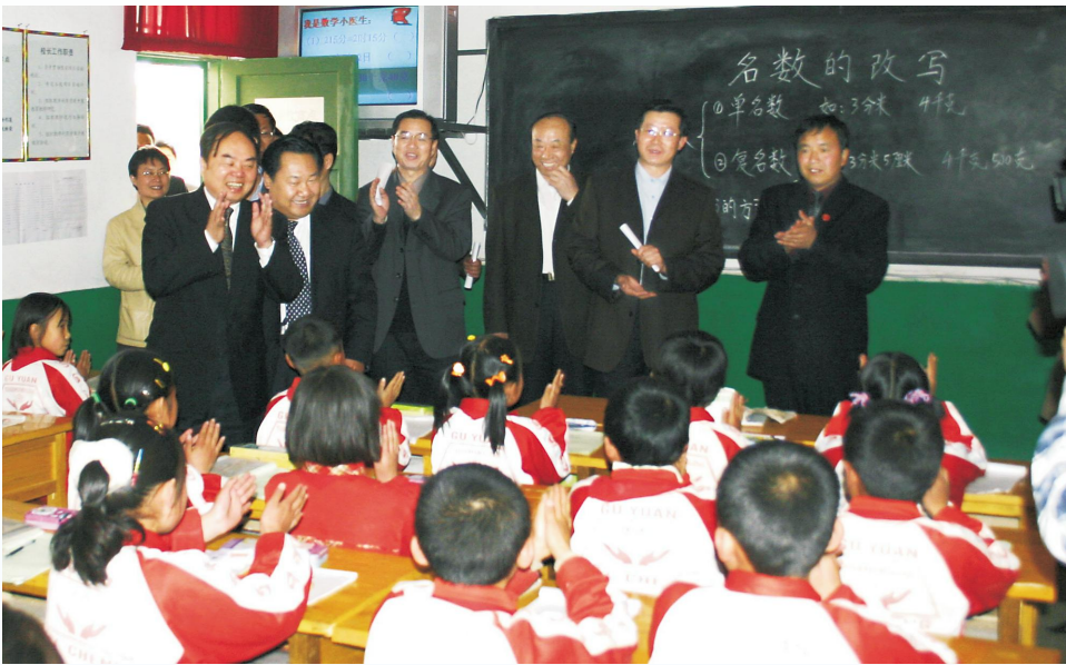
▶ 2005年4月，时任教育部部长周济在宁夏南部山区农村学校视察