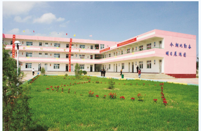
▲如今美丽如画的南部山区校园