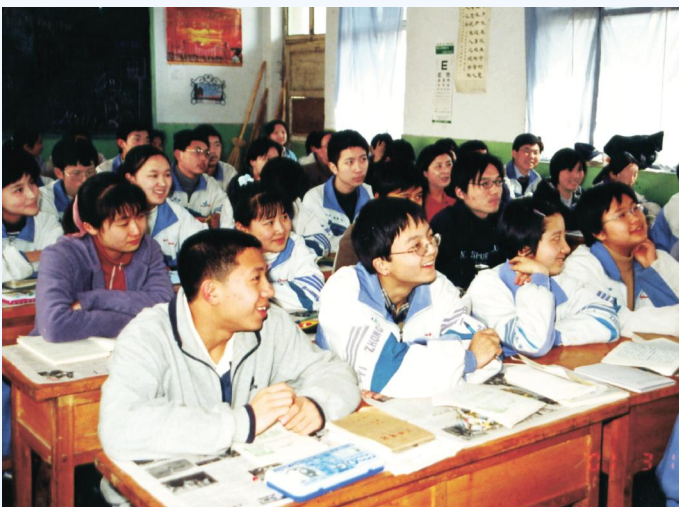
▲ 学生们在快乐有趣的课堂上听课学习