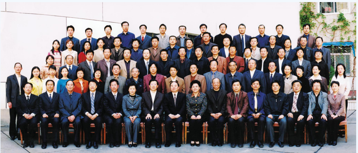
▲2005年4月,时任教育部部长周济在宁视察期间与教育厅全体干部合影