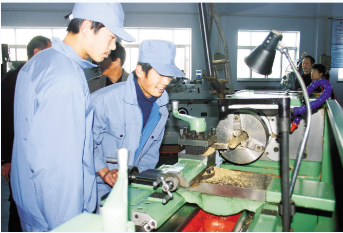
▲职业技术学院的学生在车间实习