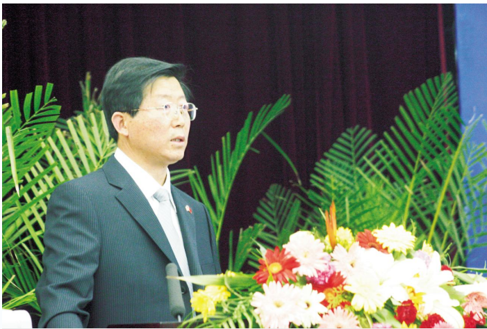
▲教育厅厅长蔡国英在中美教育研讨会上讲话