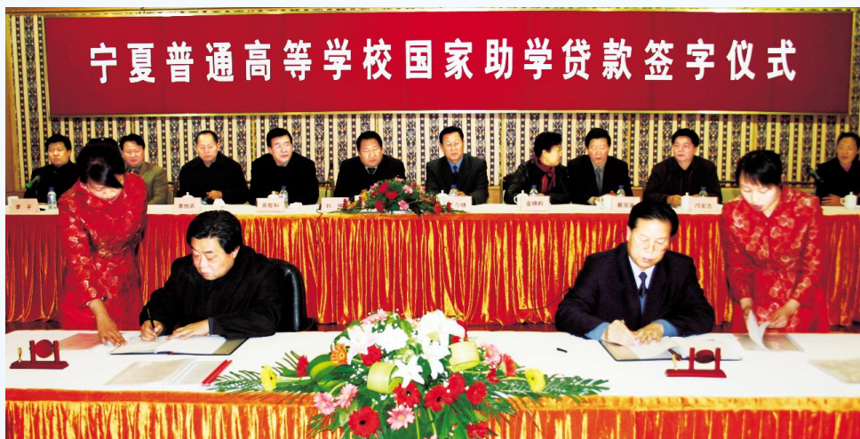
▶ 2004年12月，宁夏普通高等学校国家助学贷款签字仪式在银川举行