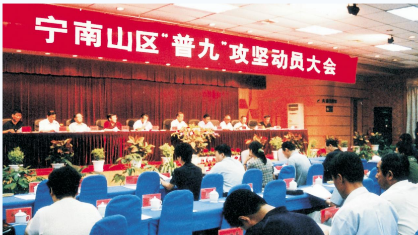
◀ 2003年7月,宁南山区“普九”攻坚动员大会在同心县召开