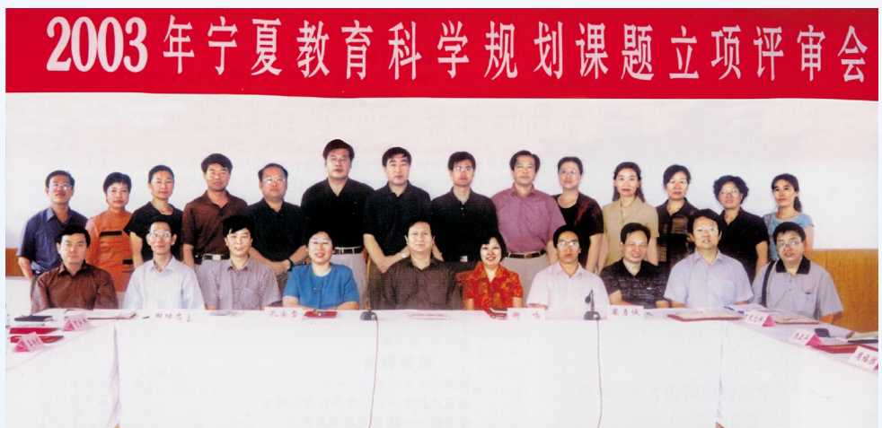
▶ 2003年,宁夏教育科学规划课题评审会在银川召开。图为评审专家合影。