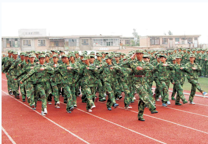
▲英姿飒爽的军训高中学生