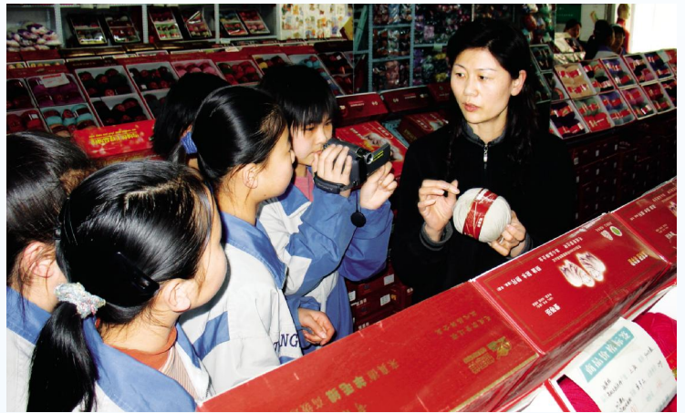
▶ 学生社会活动中进行市场调查