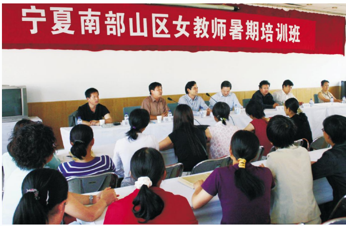
◀ 2004年8月,宁南山区女教师培训班在银川举办