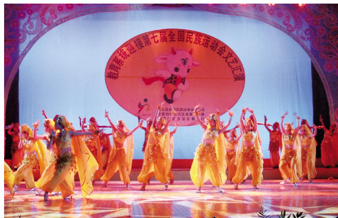
▲2002年12月,教育系统迎接第七届全国民族运动会文艺汇演