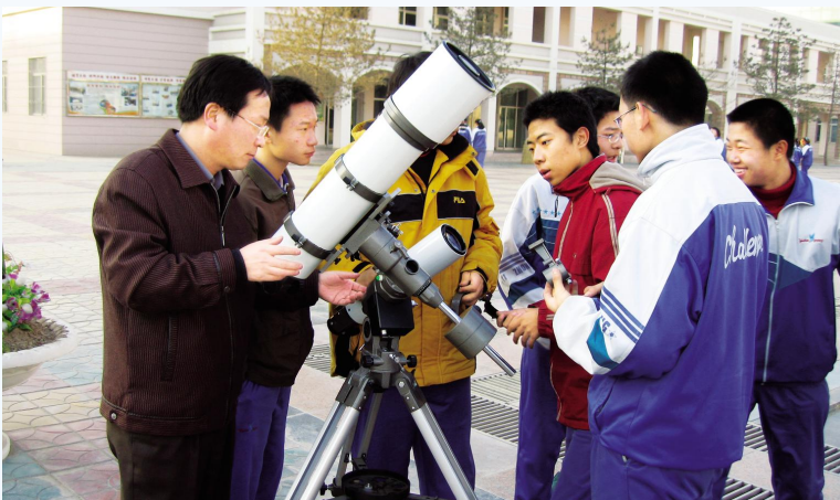
◀ 学生课外天文兴趣小组在观测天象