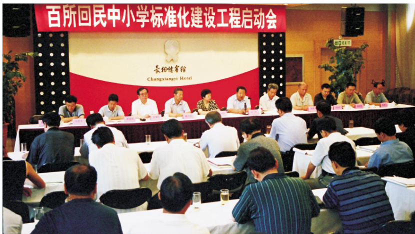
◀ 2001年7月,自治区人民政府“百所回民中小学标准化建设工程”启动大会在银川召开