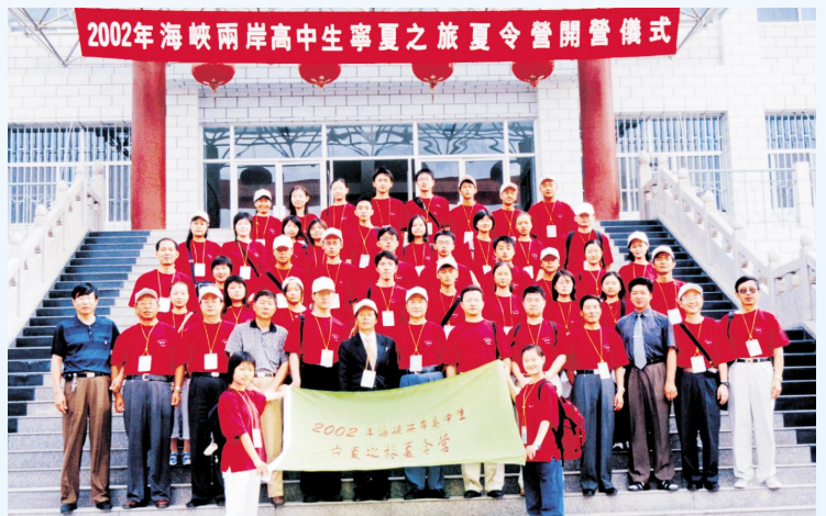
▶ 2002年7月,海峡两岸高中生夏令营宁夏之旅