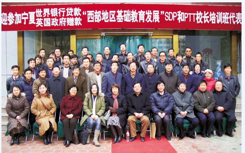
▶ 2005年,自治区教育厅启动了世界银行贷款、英国政府赠款“西部地区基础教育发展”SDP和PTT项目。图为项目学校校长培训代表合影。