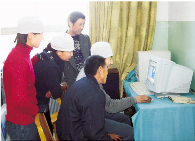
▲宁夏中小学教育信息化建设成果惠及当地农民