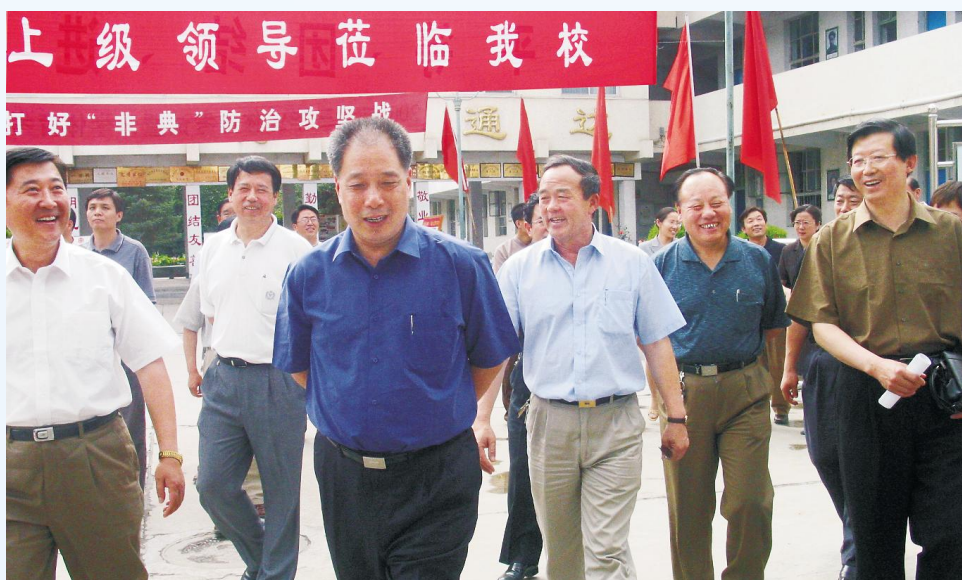
▶ 2003年7月，时任教育部副部长张保庆在宁视察教育系统“非典”工作