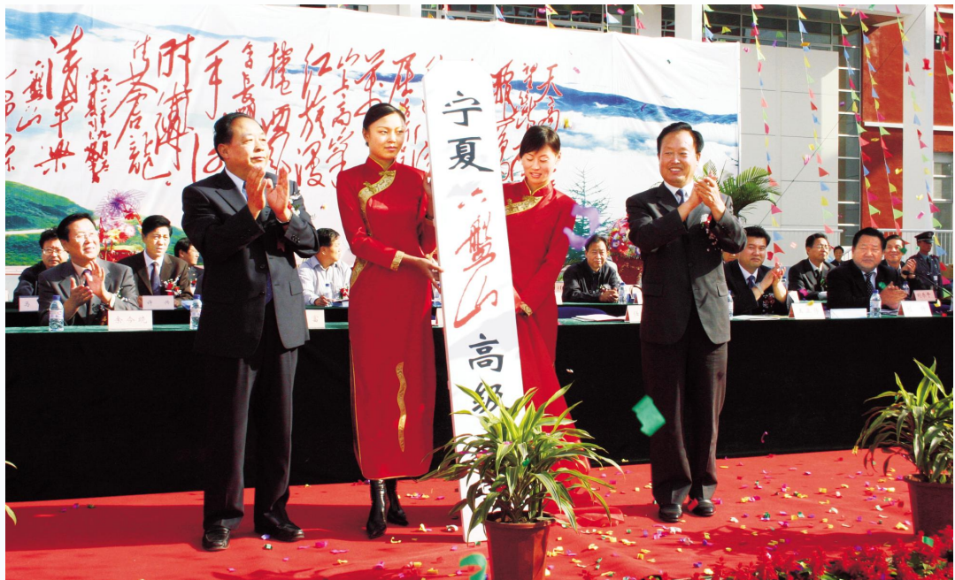
▲2004年9月,宁夏第一所扶贫学校——宁夏六盘山高级中学落成,时任自治区党委书记陈建国(右一)、政协主席任启兴(左一)等自治区领导参加落成典礼大会及揭牌仪式