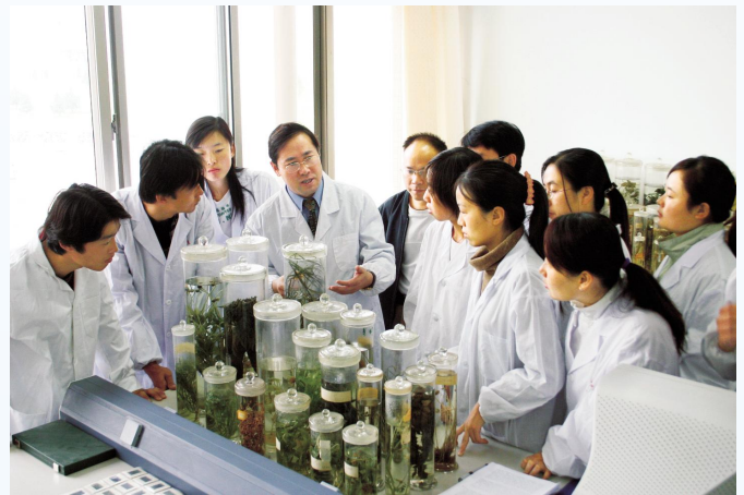
▲宁夏大学学生在做实验