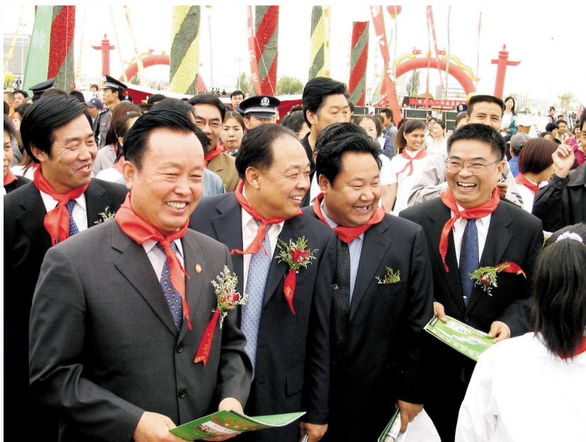
◀2004年“六一”儿童节,时任自治区党委书记陈建国(前左一)、政协主席任启兴(前左二)、省委常委、组织部部长傅思和(前右一)、省委常委、秘书长于革胜(后左一)、自治区政府副主席刘仲(前右二)参加庆典活动