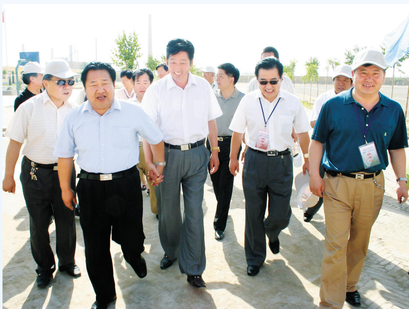
◀2005年7月,时任自治区副主席刘仲(左一)到学校检查指导工作