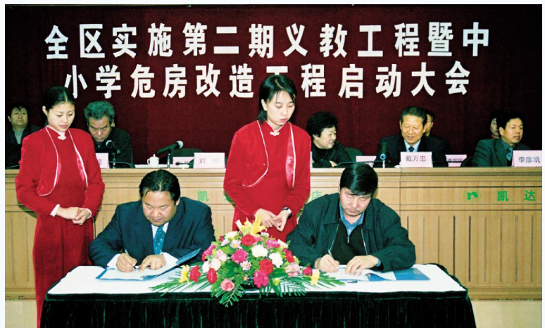
▶ 2001年11月,全区实施第二期义教工程暨中小学危房改造工程启动会在银川召开