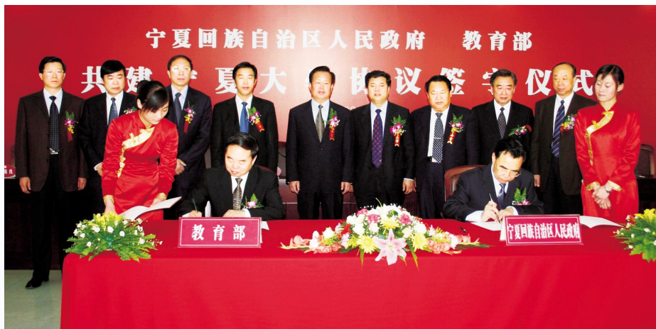
▶ 2005年4月，教育部与宁夏回族自治区人民政府在银川签署共建宁夏大学协议