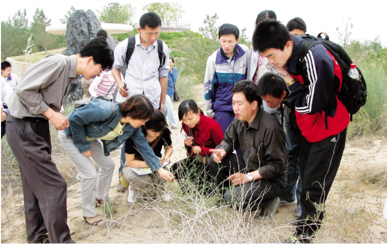
◀ 丰富多彩的第二课堂