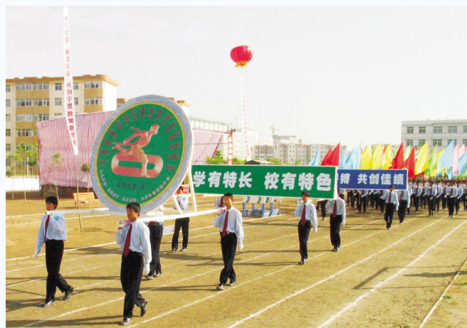
▲全区重点中学生运动会入场式