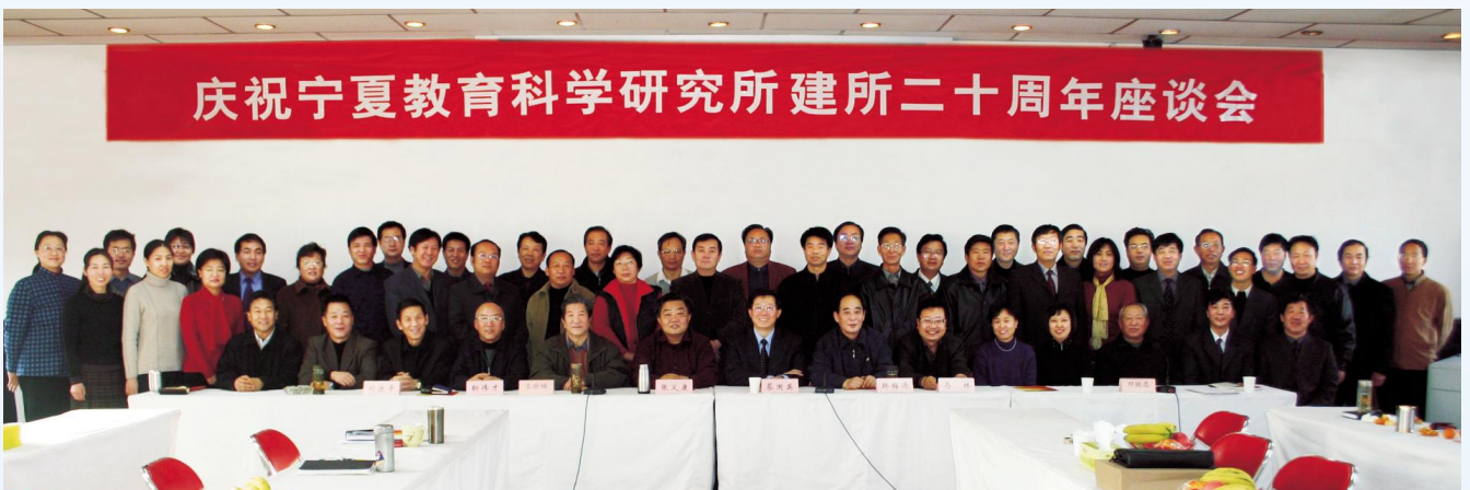
▲2004年12月,庆祝宁夏教育科学研究所建所20周年座谈会在银川举行,教育厅领导出席会议并与代表合影