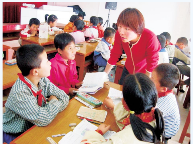
▲ 学生课堂小组讨论,教师参与引导