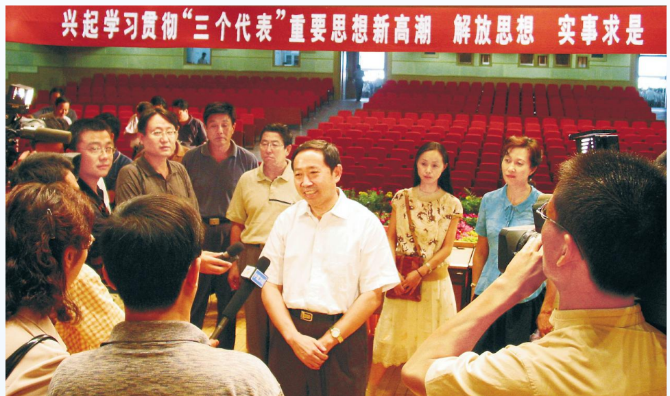
▶ 2003年7月，时任教育部部长袁贵仁来宁在银川宣讲“三个代表”后接受记者采访