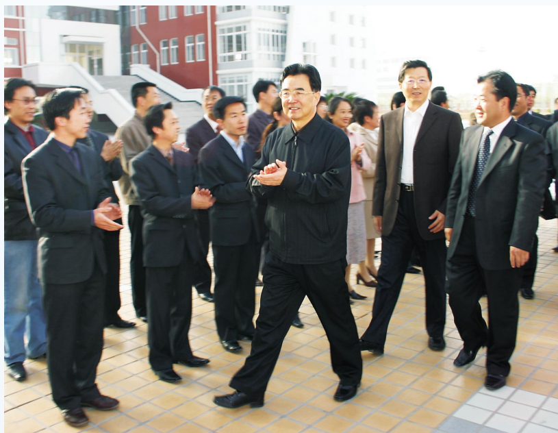
▶2004年11月,时任自治区主席马启智(前中)视察学校