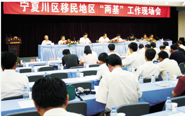
◀ 2005年6月,宁夏川区移民地区“两基”工作现场会在红寺堡召开