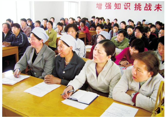
▲农民朋友在接受农业技术培训