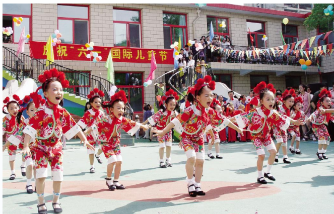
▲天真活泼的幼儿园小朋友