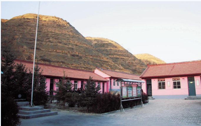
▲昔日南部山区低矮的教室