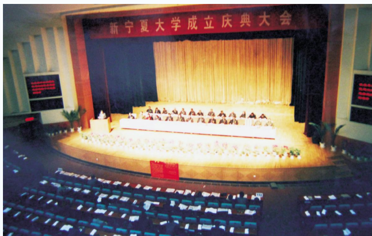
▶ 2002年2月，宁夏大学与宁夏农学院合并组建新的宁夏大学，图为成立大会庆典会场