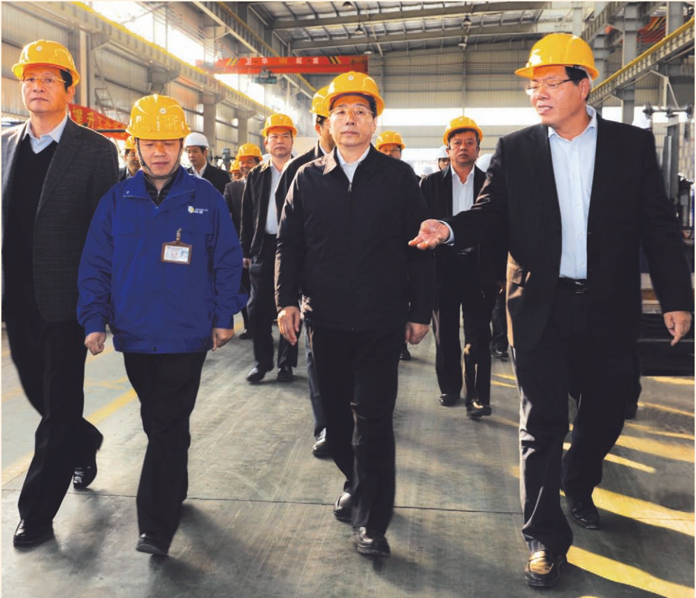
广西壮族自治区党委书记、自治区人大常委会主任郭声琨（右二）考察指导柳州工业