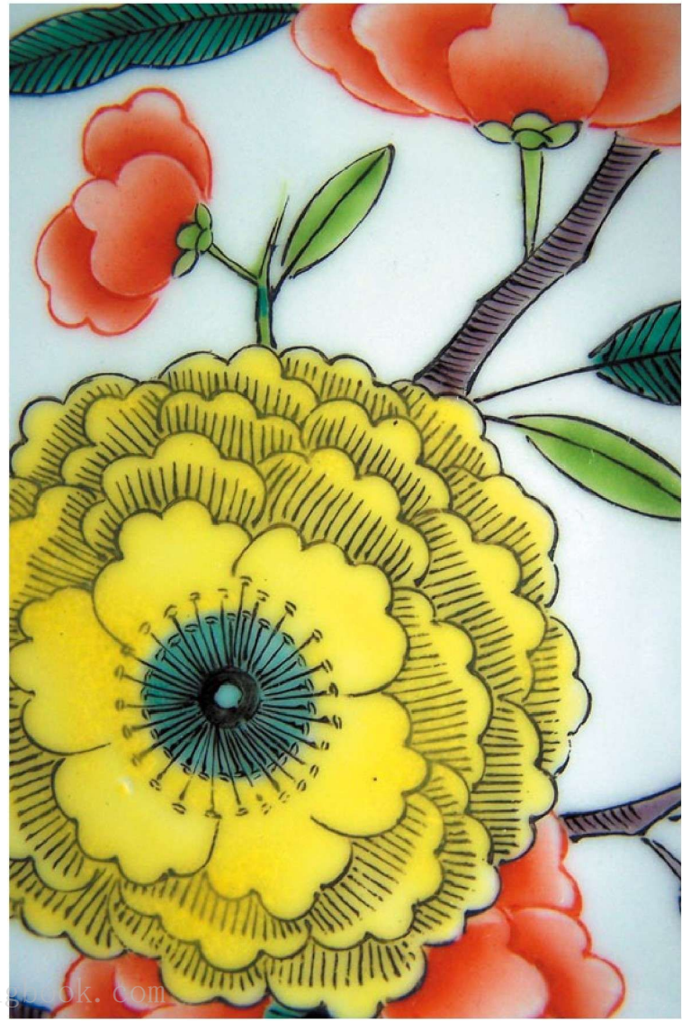
Flowering Peach and Butterfly (Partial)