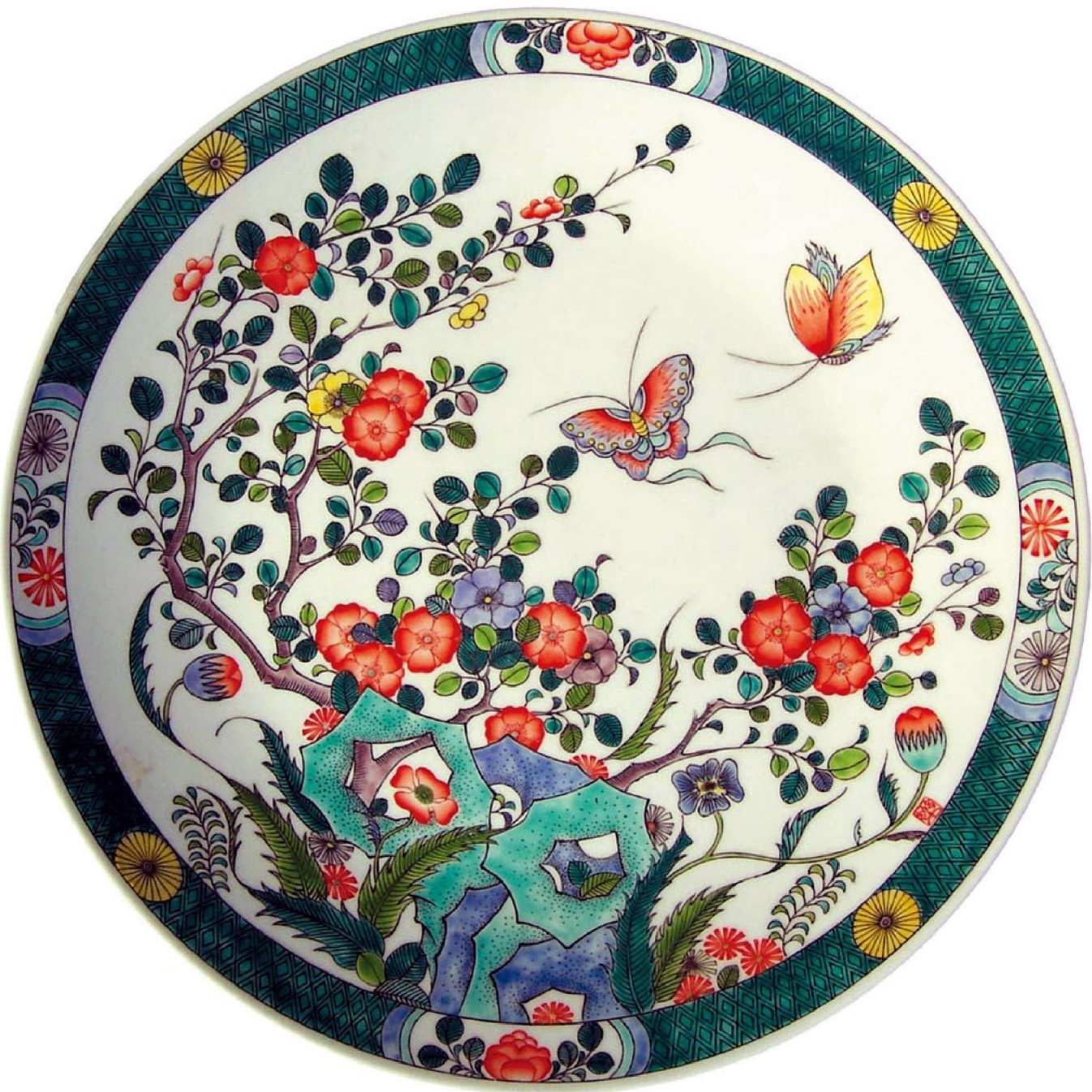
茶花蛱蝶 Camellia and Butterfly 瓷 1330℃还原，790℃古彩 8cm × 45cm × 45cm 2006年