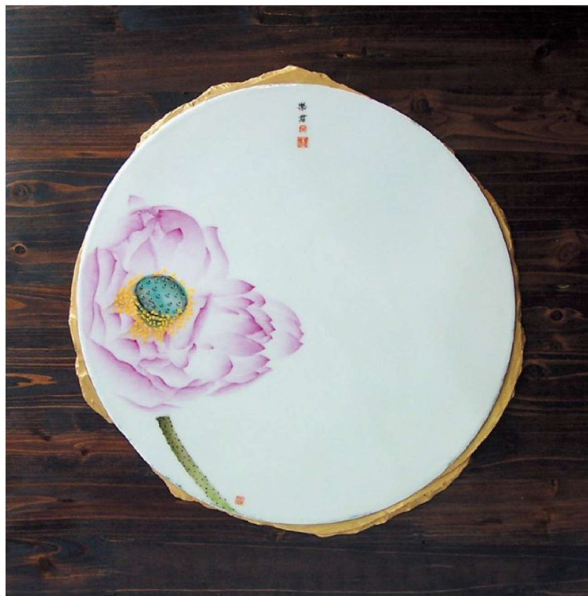
清荷二 Fragrance of Lotus Flower NO.2 瓷、木板 1330℃还原，760℃粉彩 105cm × 45cm × 3cm 2007年