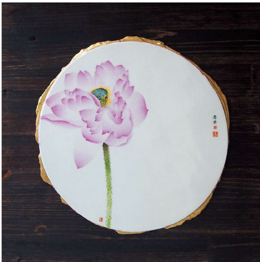
清荷三 Fra grance of Lotus Flower NO.3 瓷、木板 1330℃还原，760℃粉彩 105cm×45cm×3cm 2007年