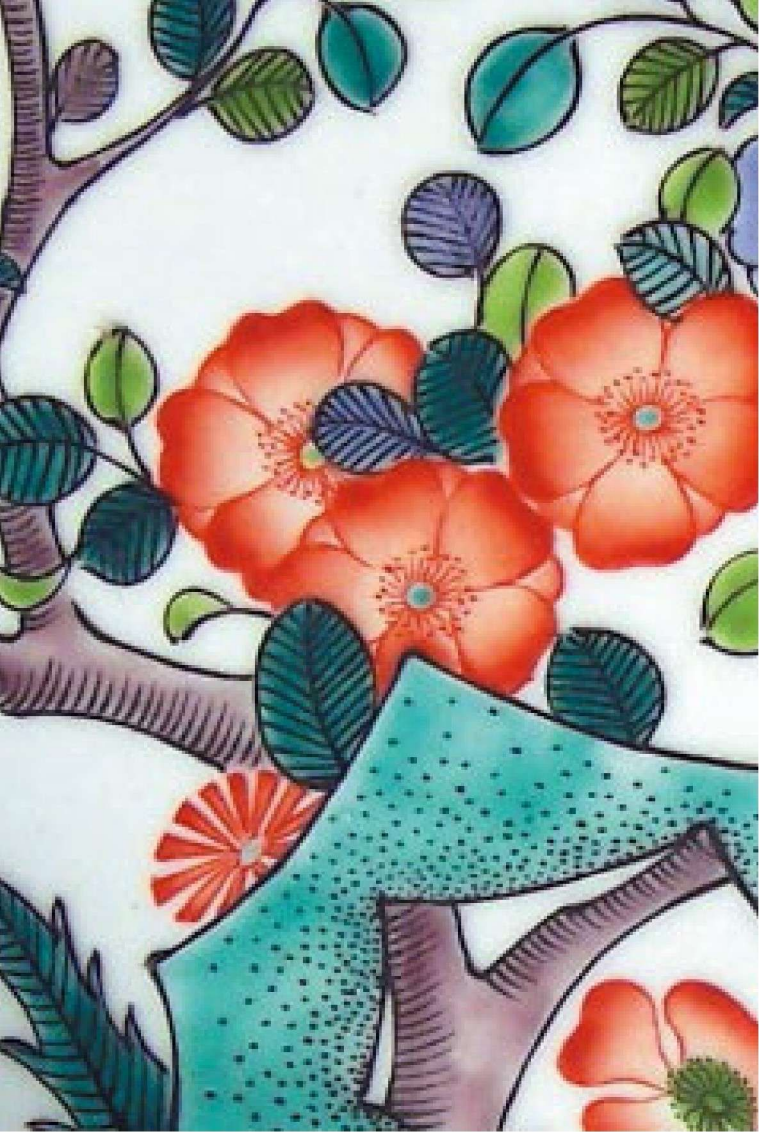
茶花蛱蝶（局部） Camellia and Butterfly (Partial)