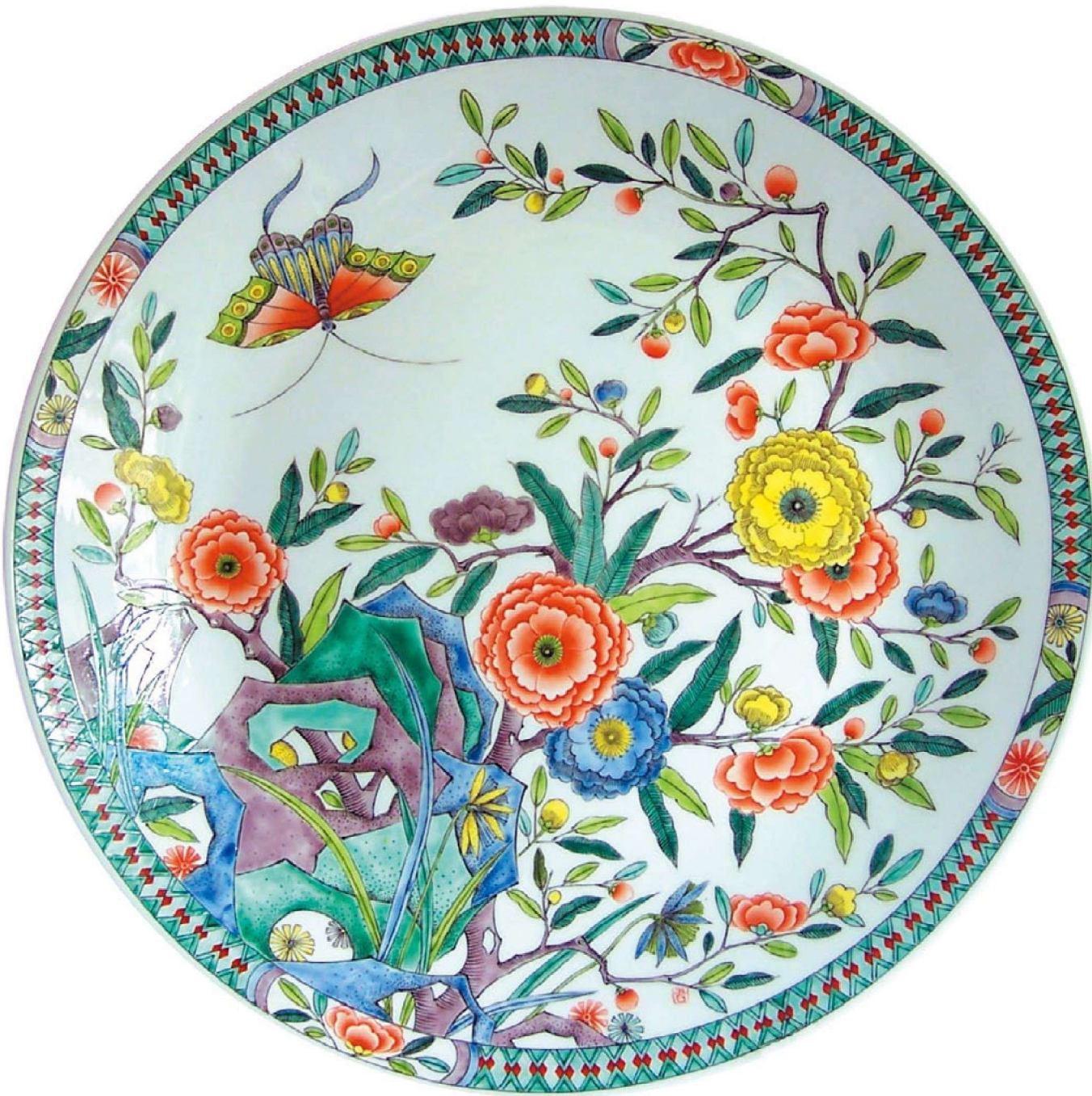
碧桃蛱蝶 Flowering Peach and Butterfly 瓷 1330℃还原，790℃古彩 9cm × 48cm × 48cm 2007年