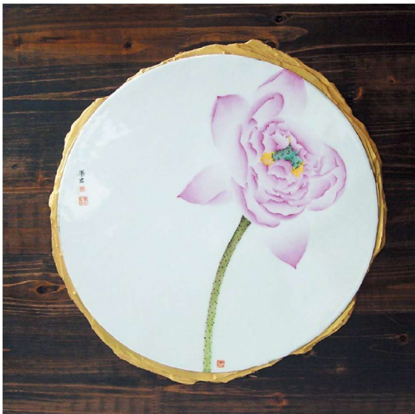
清荷一 Fragrance of Lotus Flower NO.1 瓷、木板 1330℃还原，760℃粉彩 105cm×45cm×3cm 2007年