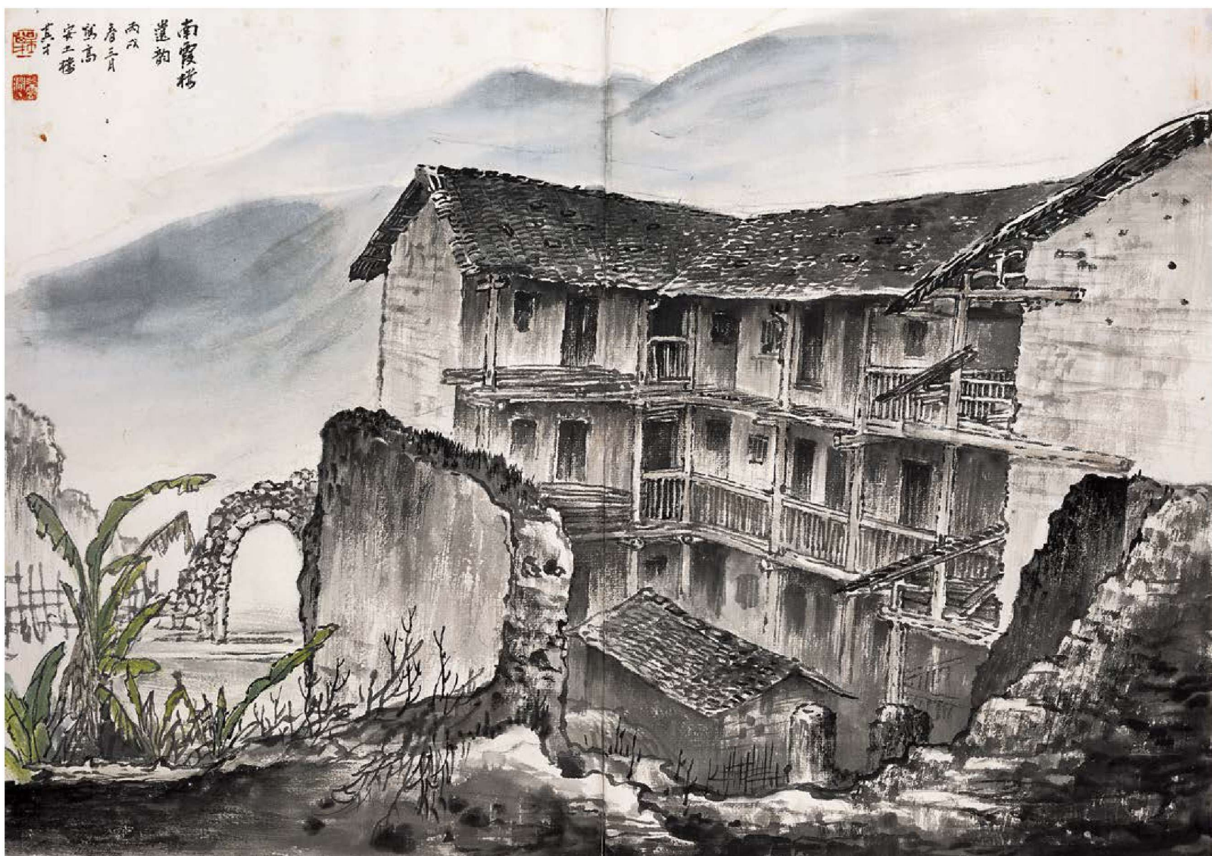
4. 南霞楼遗韵 64cm×45cm 2006年