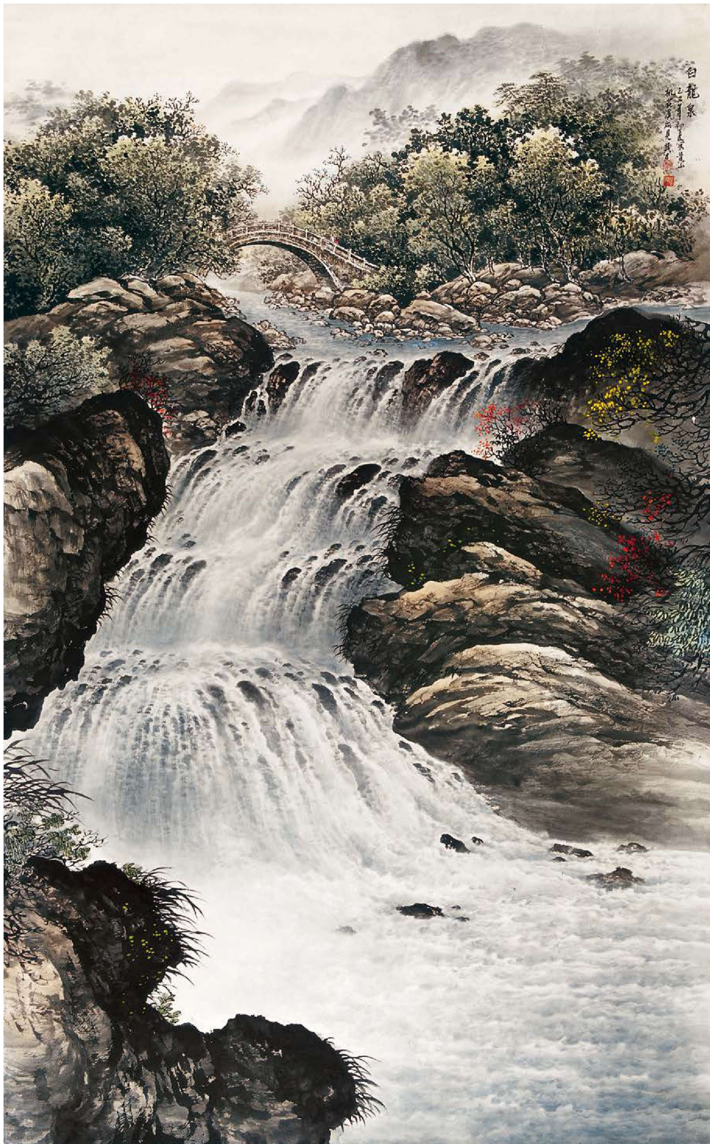
《白龙泉》 155cm×97cm 2009年

第四步 用花青、赭石、藤黄等着山石的颜色，可以偏暖色的色调加强体现树、石与水的冷暖反差，最后染天空并点出拱桥上的人物。