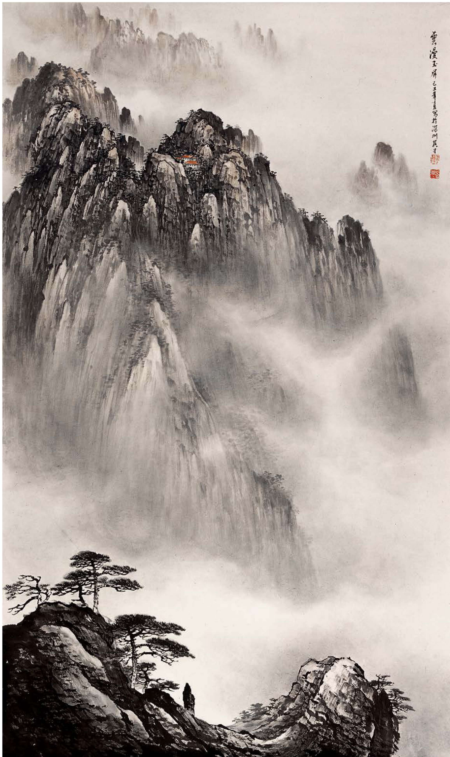
《云漫玉屏》 120cm×71cm 2009年