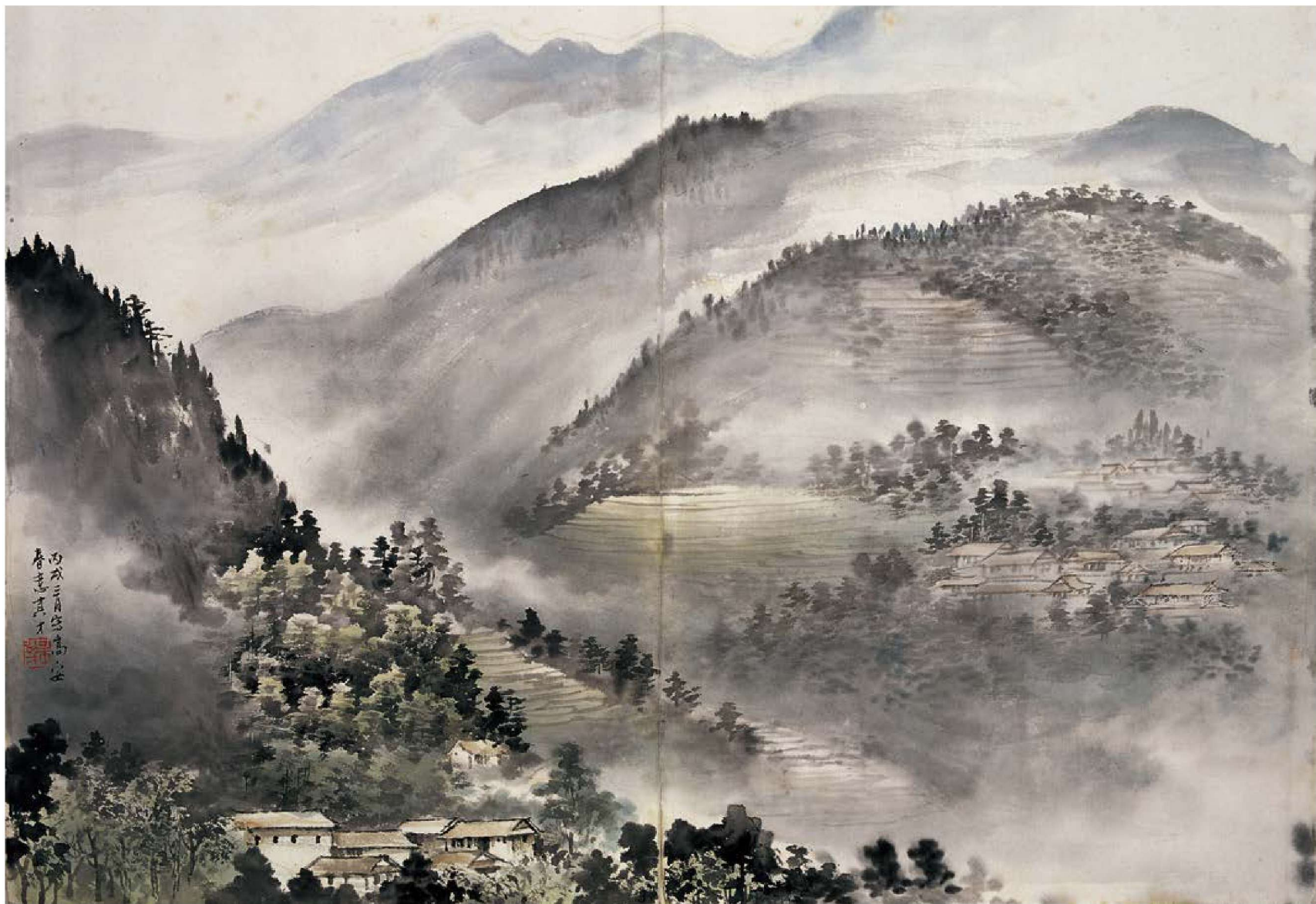
3. 春意 64cm×65cm 2006年