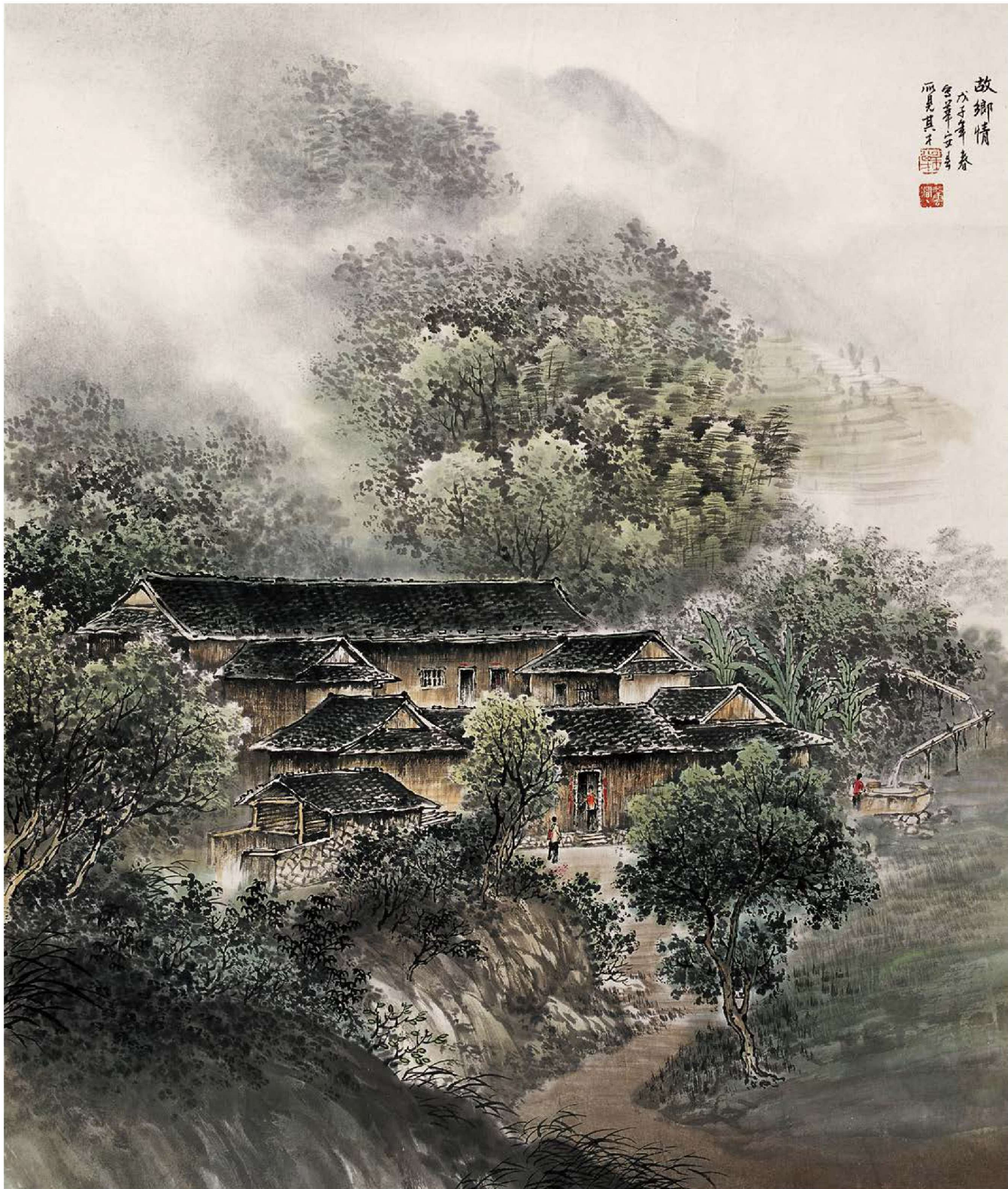
1. 故乡情 69cm×59cm 2008年