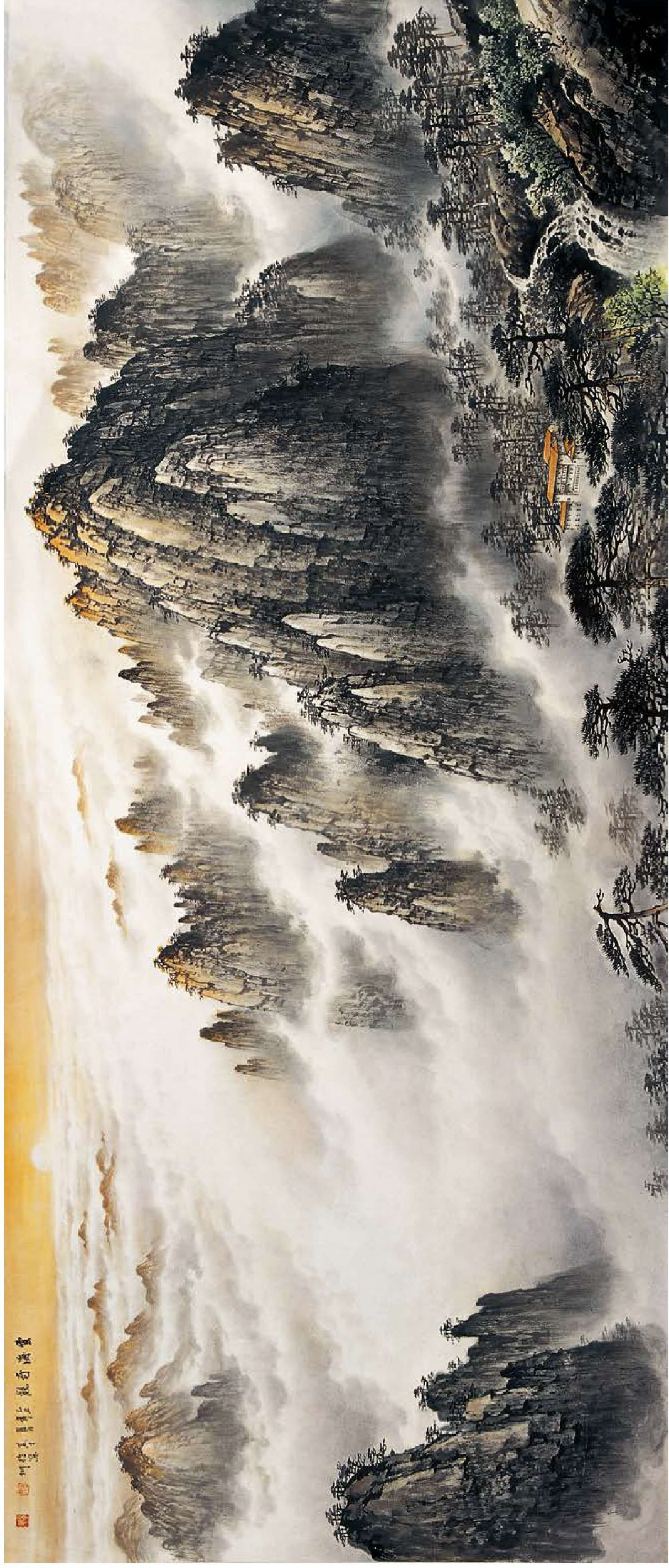
《云海奇观》 180cm×76cm 2009年

第四步 在太阳周围染上天空，云层与天空之间要表现出具有距离感的效果。最后用赭墨色稍加花青着色山石，山顶着色用朱磬加藤黄加染，这样就有阳光照耀的感觉了。