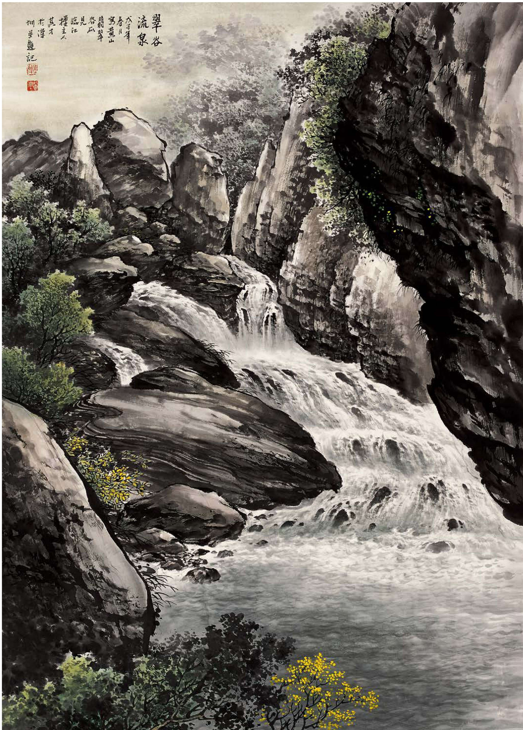
2. 翠谷流泉 99cm×68cm 2008年