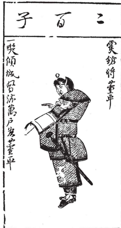
《水浒叶子》(选)之二十三