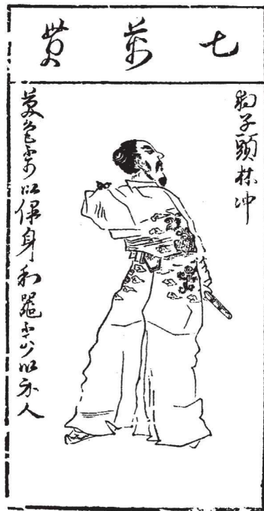
《水浒叶子》(选)之三十三