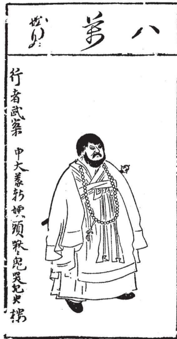
《水浒叶子》(选)之二十