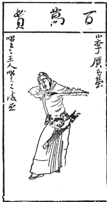
《水浒叶子》(选)之十五