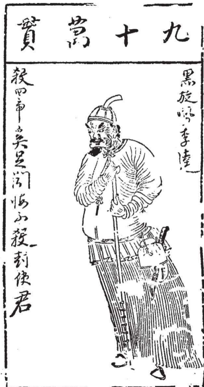
《水浒叶子》(选)之三十二