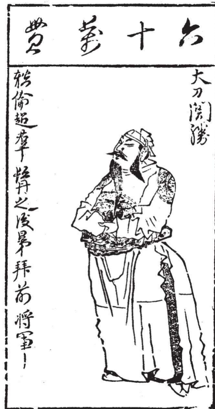
《水浒叶子》(选)之十一