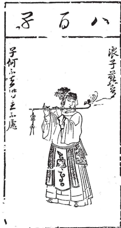
《水浒叶子》(选)之二十二