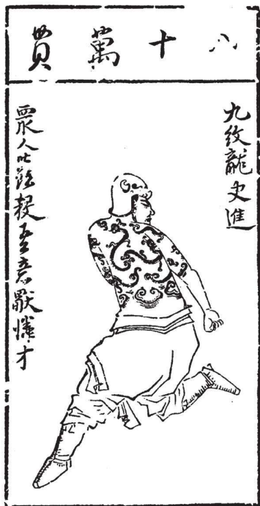
《水滸叶子》(选)之十四