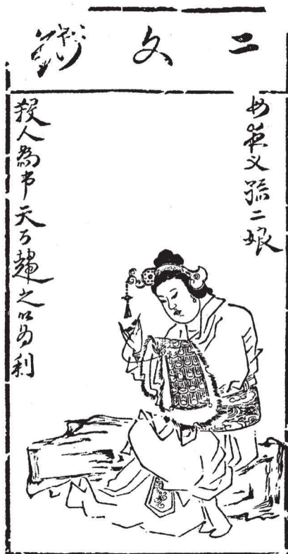
《水滸叶子》(选)之十二