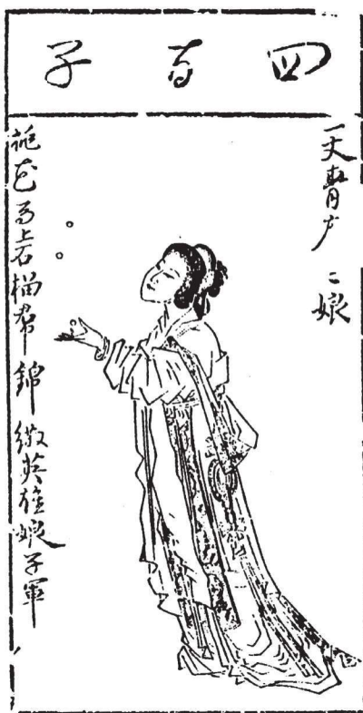
《水滸叶子》(选)之十三