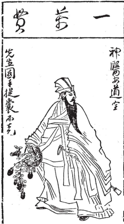
《水浒叶子》(选)之二十一