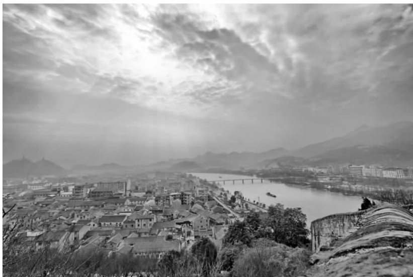
始建于东晋的台州府城墙、灵江、巾山与括苍山脉构成的山水景观

宗称为“诗书画三绝”的广文馆博士郑虔(691—764),字赳庭,又字若斋,因受安禄山之乱的牵连,至德二年(757)被贬为台州司户参军,在台七年,死于任所,子孙留居临海。宋大理寺少卿楼观的《祠斋壁志》称:“时台人朴陋,少习礼文,古粤之风,犹未尽变,公之衣冠言动,特出于俗,人反嫌之,故当时为之语曰:‘一州人怪郑若齐,郑若齐怪一州人。’尝自联云:‘著作无功千里窜,形骸违俗一州嫌。’且窃叹曰:‘东鲁圣人泽加天下,而台不被其泽者?……夫君子所过者化,今吾谪此,则教化之责,吾当任之。’因选民间子弟教之,大则冠婚丧祭之礼,小则升降揖逊之仪,莫不身帅。……于是大阐文教,而台民俗日淳,士风渐振。”这是中原习俗经过人为努力而进入台州的一条很具体的记载。因此说,台州能够“民俗日淳,士风渐振”,我们可以毫不含糊地说,当归功于广文博士的“以身帅之”。那时,台州民风淳朴,淡泊明志,正如民国《台州府志》引宋《风土志》云:“隋唐以来,士不以功名为念。宋兴,文物之盛,始读书务学,相踵登第。”