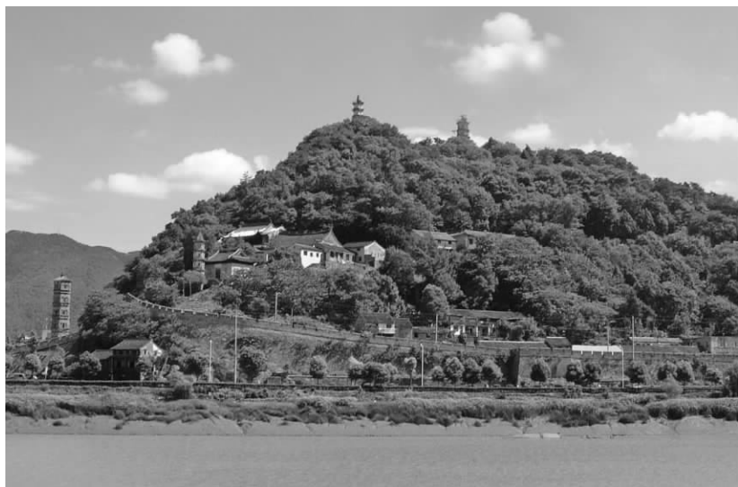
灵江南岸眺望台州府城墙

俗差异明显：山谷丘陵之民樵采狩猎、聚族而居，宗族观念较重，淳朴尚武；平原稻作之民种稻植果、喜互通生意，性格温和圆通；滨海海作之民打鱼晒鲞，终年与海浪相伴，民风豪迈刚烈讲义气。这些丰富多彩、颇具特色的民俗文化既反映在岁时节俗之中，也反映在各地独特的衣食住行，以及手工技艺、咏唱表演中。以居屋为例：沿海为防台风袭击，大多房檐低矮，房顶加固，窗户较小；平原屋檐较高，且多宽檐，檐下有廊，既利采光，又避雨水；山区多平屋，以块石或卵石为墙，就地取材。