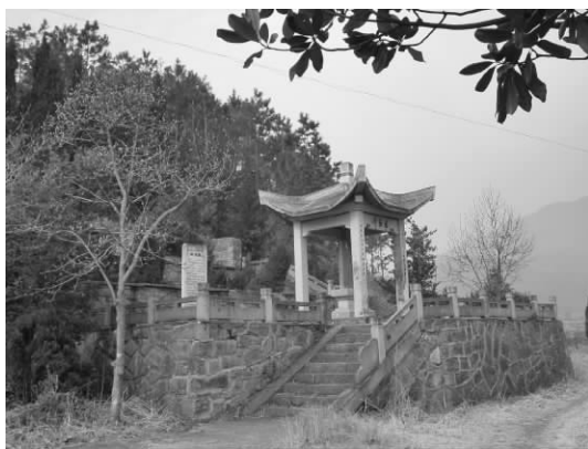
浙江省重点文保单位——郑虔墓