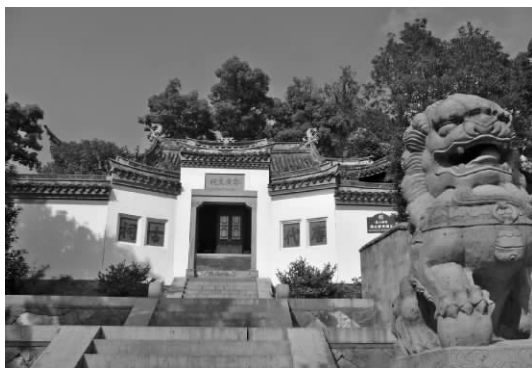
唐代古祠——临海郑广文祠(郑虔纪念馆)