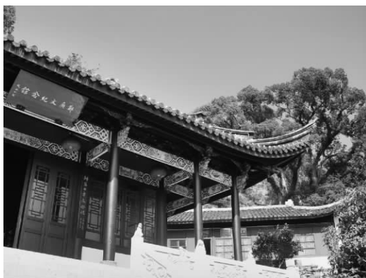
临海郑广文祠内景