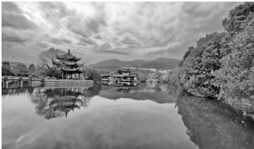
台州州治临海始建于北宋的东湖与北固山、白云山构成的山水景观

在两浙地区割据的吴越王国，奉行保境安民、长治久安的基本国策，对中原朝廷恭顺不悖，贡奉无缺，辖境内基本上没有发生过战事，社会相对安定，行政区划大体不变。自唐乾宁四年（897）进入台州，直到北宋太平兴国三年（978）纳土归宋，吴越国统治台州达八十多年间。其间，吴越国的统治者先后派到台州的 28 任刺史中，钱氏王族就占了 9 任，其中龙德元年至三年（921—923）在任的钱镒是吴越国王钱鏐的弟弟；开运三年（946）在任的钱弘俶，离任两年后，从公元 948 年到 978 年，当了 31 年的吴越国王。广顺二年（952），钱弘俶将台州刺史吴延福调入京城，入参相府事，同时以他的弟弟钱弘仰接任台州刺史，直到显德五年（958）。当时的台州与吴越国统治者非同寻常的关系，使台州在唐末的战乱后较快地得到休养生息，进一步促进了台州经济文化事业的发展。