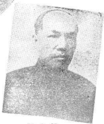
梁 启 超