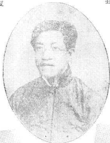
章 太 炎