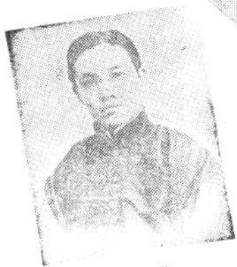
邵 飘 萍