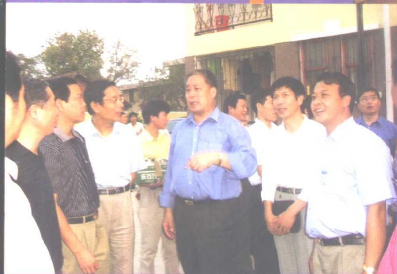
教育部副部长张宝庆来校考察后勤社会化工作

湖北大学是湖北省人民政府主管的重点综合性大学，湖北大学校舍建筑面积41万平方米，现建校舍面积18万平方米，拥有文、史、哲、理、工、经、法、管、教、医等十大学科门类。学校现有人文、商学、法学、数学与计算机科学、生命科学、物理学与电子技术、化学与材料科学、教育、体育、外国语等10个学院，设有成人教育学院、国际文化交流学院、武昌分校、职业技术学院、人民武装学院，另建有23个研究院、所、中心；有中国语言文学、化学生物学国家文理科基础学科人才培养与科学研究基地；共有15个省级重点学科、1个省级重点实验室和湖北省高分子材料中试基地。湖北省高等学校师资培训中心、中英成人英语培训中心也设在该校。校本部共有42个本科专业，35个硕士学位点。学校在校生人数2.2万人，其中在校全日制研究生、本专科生1.4万人。湖北大学现有专任教学科研人员近800人，其中有院士3人（袁隆平、宋大祥、林群），“楚天学者”特聘教授1人，22人被授予国家级、省级有突出贡献的中青年专家，47人享受国务院、省、市政府津贴。