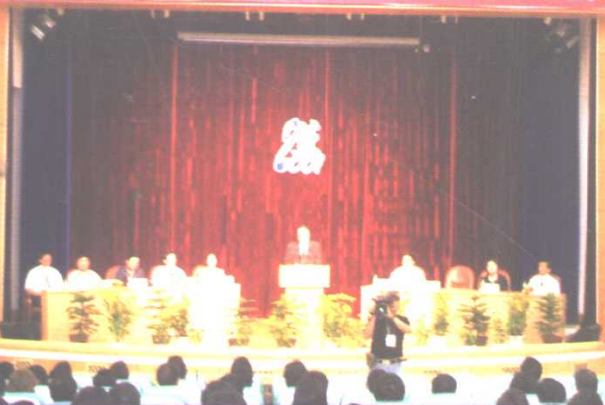
国际学术研讨会在我校举行