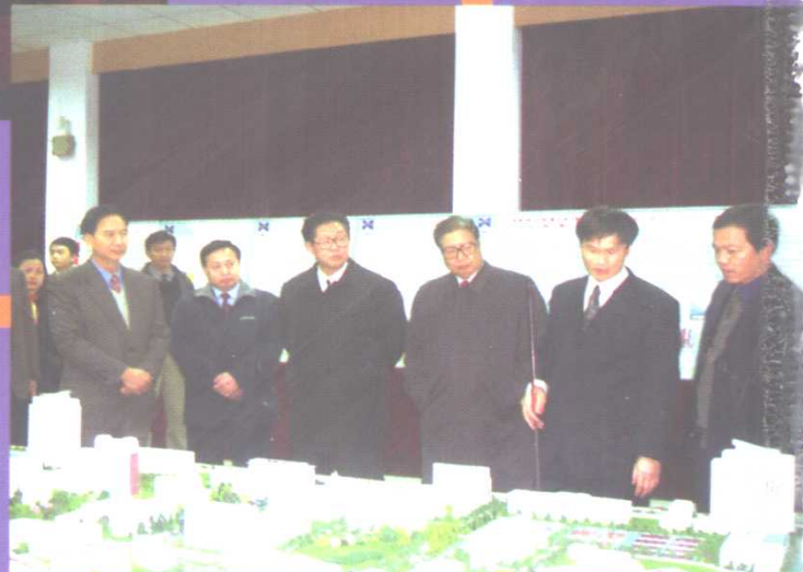
全国人大教科文委体委员会副主任、原湖北省省委书记蒋祝平、湖北省省长张国光、省委副书记罗清泉、副省长王少阶来校视察