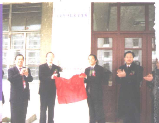
湖北大学贵州水晶有机化工集团有限公司聚合物乳液工程中心挂牌