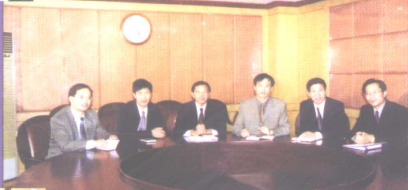
精诚团结的领导班子