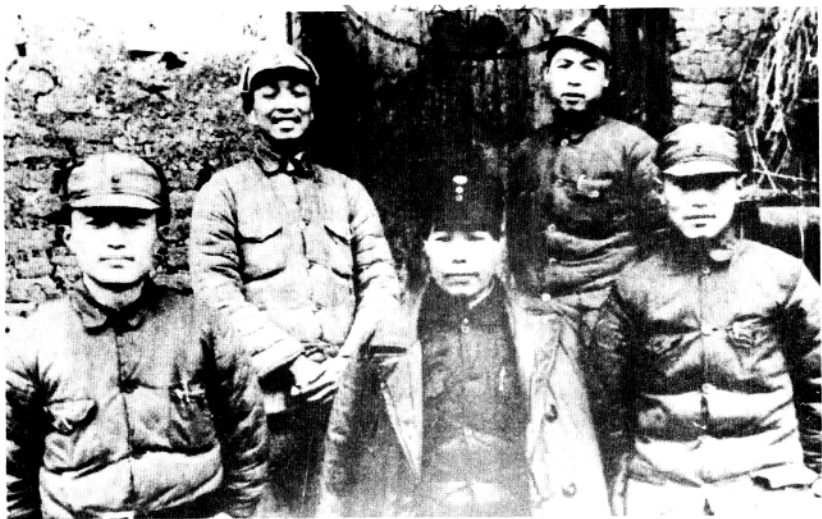
1940年2月新四军鄂豫挺进纵队负责干部在湖北京山县八字门合影 (自右至左：李先念、刘少卿、陈少敏、郑绍文、朱理治)