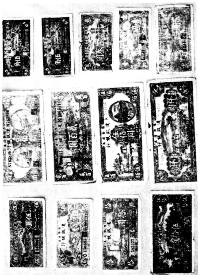
抗日战争时期鄂豫边区建设银行发行的部分钞票式样