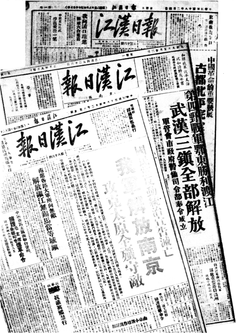
解放战争时期出版的江汉日报