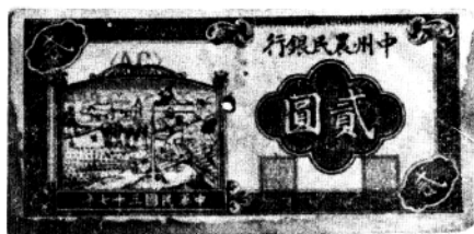
左图：解放战争时期江汉解放区中州农民银行发行的钞票式样