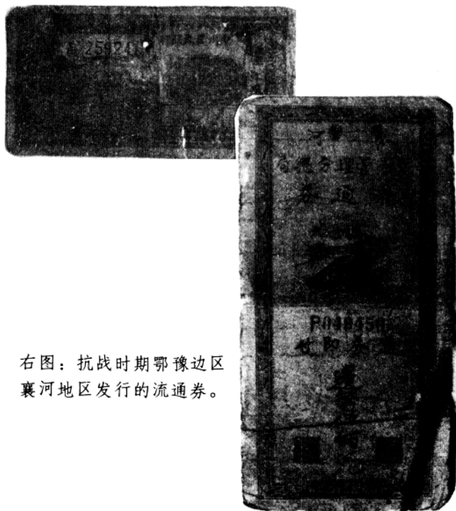
右图：抗战时期鄂豫边区襄河地区发行的流通券。