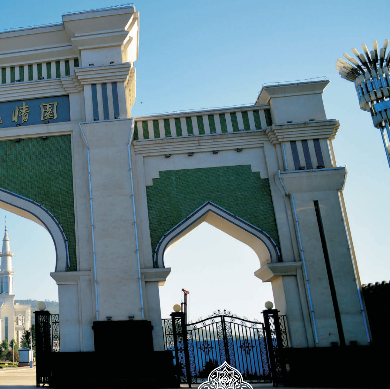
晨曦里的回乡风情园