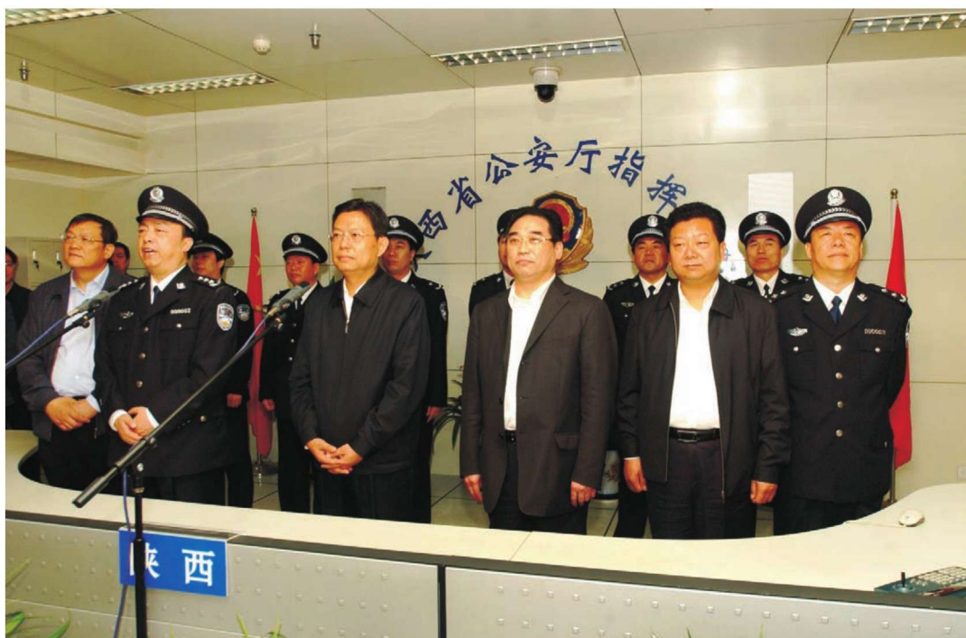
2007年2月16日，陕西省委书记赵乐际（左二）在省委常委、政法委书记、公安厅党委书记宋洪武（左三），公安厅厅长王锐（左一）陪同下，到公安厅指挥中心慰问全省公安民警。