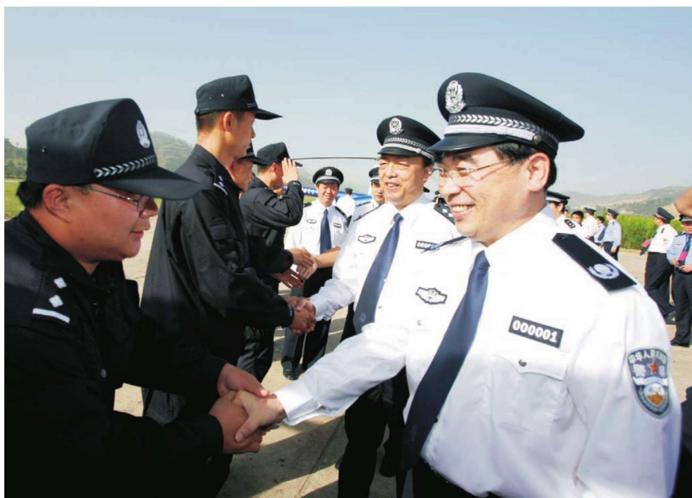
2008年6月23日，省委常委、政法委书记兼省公安厅党委书记宋洪武（右一）、省公安厅厅长王锐（右二）在延安召开的全省奥运会安保暨三基建设汇报演练会议上接见参演民警。