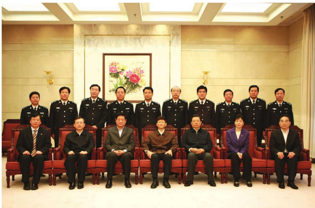
2011年4月2日，国务委员、公安部部长孟建柱来陕视察期间，与省委、省政府领导，公安厅班子成员合影。前排左起：常务副省长娄勤俭，公安部副部长黄明，省长赵正永，公安部部长孟建柱，省委书记赵乐际，省委副书记王侠，省委政法委书记宋洪武。