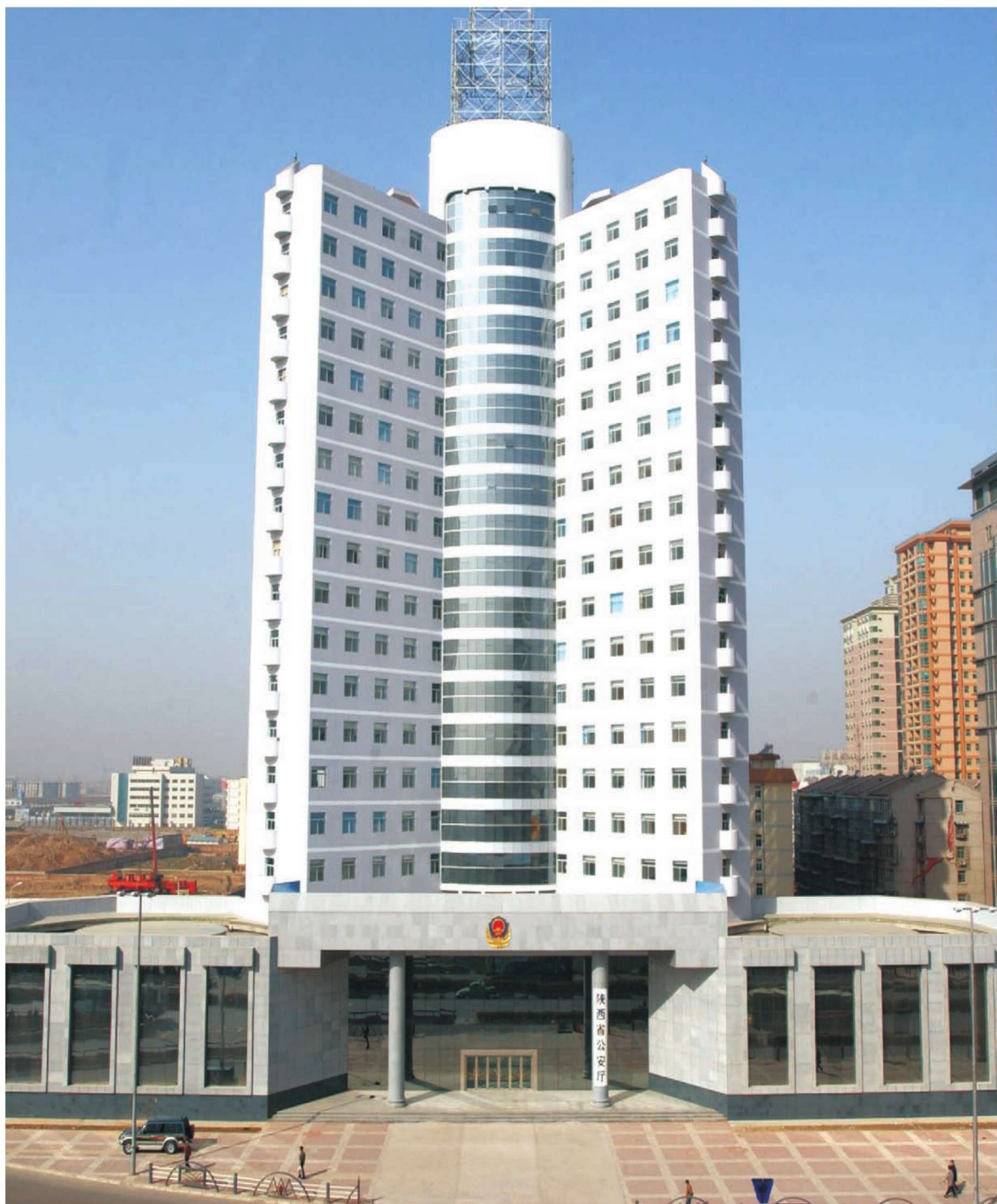
陕西省公安厅办公大楼