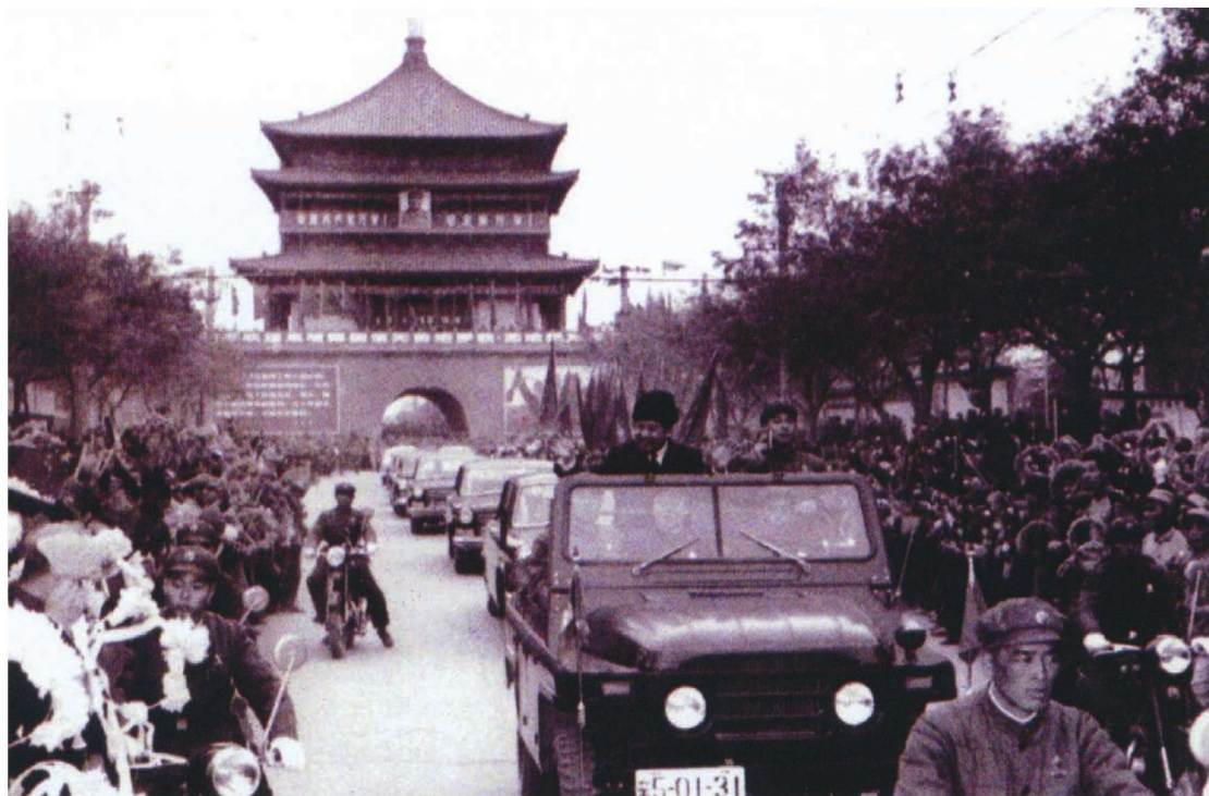
1970年11月16日，柬埔寨国家元首诺罗敦·西哈努克亲王访问西安。