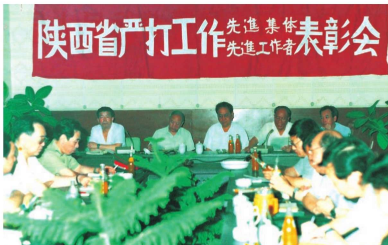
1991年6月25日，省上领导出席全省严打工作表彰会。