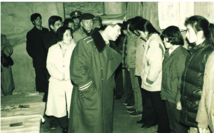
省人大常委会副主任刘力贞（左一）视察咸阳市渭城区女子戒毒所。