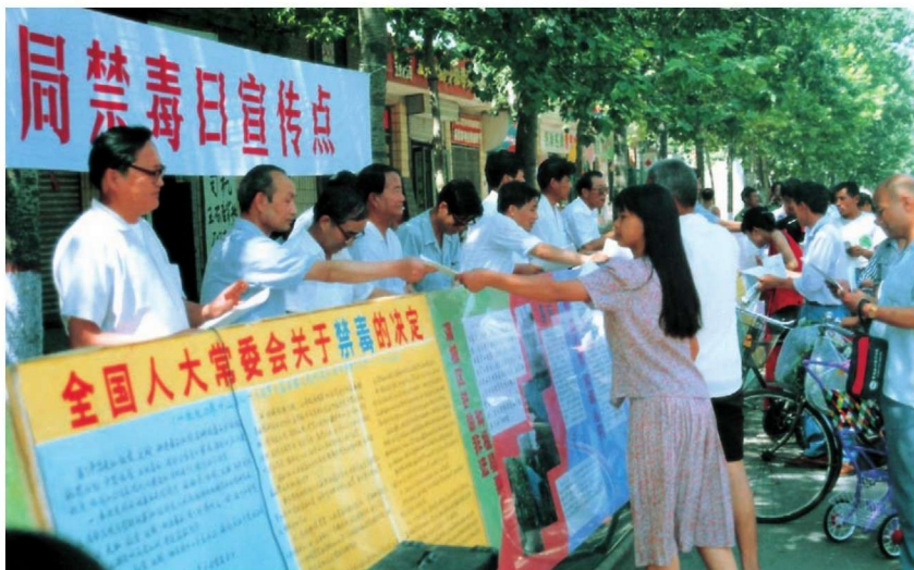
20世纪80年代，陕西开展禁毒宣传。