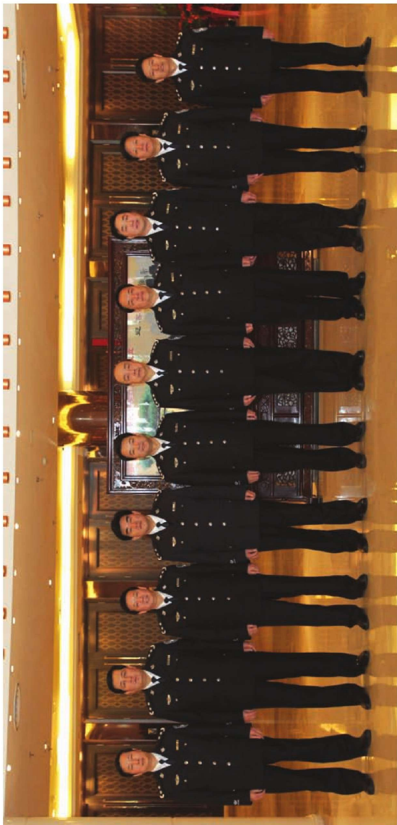
2011年1月13日，省公安厅党委成员合影。左起：政治部主任向书茂，副厅长马中林、董明军、许强、杜航伟，党委书记、厅长王锐，副厅长雷鸣放、陈里、张恒，纪委书记田粹。