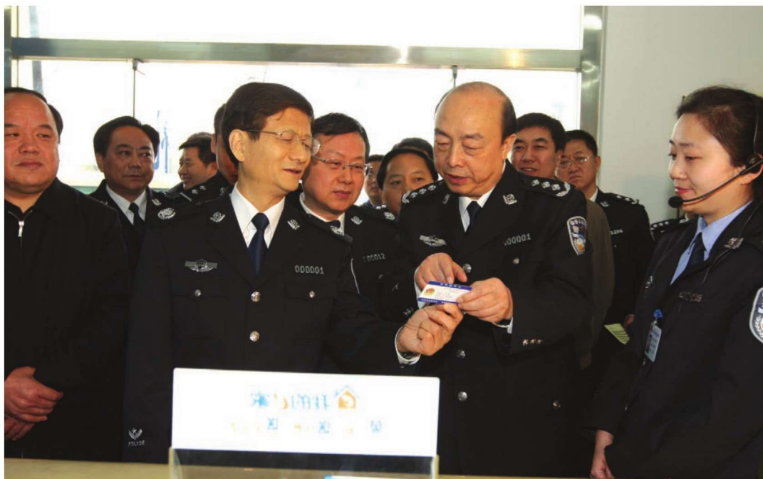
2011年4月1日，国务委员、公安部部长孟建柱（左二）在省公安厅厅长王锐（右二）陪同下到汉中市公安局汉台分局七里派出所视察。