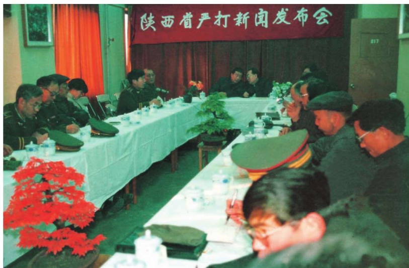
1990年5月，陕西省委、省政府举办严打刑事犯罪新闻发布会。