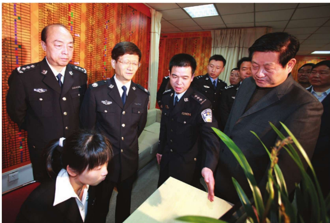
2011年3月31日，省委副书记、省长赵正永（右一）陪同国务委员、公安部部长孟建柱（左二）在西安华城国际社区警务室视察。省公安厅厅长王锐（左一）陪同视察。