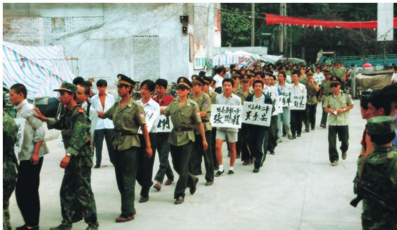
严厉打击毒品犯罪分子。