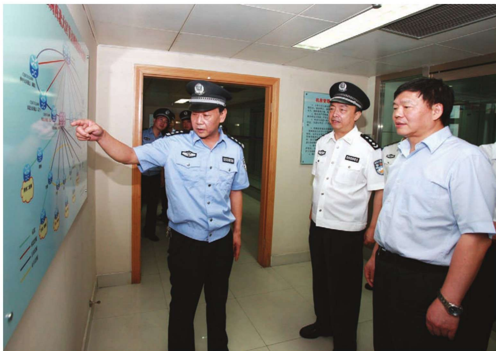
2010年9月14日，陕西省常委、副省长娄勤俭（右一）在省公安厅厅长王锐（中）陪同下视察公安厅信息化建设。