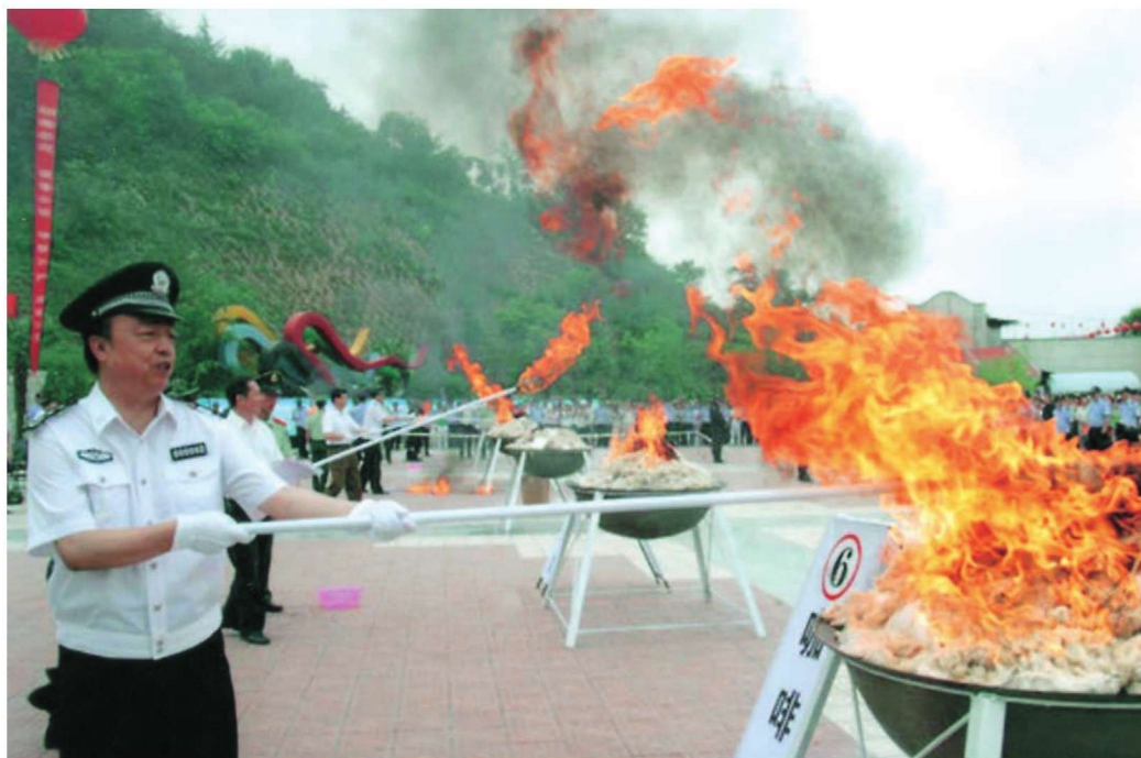
“6·26”禁毒日公开销毁毒品