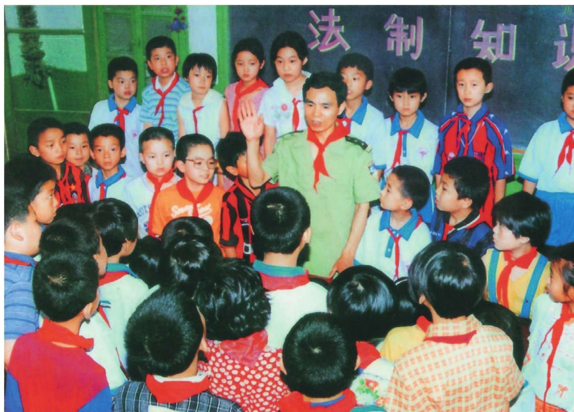
公安民警向小学生讲授禁毒知识