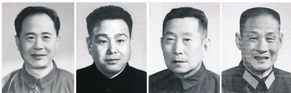
伊里 (1973.8—1978.8) 智泽民 (1978.8—1980.11) 邓国忠 (1980.11—1981.11) 高步林 (1981.11—1985.6)