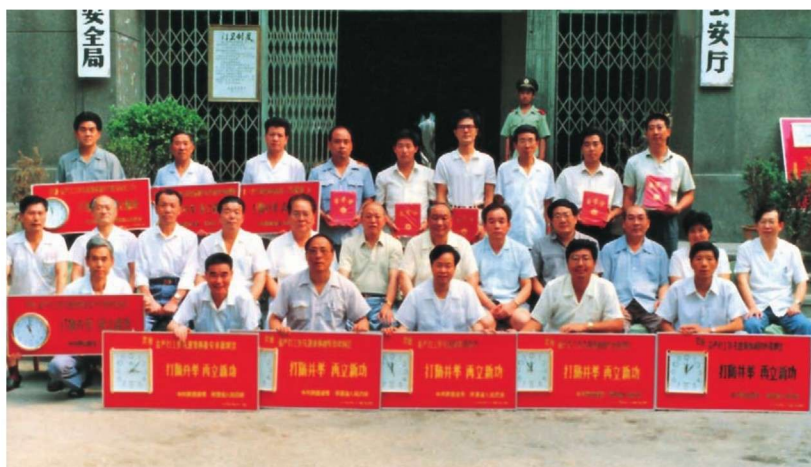
荣获省委、省政府表彰的全省严打工作先进集体及先进个人代表合影。