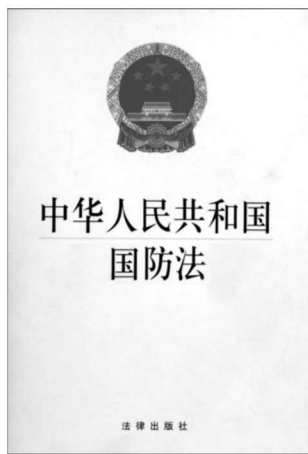
图 1-2 《中华人民共和国国防法》