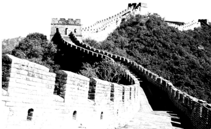
图 1-1 古代国防工程长城

长城是城池建设的延续和发展,东起山海关,西至嘉峪关,总长 6700 千米,是我国古代抵御北部少数民族侵扰的重要的边防要塞。