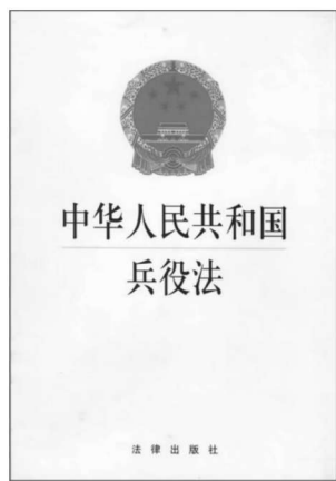
图 1-4 《中华人民共和国兵役法》

《兵役法》规定“为了对付敌人的突然袭击,抵抗侵略,各级人民政府、各级军事机关,在平时必须做好战时兵员动员的准备工作”。为此,《兵役法》第四十八条规定“在国家发布动员令以后,各级人民政府、各级军事机关,必须迅速实施动员:①现役军人停止退出现役,休假、探亲的军人必须立即归队;②预备役人员随时准备应召服现役,在接到通知后,必须准时到指定的地点报到;③机关、团体、企事业单位和乡、民族乡、镇的人民政府负责人,必须组织本单位被征召的预备役人员,按照规定的时间、地点报到;④交通运输部门要优先运送应召的预备役人员和返回部队的现役军人。”