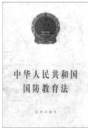
图 1-3 《中华人民共和国国防教育法》