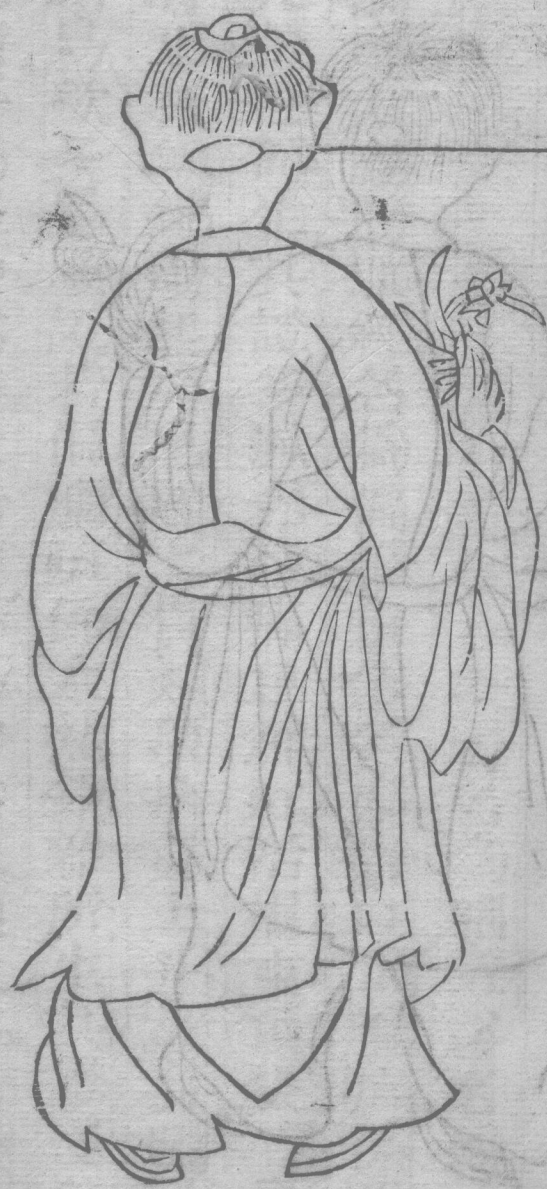
腦疽生項後入髮際正中屬督脈經