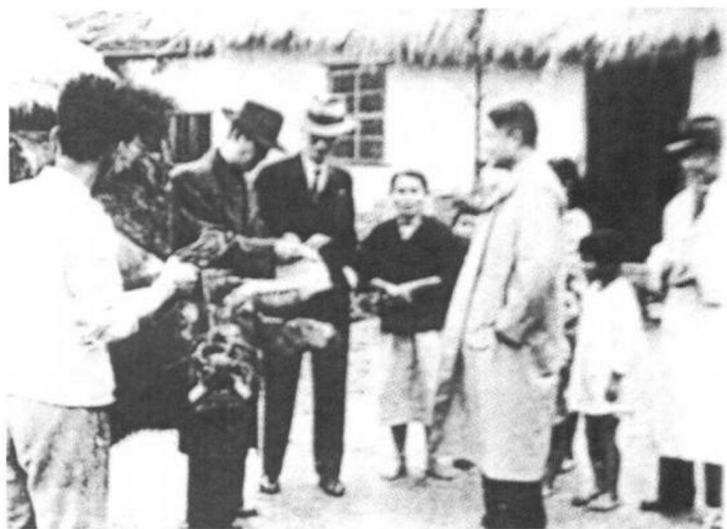
◀ 蒋梦麟在乡村访问