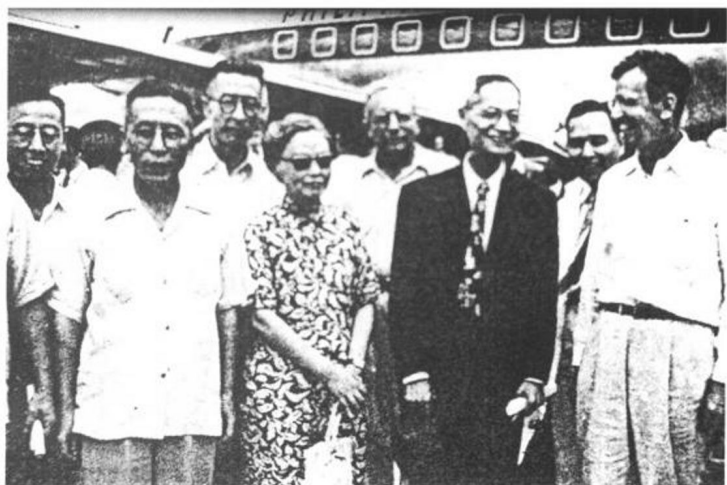
◀ 蒋梦麟前往菲律宾领奖