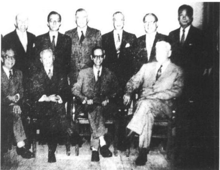
▲1955年蒋梦麟(前排左三)与中华教育文化基金会部分委员合影