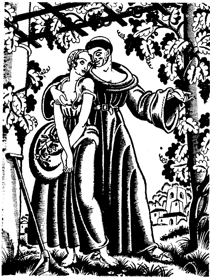
《十日谈》插图 第一天 故事第四