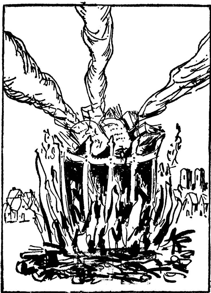
对书的镇压 [美]房龙<宽容>插图