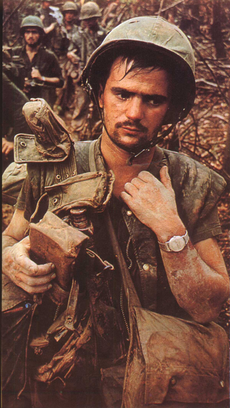
1966年10月，一队搜索敌人渗透形迹的美军陆战队侦察兵，正在浓密的丛林中以单列纵队艰辛前进，虽疲惫不堪却仍保持警惕。