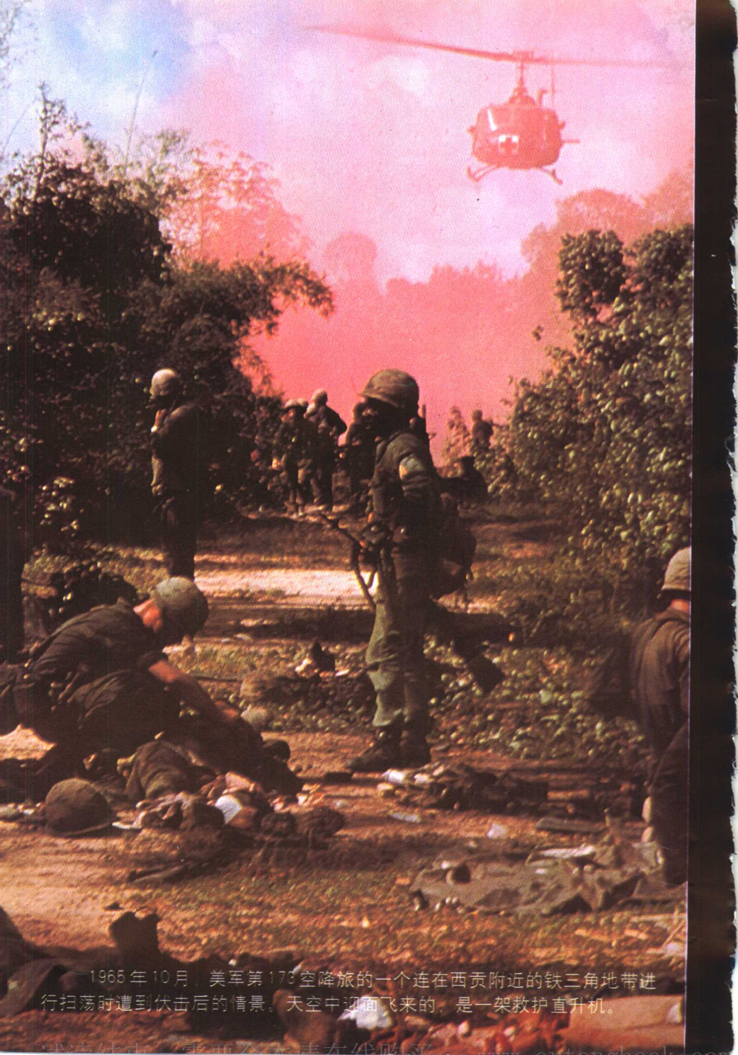
—1965年10月，美军第173空降旅的一个连在西贡附近的铁三角地带进行扫荡时遭到伏击后的情景。天空中迎面飞来的，是一架救护直升机。