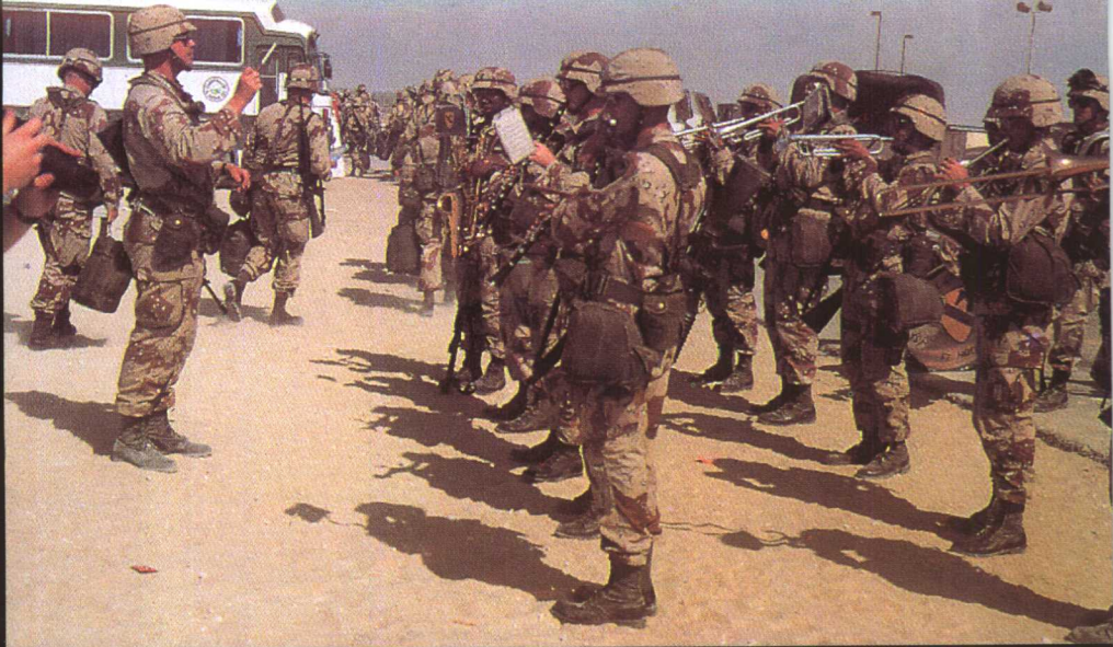
美骑一师乐队在沙特空军基地欢迎主力部队，乐手们身配M16A1冲锋枪。时间是1990年10月12日。