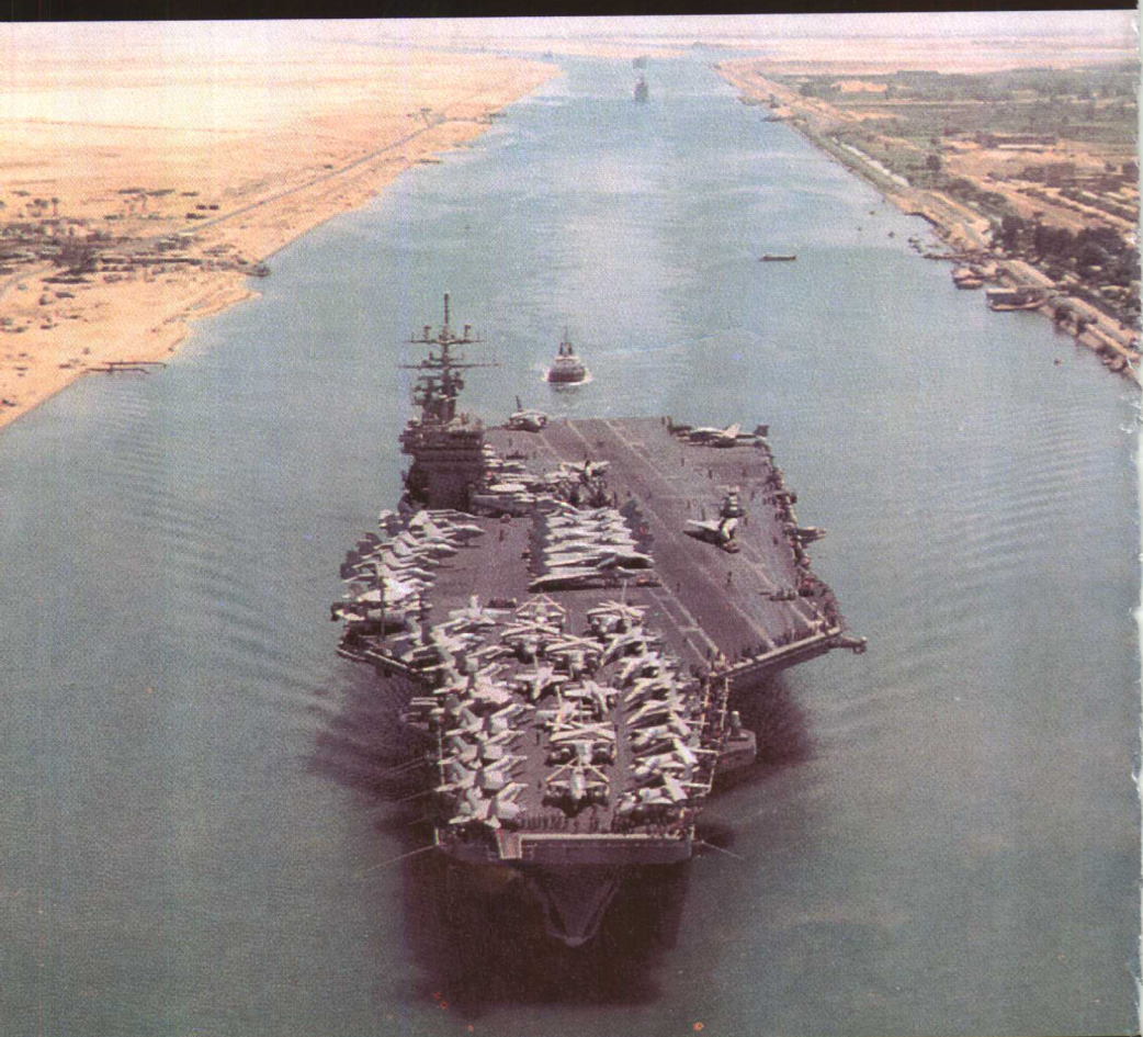
“艾森豪威尔”号航空母舰正通过苏伊士运河。1990年9月24日。