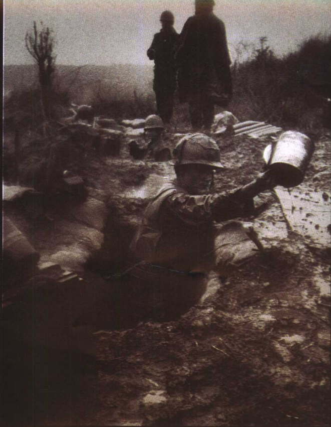
一名美国陆战队士兵，在1967年10月漫长雨季中耐心汲出战壕中的积水。

美陆战队士兵蜂拥越过一名业已倒地的同伴，正在溪山谷外缠结如砦的灌木地带艰辛前进。这是1967年春天，该地一场持续12天战役中的一景。