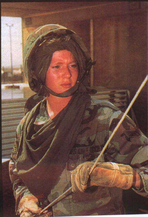
气温高达摄氏54度，女空勤队员在头盔之外又裹上了非正规的帆布带以抵挡烈日。