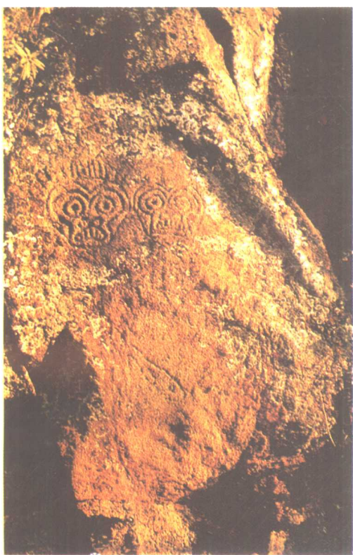
图一 中国黑龙江流域的岩刻人面