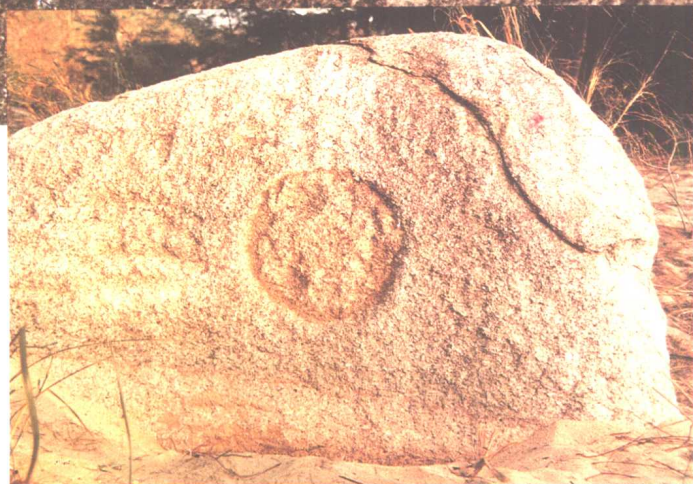
图二十三 中国珠海宝 镜湾岩刻