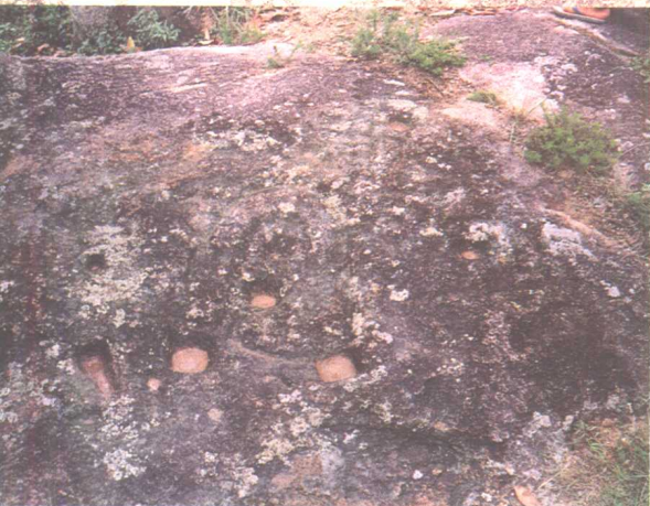
图十三 中国福建漳浦大荃 山岩刻《星云》