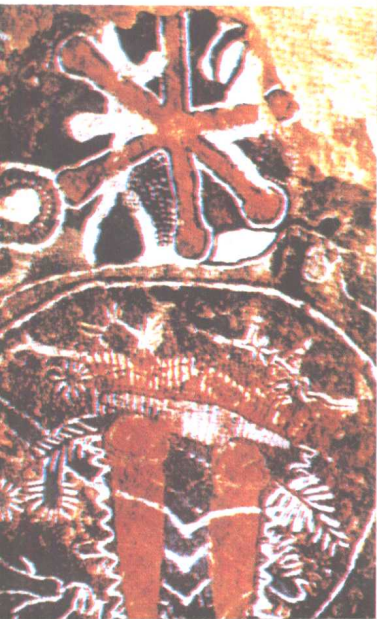
图三十三 北美洲印第安人 岩画