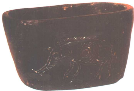
图九 中国余姚出土的陶盆刻画：《猪》、《蚕》