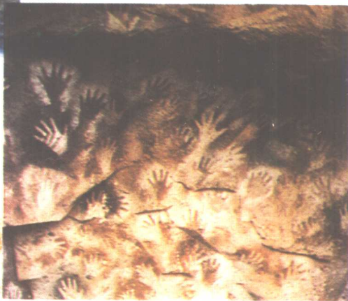
图三十二 阿根廷岩画 《手印》