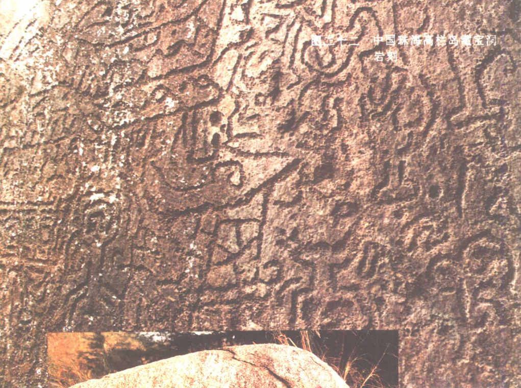
图二十二 中国珠海高栏岛濠宝洞 岩刻