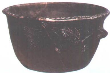
图五 中国浙江余姚河姆渡遗址出土的陶盆上有稻穗纹、禾苗纹