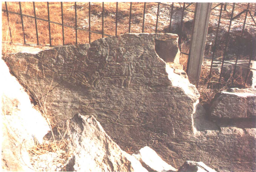
图六 中国连云港岩刻《动物》