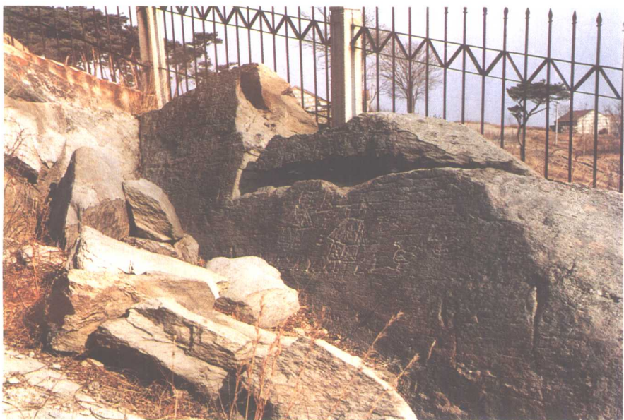
图七 中国连云港岩刻《房屋》