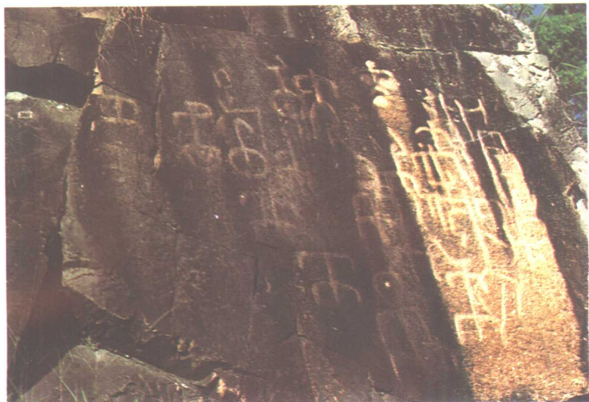
图十一 中国福建仙字潭岩刻