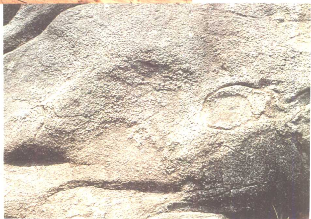
图二十四 中国珠海连 湾葫芦石岩 刻