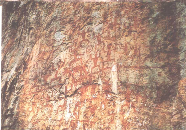
图二十六 中国广西花山岩画