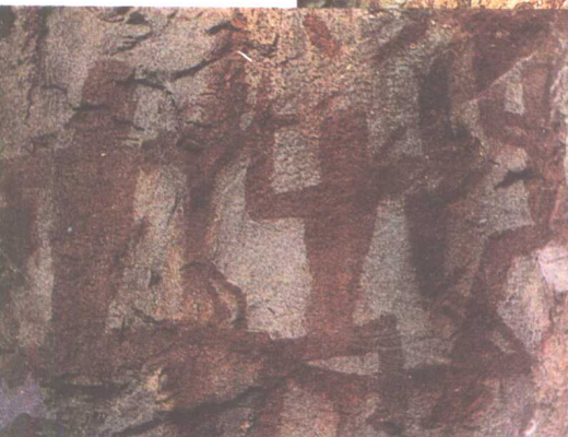
图二十七 中国广西岩画《舞蹈》