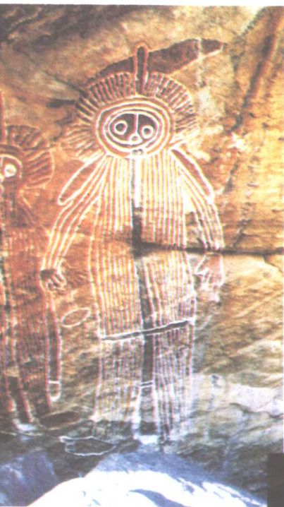
图三十一 澳大利亚岩画 《人物》