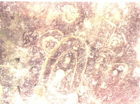
图十二 中国福建漳浦大荃 山岩刻祭祀穴