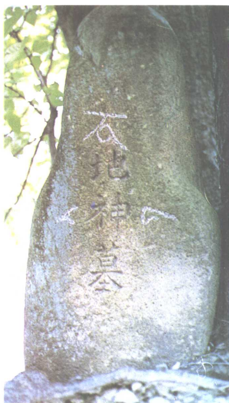
图二 日本北九州市大里藤松的地神墓上的岩刻文字