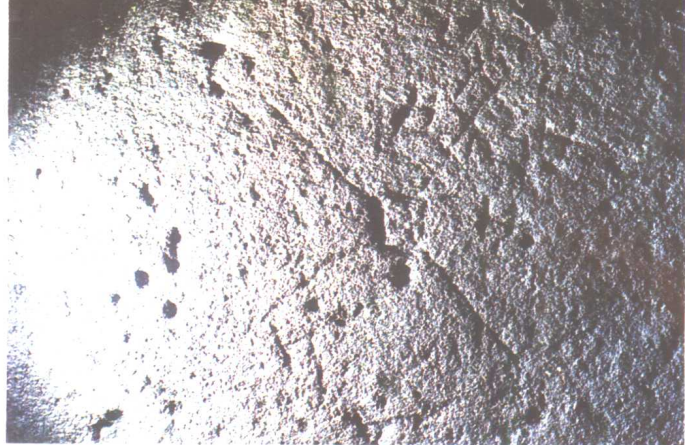
图十一 中国福建华安良村 岩刻《方向》