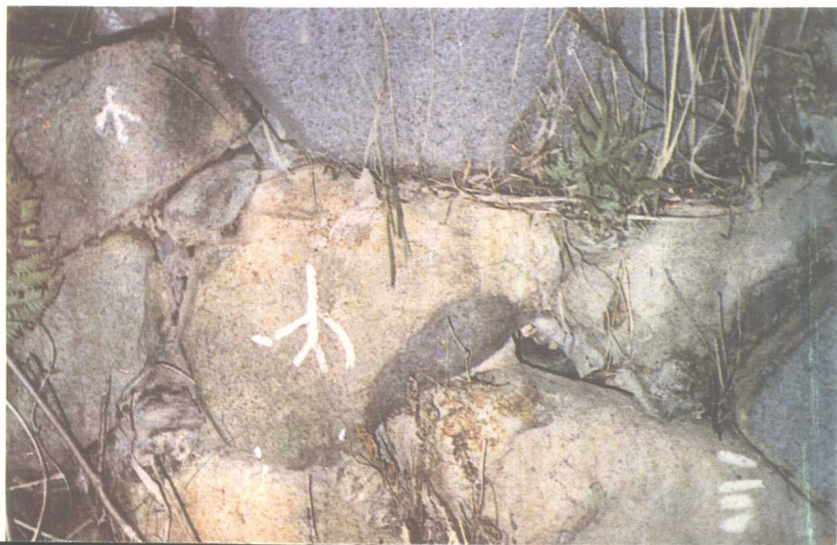
图三 在日本下关市杉田一处社宅用地上发现的岩刻文字