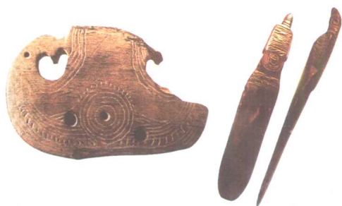
图八 中国余姚出土的牙雕饰件。刻面有《双鸟朝阳》、《太阳》、《鸟和蝉》