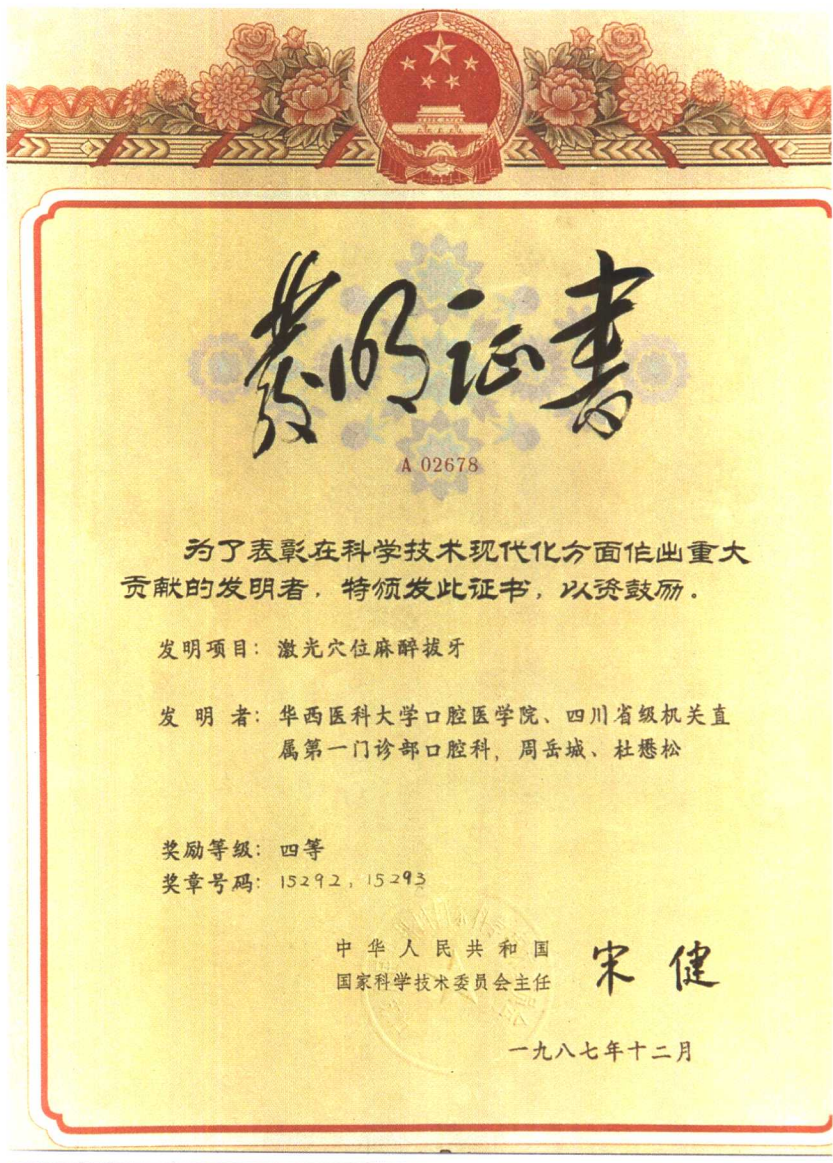
图11 1987年，中华人民共和国国家科学技术委员会 授予“激光麻醉拔牙”重大贡献的 发明奖与证书