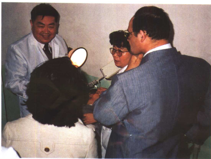
图5 1988年，法、日、俄专家来成都 参观激光美容