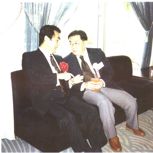
图18 在第一届“国际激光治疗学会”上， 周岳城教授与国际激光治疗学会首届主席大城俊夫博士交流