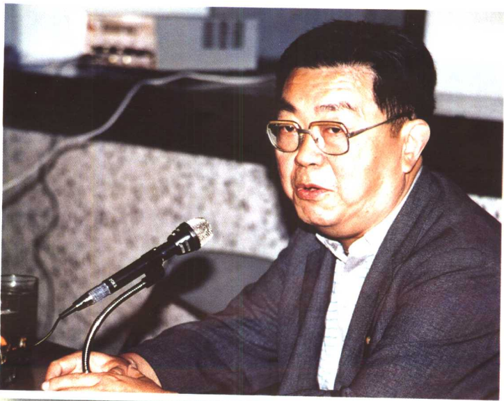
图2 1986年周岳城教授在上海作激光麻醉学术报告