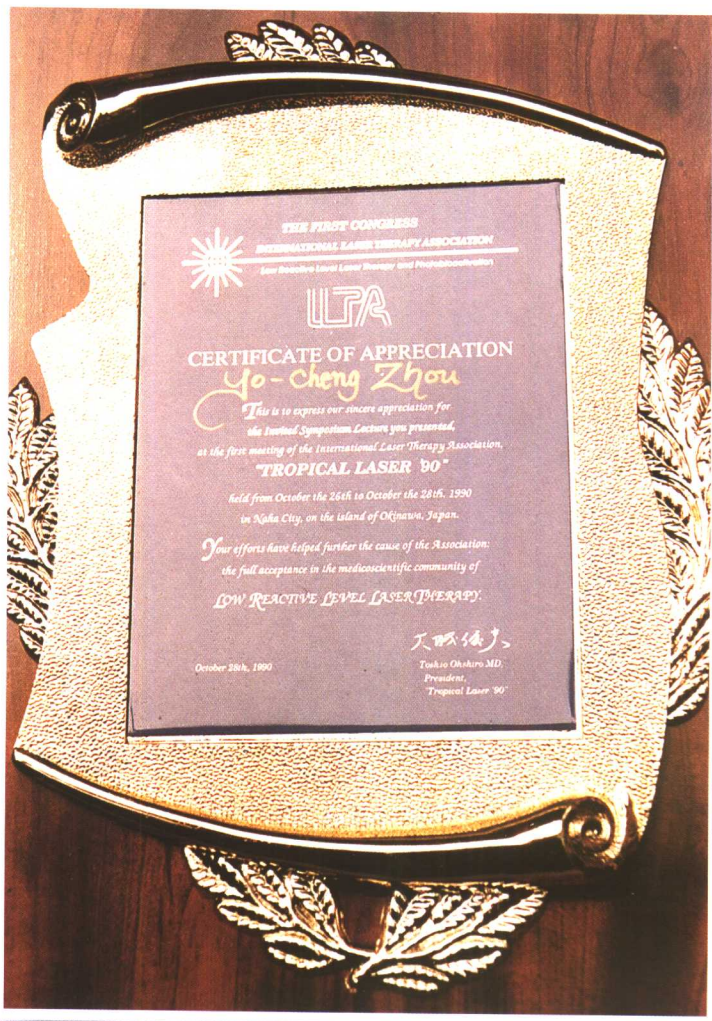
图16 1990年10月，在参加第一届 “国际激光治疗学会”上，周岳城作特邀 学术报告荣获大会金牌奖